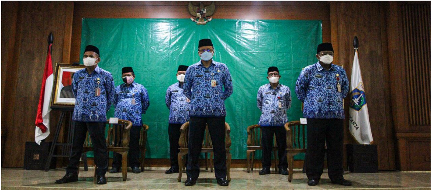
Jajaran Pemkot Administrasi Jakarta Pusat mengikuti upacara peringatan Hari Rapat IKADA ke-76 Tahun 2021.

Pemerintahan 20 September 2021 Reporter: Andreas Pamakayo | Editor: Andreas Pamakayo