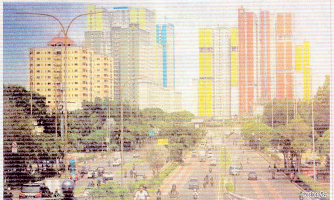
Kawasan Komplek Kemayoran yang akan dikembangkan.

Khusus untuk merawat repatriasi atau pekerja migran, pemerintah juga menggunakan wisma atlet di blok C2 lahan PPK Kemayoran tower 8,9 dan 10. (*/bi)