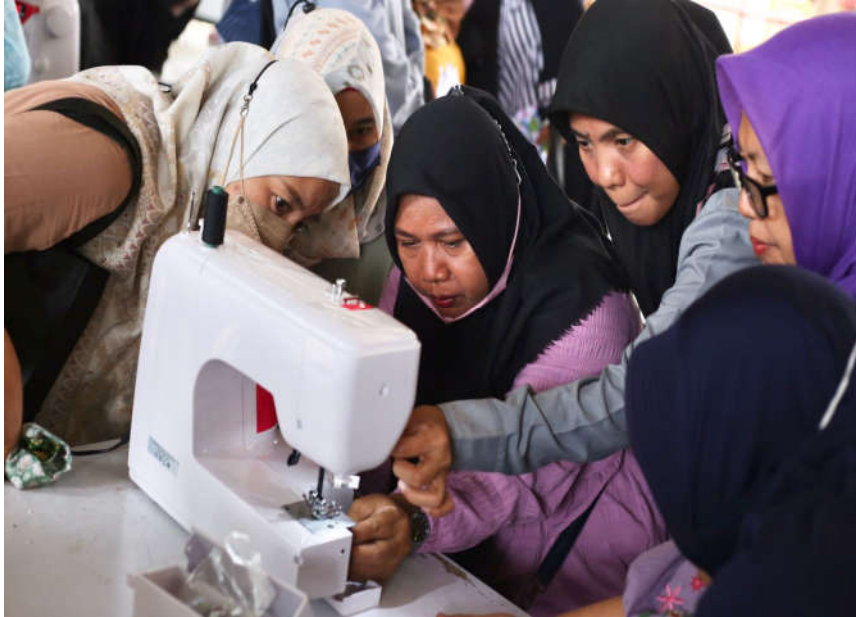
Pelatihan pemanfaatan kain perca, di RPTRA Kampung Benda, Kelurahan Cempaka Putih.