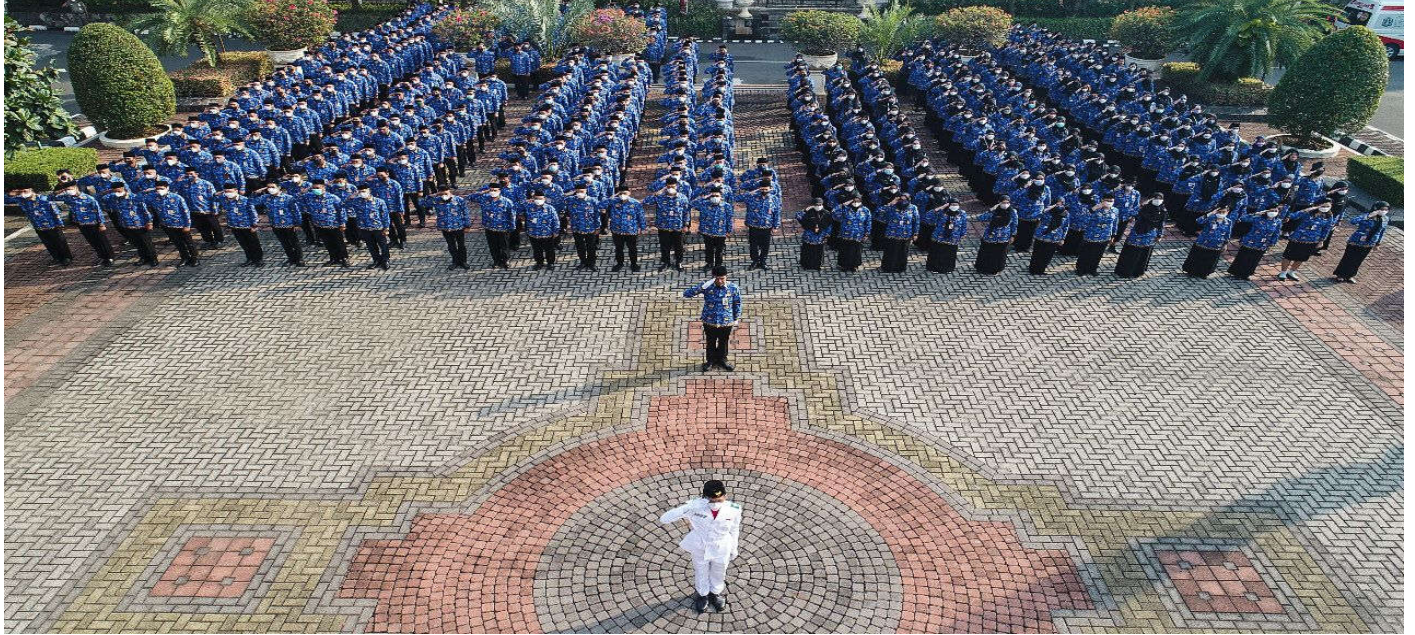
Upacara Peringatan Rapat Raksasa IKADA.

Pemerintahan 19 Sep, 2022 Reporter: Farandy Purba | Editor: Andreas Pamakayo