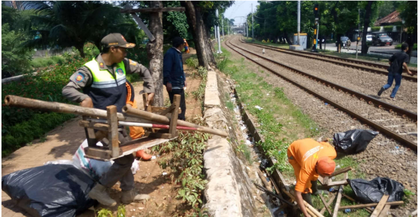
Penertiban bangunan liar di Jalan Latuharhary, Jakarta Pusat, Rabu (26/4).

Pemerintahan 26 Apr, 2023 Reporter: Zaki Ahmad Thohir | Editor: Andreas Pamakayo