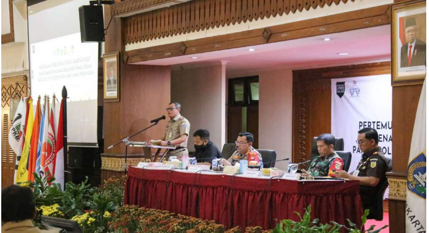
Forkopimko Jakarta Pusat menggelar deklarasi dan penandatanganan Pemilu Damai.

Pemerintahan 27 Nov, 2023 Reporter: Muhamad Aulia | Editor: Andreas Pamakayo