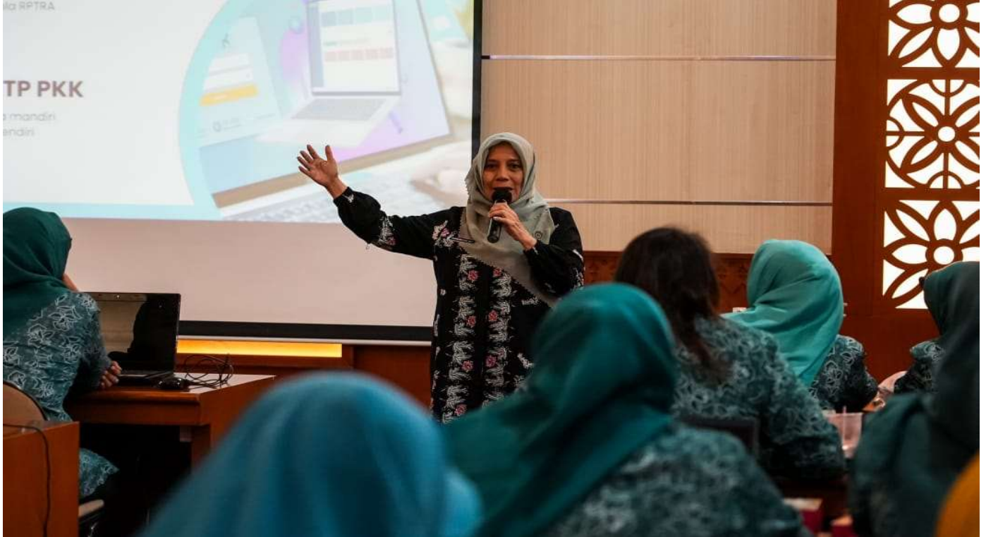
Sosialisasi pelaporan SIM-PKK.

Kesra 27 Nov, 2023 Reporter: Maulana | Editor: Andreas Pamakayo