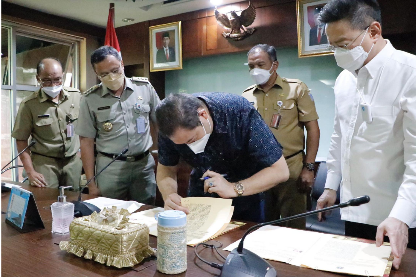
Penandatanganan Berita Acara Serah Terima (BAST) dengan PT Bangun Inti Arta.