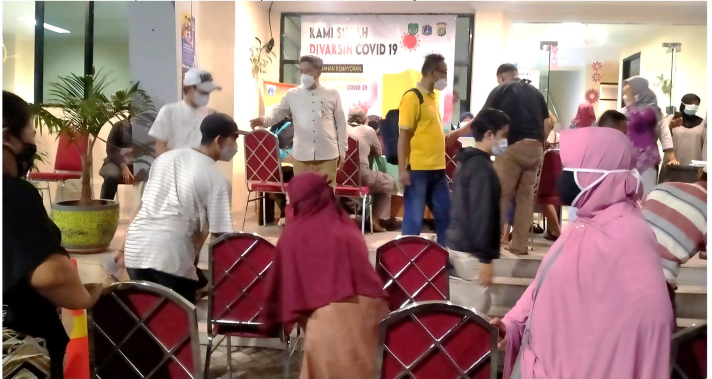
Pelaksanaan vaksinasi Covid-19 di kantor Kelurahan Kemayoran.

Kesra 8 Nov, 2021 Reporter: H. A. Daelani | Editor: Andreas Pamakayo