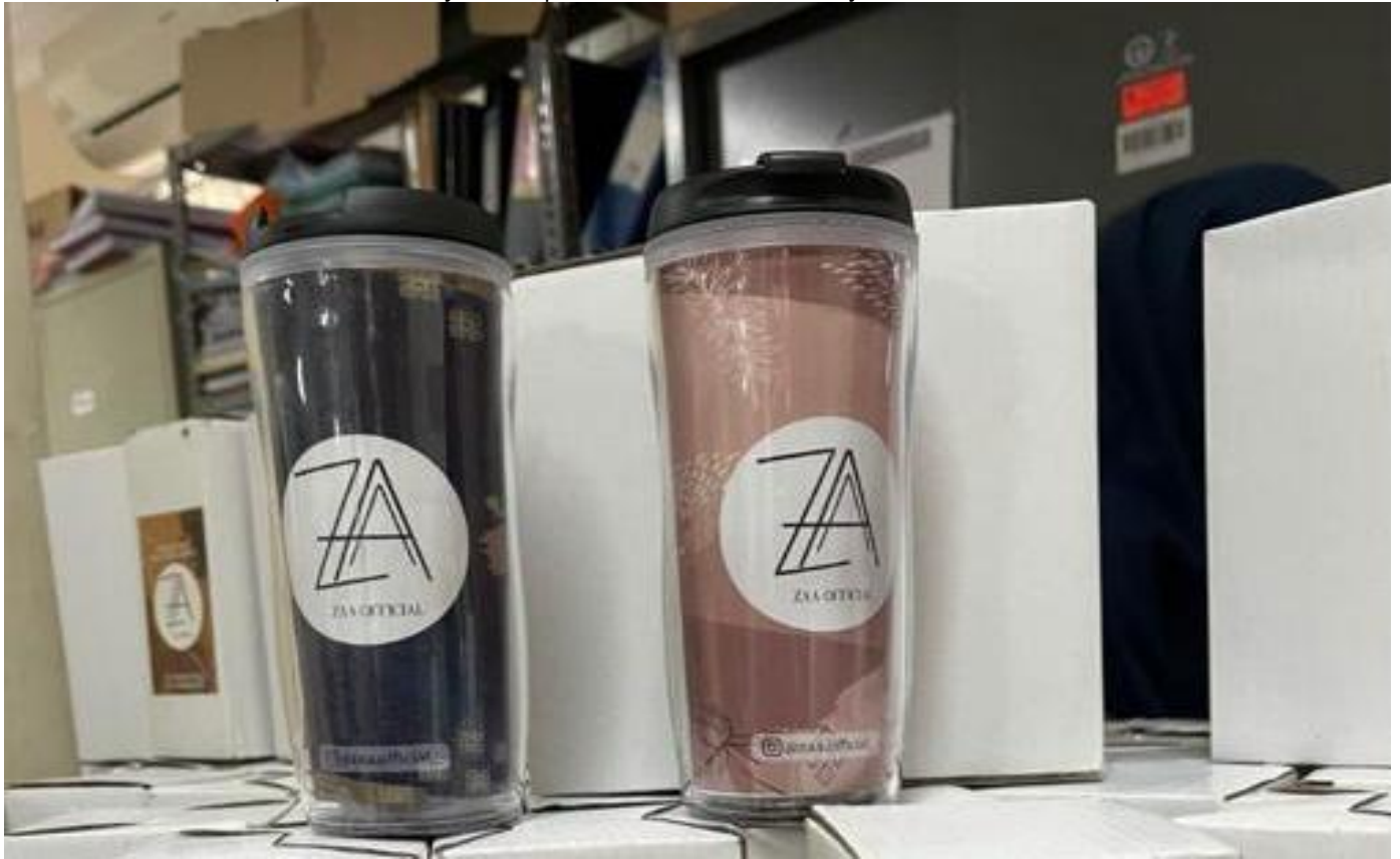
Tumbler (botol minum).

Kesra 8 Nov, 2021 Reporter: Farandy Purba | Editor: Andreas Pamakayo