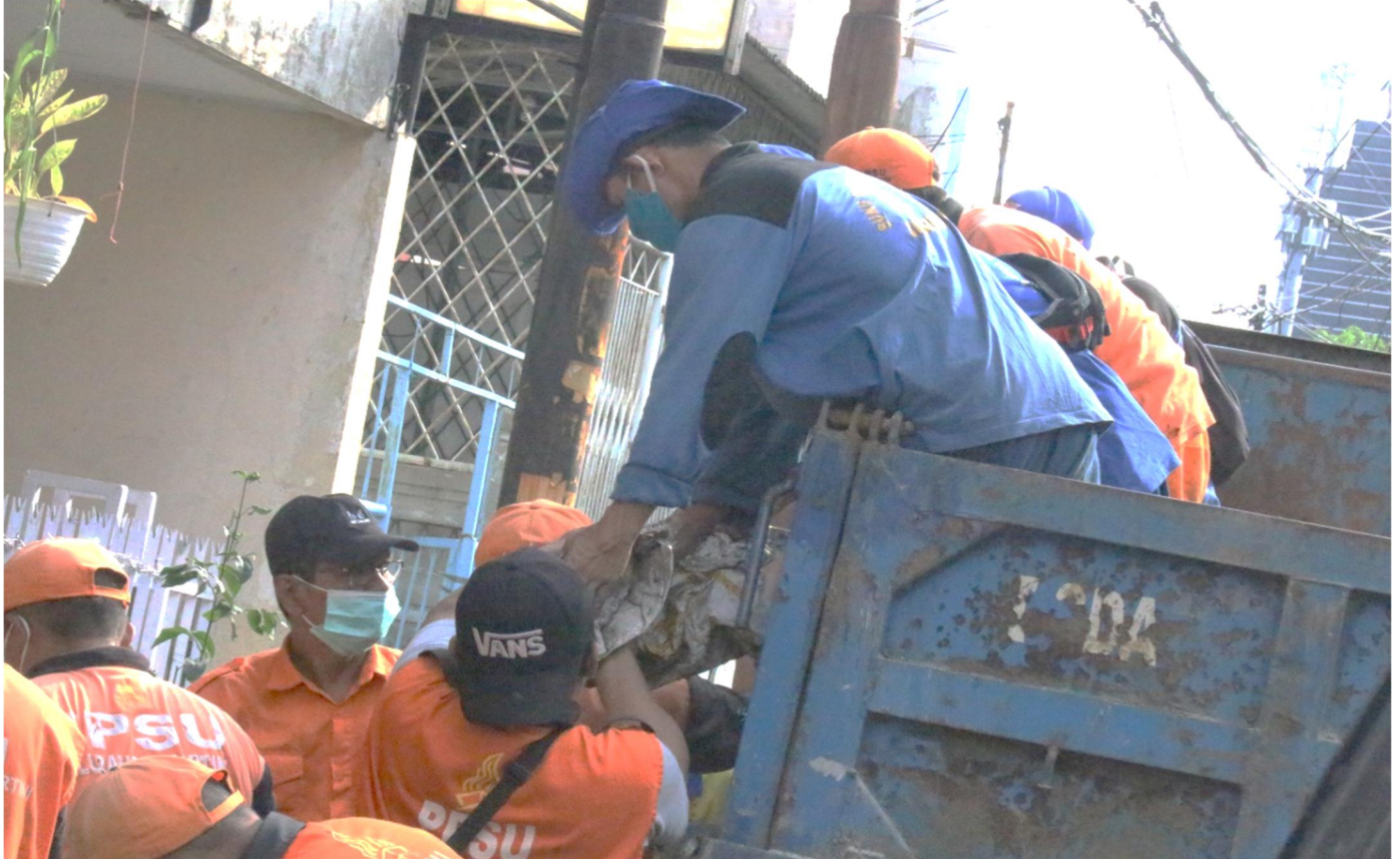
Puluhan petugas melakukan aksi gerebek lumpur di Jalan Kartini III.

Perekonomian & Pemb. 8 Nov, 2021 Reporter: Andreas Pamakayo | Editor: Andreas Pamakayo