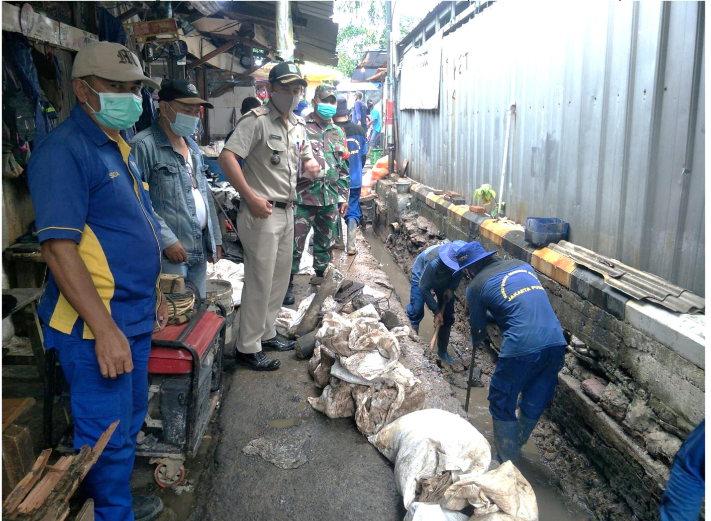
Perbaikan saluran air di Jalan Kalibaru Timur VI GG, RT 14 RW 02.

Perekonomian & Pembangunan 14 September 2021 Reporter: Malik Maulana | Editor: Andreas Pamakayo