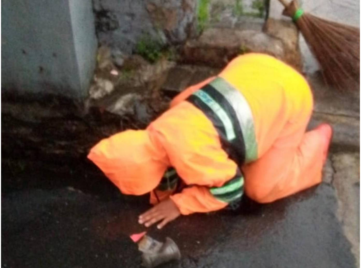
PPSU Kelurahan Cideng membersihkan tali air.

Perekonomian & Pembangunan 14 September 2021 Reporter: H. A. Daelani | Editor: Andreas Pamakayo