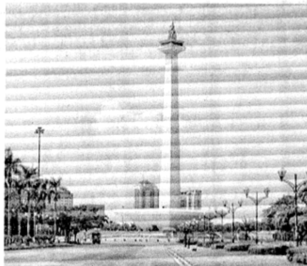
Kawasan wisata Monas