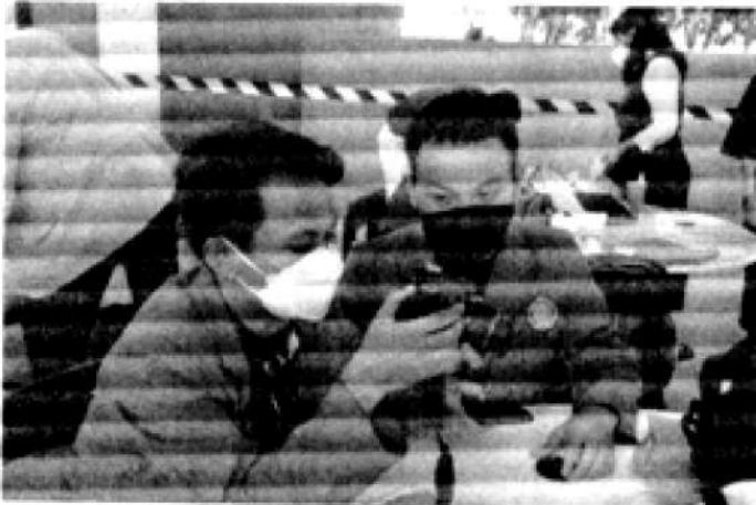
Siswa yang antusias mengikuti workshop Food Photography.

JAKARTA RAYA - Sebanyak 40 siswa dari 20 sekolah yang tergabung dalam Sekolah Kolaborasi Jakarta, sangat antusias mengikuti workshop Kelas Seni Pelajar dalam rangka Bulan Seni Rupa TIM di Ruang Retail Lantai 2 Gedung Panjang Taman Ismail Marzuki, Jakarta Pusat, Kamis (30/6). Ada dua kelas yang diikuti para siswa yaitu Food Photography dan Pembuatan Comic Strip.