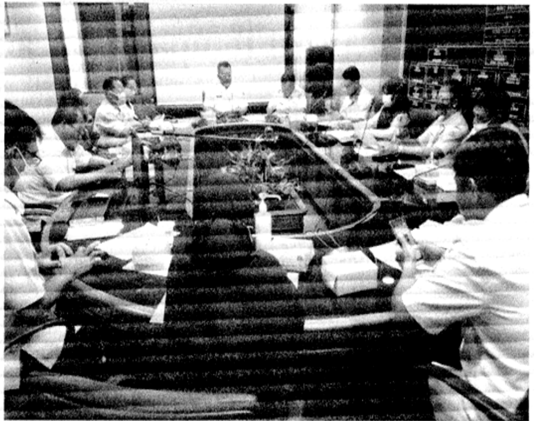
Rapat panitia hewan kurban Pemkot Jakpus