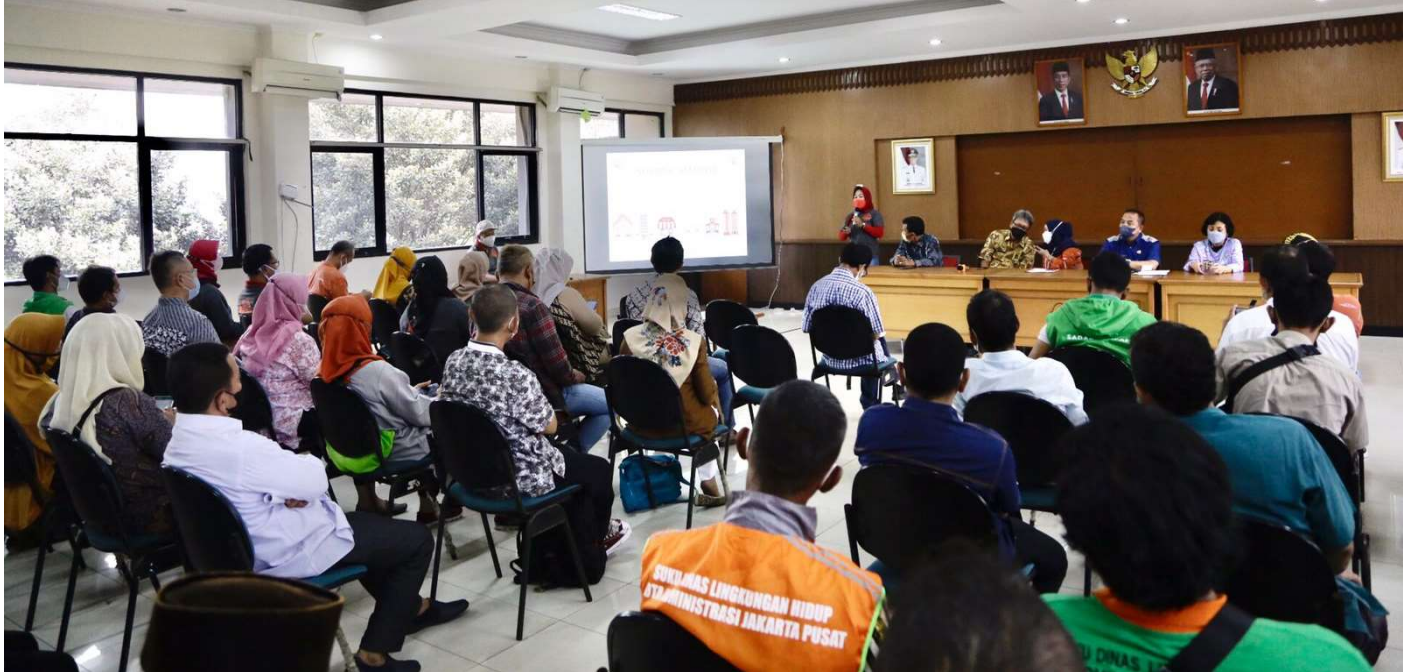
Pembinaan dan evaluasi pengelolaan sampah implementasi Pergub 77, di Aula Kecamatan Tanah Abang.

Perekonomian & Pemb 1 Sep, 2022 Reporter: Maulana | Editor: Andreas Pamakayo