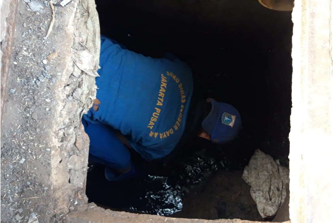
Satpel SDA Kecamatan Tanah Abang menguras saluran air.

Perekonomian & Pemb 1 Sep, 2022 Reporter: Maulana | Editor: Andreas Pamakayo