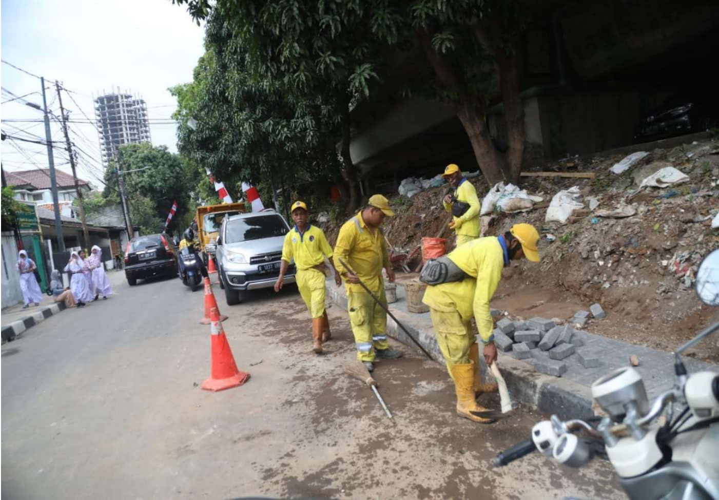
Perapian trotoar di Jalan Anyer, Kelurahan Menteng.

Suku Dinas (Sudin) Bina Marga Kecamatan Menteng merapikan trotoar yang tertimbun puing, di Jalan Anyer, Kelurahan Menteng, Jakarta Pusat.