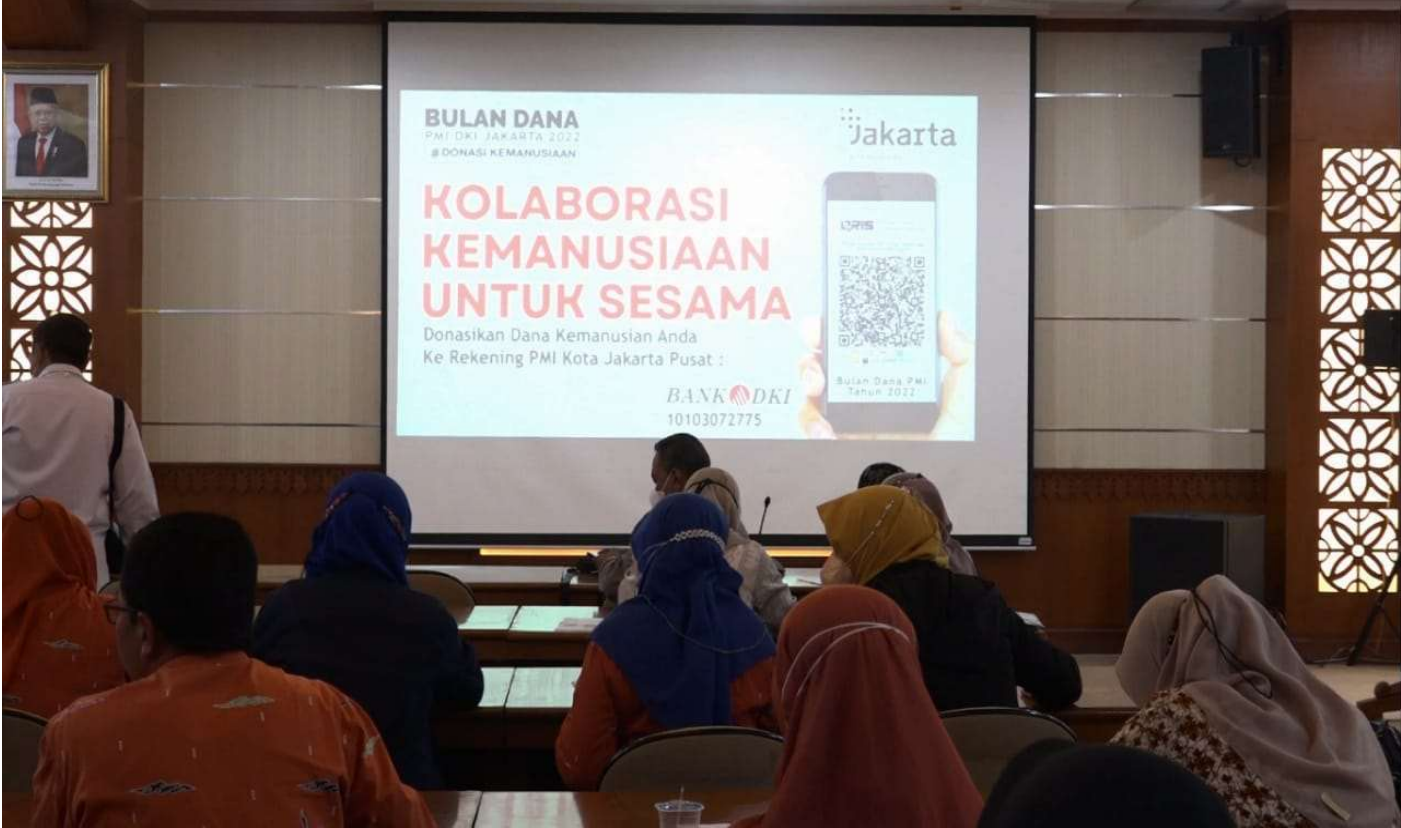
Rapat evaluasi pelaksanaan Bulan Dana PMI Tahun 2022.

Kesra 1 Sep, 2022 Reporter: Nelly Marlianti | Editor: Andreas Pamakayo