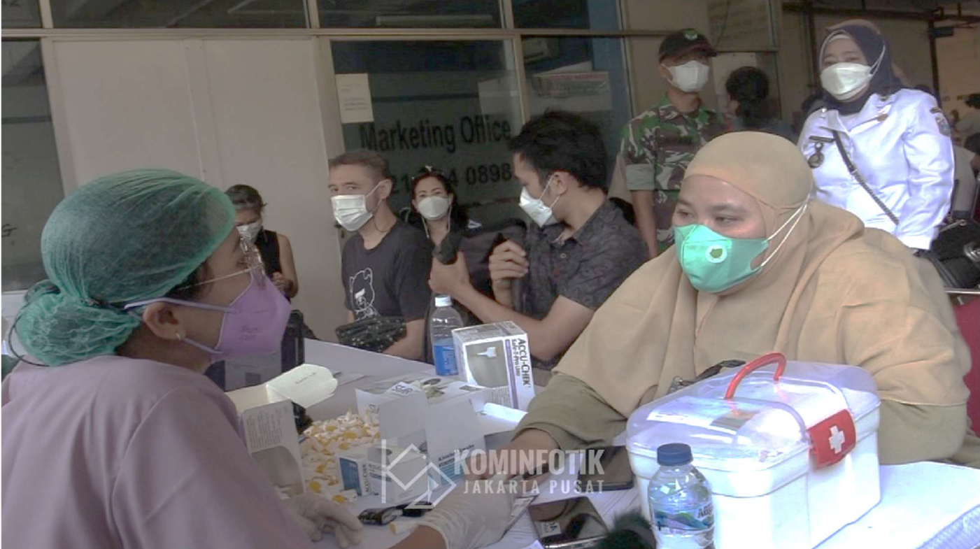
Pelaksanaan vaksinasi dinamis di Apartemen Menteng Square Tower A.

Kesra 2 Mar, 2022 Reporter: Maulana | Editor: Andreas Pamakayo