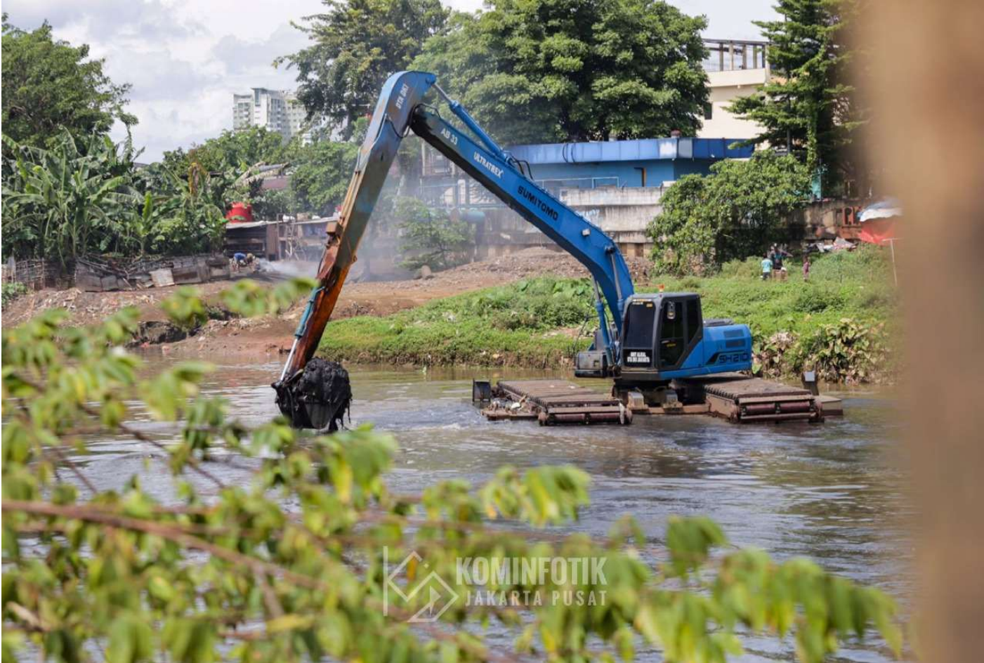
Sudin SDA Kota Administrasi Jakarta Pusat melakukan pengerukan Kali Ciliwung di KBB.

Perekonomian & Pemb 2 Mar, 2022 Reporter: Malik Maulana | Editor: Andreas Pamakayo