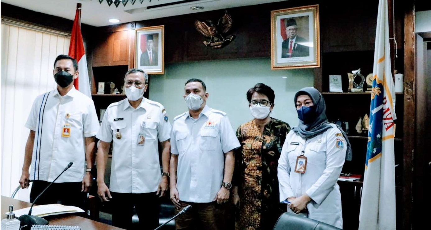
Pemkot Administrasi Jakarta Pusat menggelar pembahasan mengenai tanah di Jalan Ciasem dan Jalan Citanduy.

Pemerintahan 2 Mar, 2022 Reporter: Maulana | Editor: Andreas Pamakayo