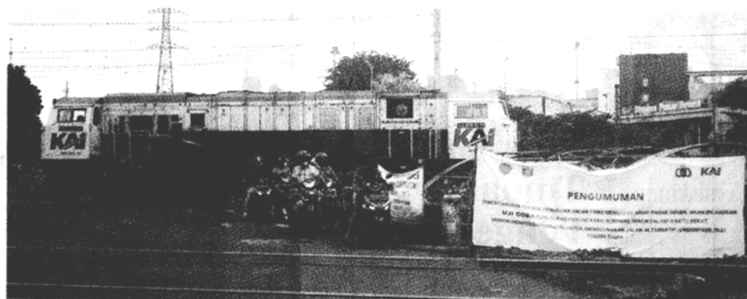
TUTUP AKSES: Sejumlah pengendara roda dua menunggu kereta melintas di Stasiun Senen, Jakarta Pusat, Kamis (3/3). Tampak spanduk berisi penolakan penutupan lintasan. Foto bawah, spanduk-spanduk juga terlihat di sejumlah jalan protokol di sekitar stasiun tersebut.