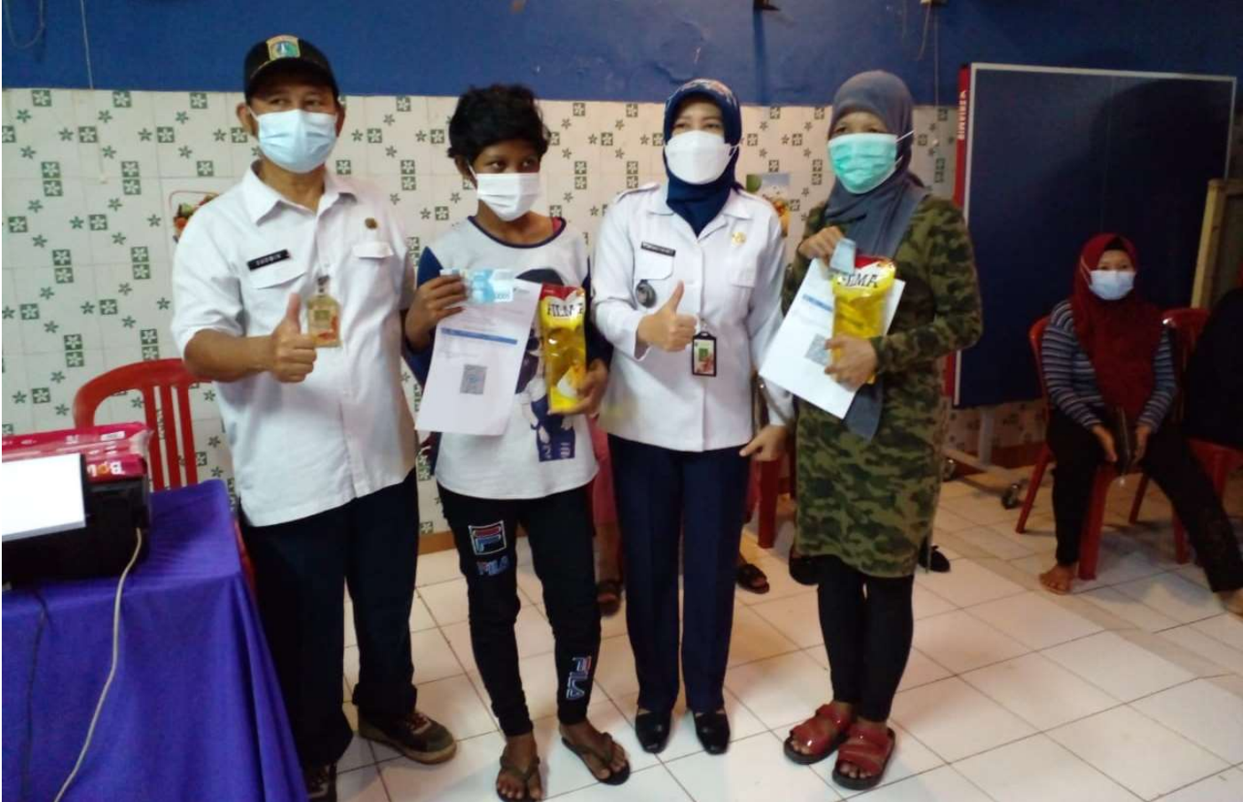
Lurah Kebon Melati memberikan minyak goreng bagi warga yang telah mengikuti vaksinasi Covid-19 dosis pertama.

Kesra 2 Mar, 2022 Reporter: H. A. Daelani | Editor: Andreas Pamakayo