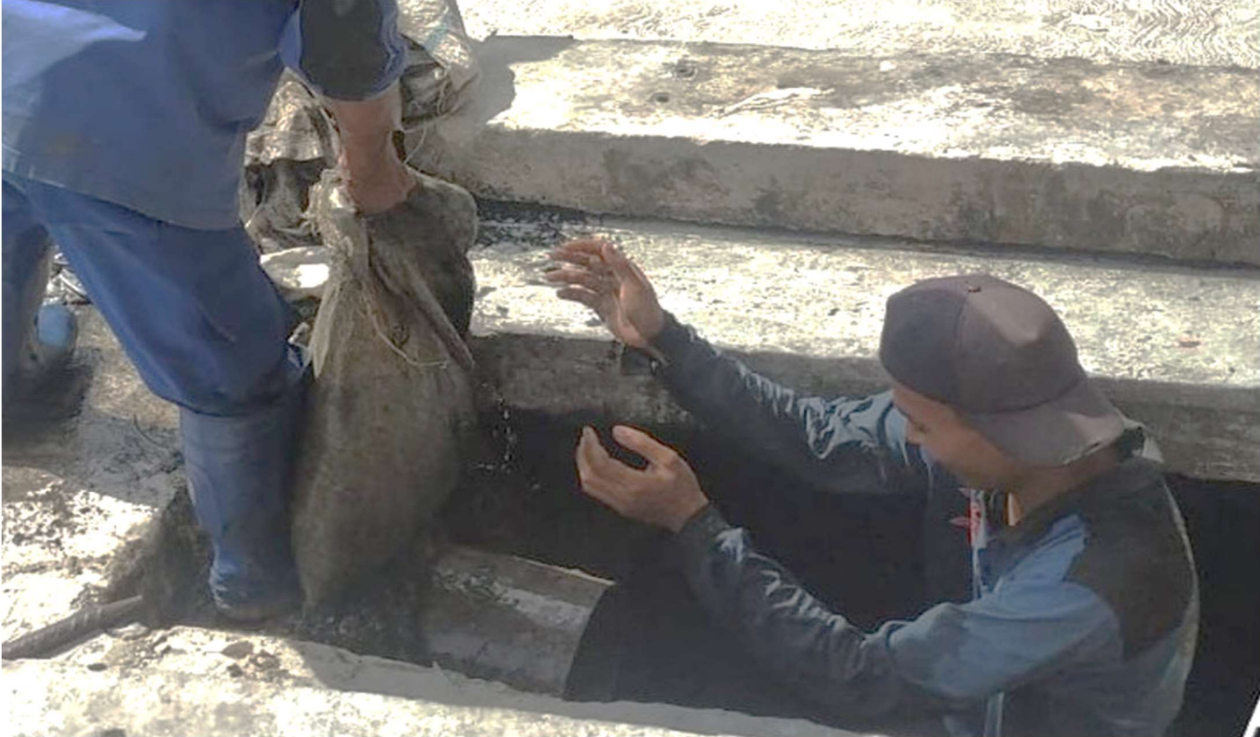
Pengangkatan lumpur dan sampah di saluran PHB.

Perekonomian & Pemb 2 Mar, 2022 Reporter: H. A. Daelani | Editor: Andreas Pamakayo