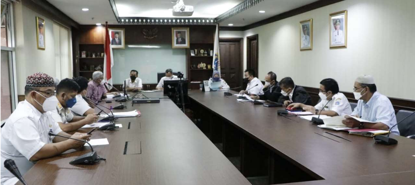
Pemkot Administrasi Jakarta Pusat menggelar pembahasan dengan pihak termohon mengenai lahan tanah di Jalan Ciasem dan Jalan Citanduy.

Pemerintahan 2 Mar, 2022 Reporter: Maulana | Editor: Andreas Pamakayo