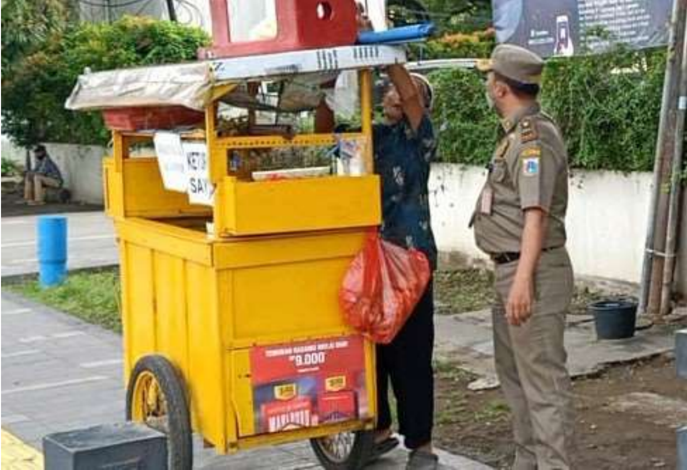
Satpol PP Kelurahan Kramat menghalau pedagang kaki lima yang berjualan di trotoar.