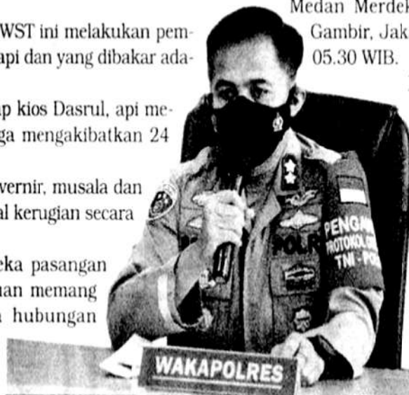
Dok Polres Jakarta Selatan

Sekira 20 menit kemudian, api berhasil dipadamkan oleh Sudin Penanggulangan Kenakaran dan Penyelamatan Jakarta Pusat.(m26)