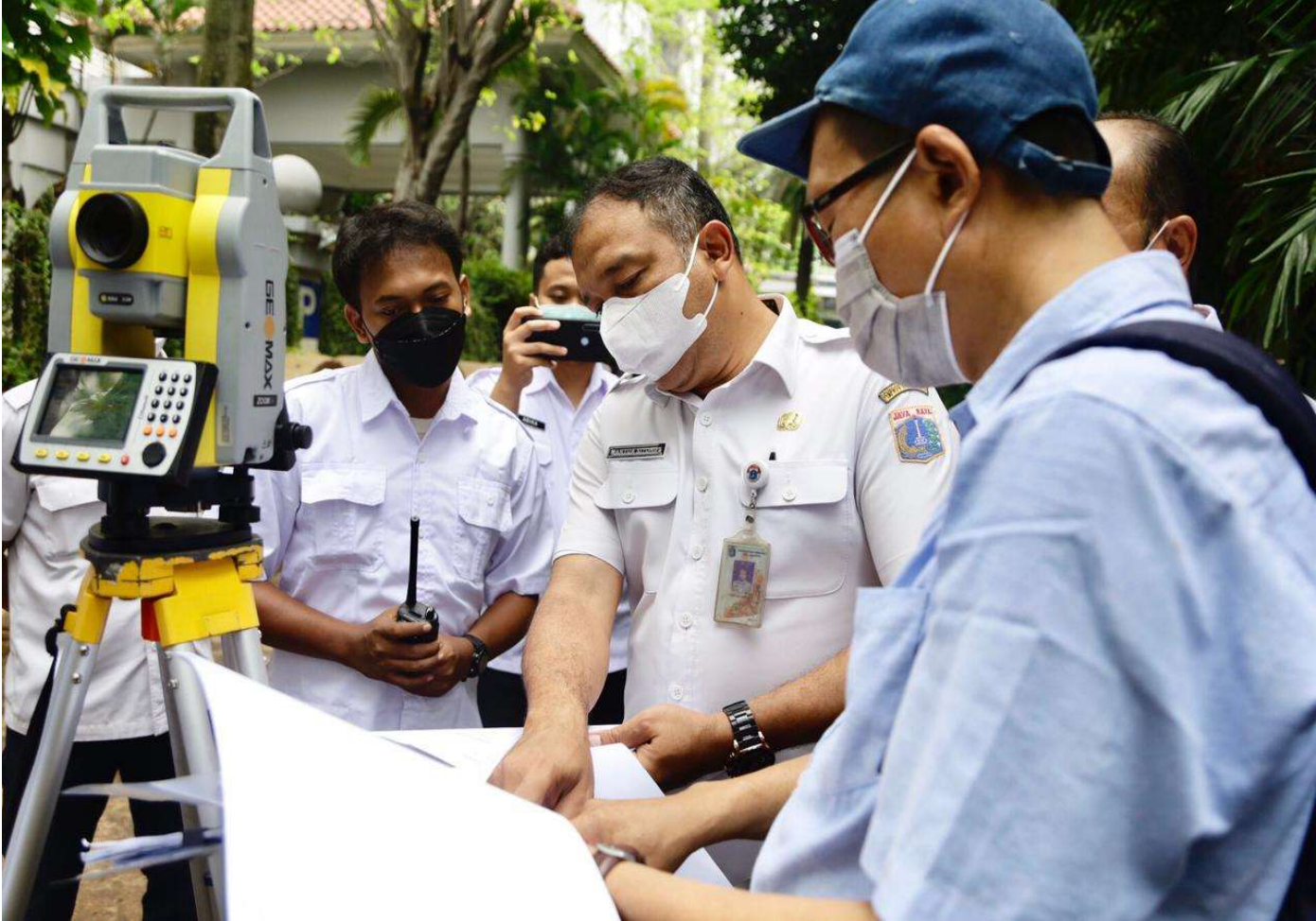
Pengukuran ulang Fasos-Fasum.

Pemerintah Kota (Pemkot) Administrasi Jakarta Pusat (Jakpus) melakukan peninjauan ulang pengukuran Fasilitas Sosial-Fasilitas Umum (Fasos-Fasum) di Apartemen Menteng Excecutive, Kecamatan Menteng, Rabu (6/7).