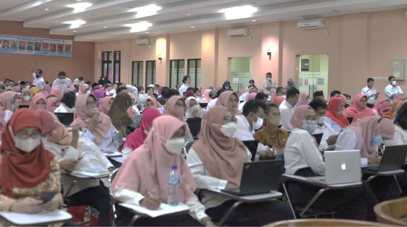
Sosialisasi input sistem E-TPP di Aula Gedung P2KPTK2.

Pemerintahan 6 Jul, 2022 Reporter: Maulana | Editor: Andreas Pamakayo