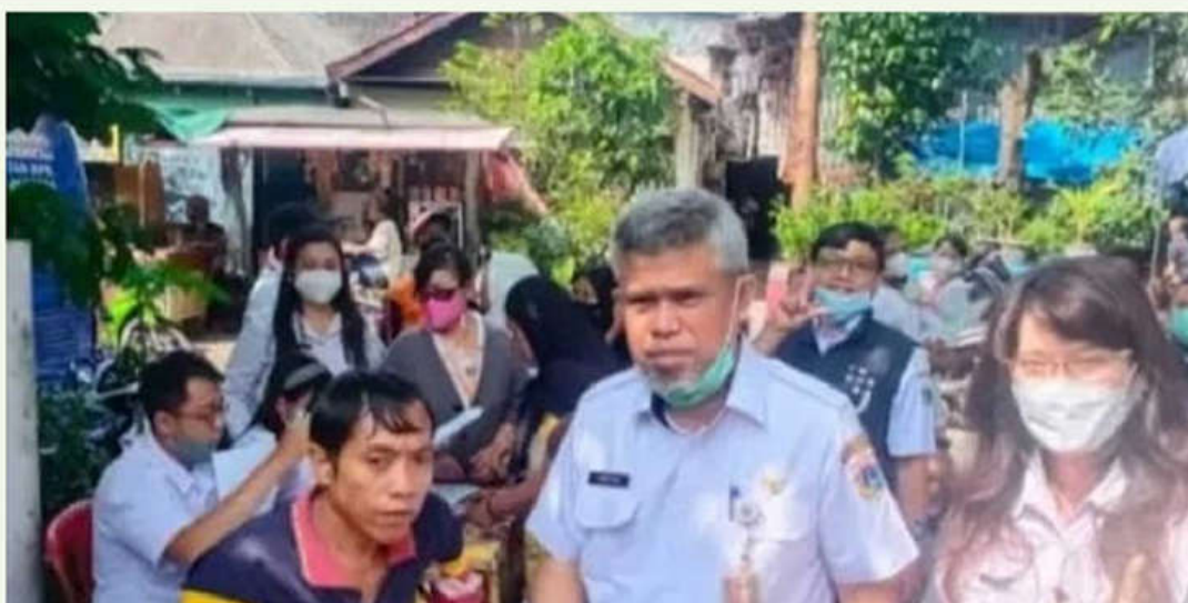
Kegiatan proses pelayanan adminduk di Jakpus