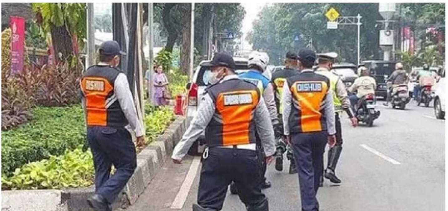
Kegiatan razia parkir liar di Jakpus

Selain dua sepeda motor yang diangkut, petugas juga memberikan teguran terhadap pemilik empat mobil diberi peringatangata Sementara dua kendaraan yang diangkut dibawa ke Sudinhub Jakpus dan akan dikenakan sanksi tilang. "Dibawa ke Sudin Perhubungan, ditilang disana, atau disosialisasi ulang agar tidak lakukan parkir sembarangan lagi," pungkasnya. (did)