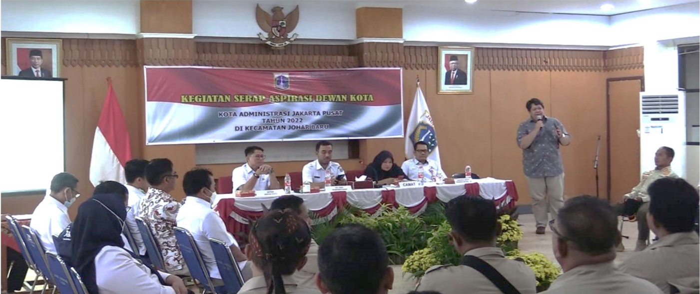
Serap aspirasi warga, di Ruang Pola, Kantor Kecamatan Johar Baru, Rabu (6/7).