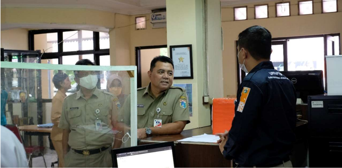
Aspem meninjau pelayanan di PTSP Keluaran Menteng.

Pemerintahan 6 Dec, 2022 Reporter: Nelly Marlianti | Editor: Andreas Pamakayo