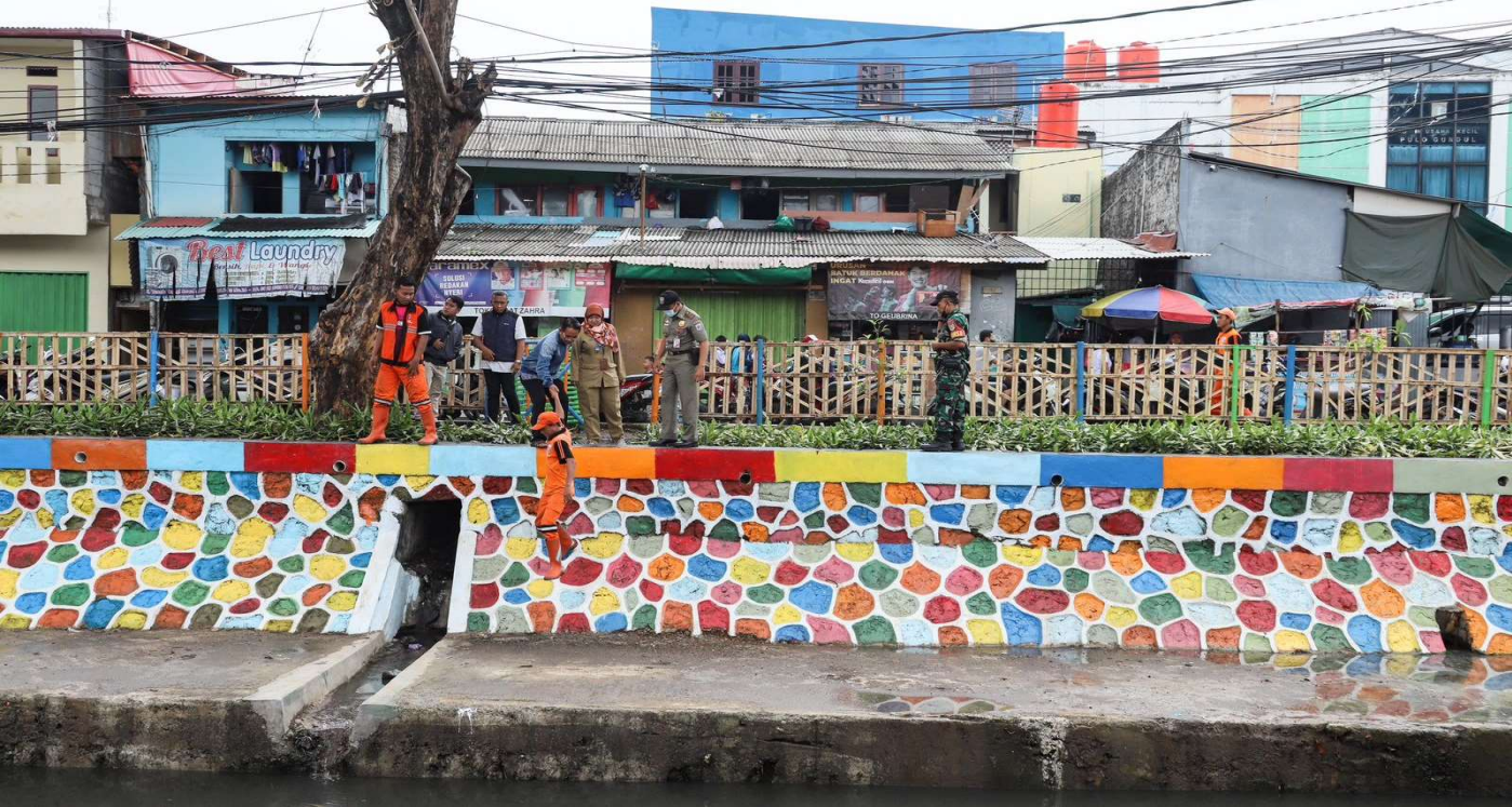
Penataan di bantaran Kali Sentiong.

Perekonomian & Pemb 6 Dec, 2022 Reporter: Maulana | Editor: Andreas Pamakayo