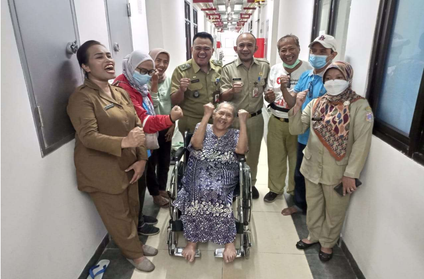
Pendistribusian kursi roda bagi warga Karang Anyar.

Kesra 6 Dec, 2022 Reporter: Andreas Pamakayo | Editor: Andreas Pamakayo