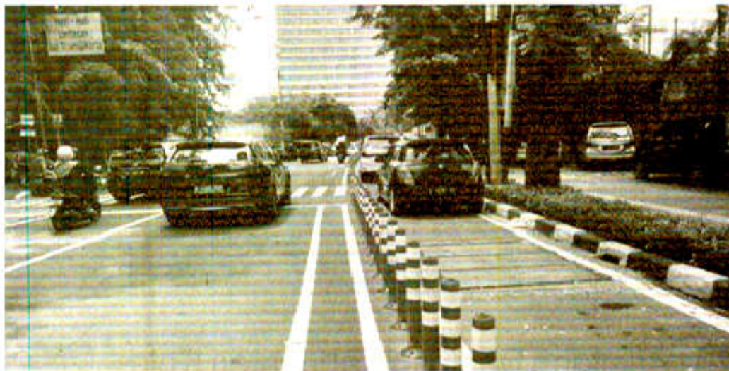
Terpantau jalur sepeda dipakai parkir liar oleh kendaraan roda empat di wilayah billangan Jakarta Pusat.

"Itu jika diambil hitungan dari 16.000 SRP (Satuan Ruas Parkir) awal di Jakarta. Jumlah SRP parkir liar di Jakarta tentu jumlahnya bisa lebih banyak maka pendapatannya bisa bertambah lagi," jelasnya. (Aldi/Ifn)