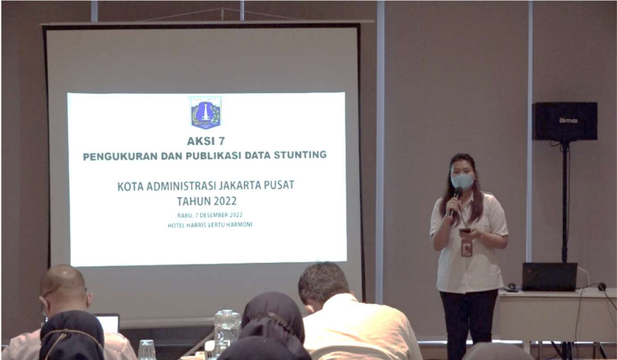
Aksi Konvergensi dan Intervensi Stunting.

Kesra 7 Dec, 2022 Reporter: Iman | Editor: Andreas Pamakayo