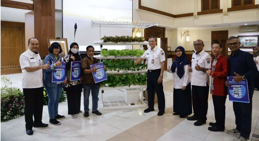
Penyerahan rak hidroponik kepada kelompok masyarakat di Ruang Serbaguna Utama, Kantor Wali Kota Jakarta Pusat.

Perekonomian & Pemb 7 Dec, 2022 Reporter: Maulana | Editor: Andreas Pamakayo