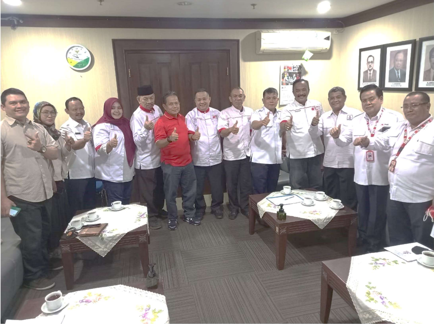
Asminkesra menerima audiensi dengan Ikatan Donor Darah Sukarela (IDDS).

Kesra 7 Dec, 2022 Reporter: Daffa Magang | Editor: Andreas Pamakayo