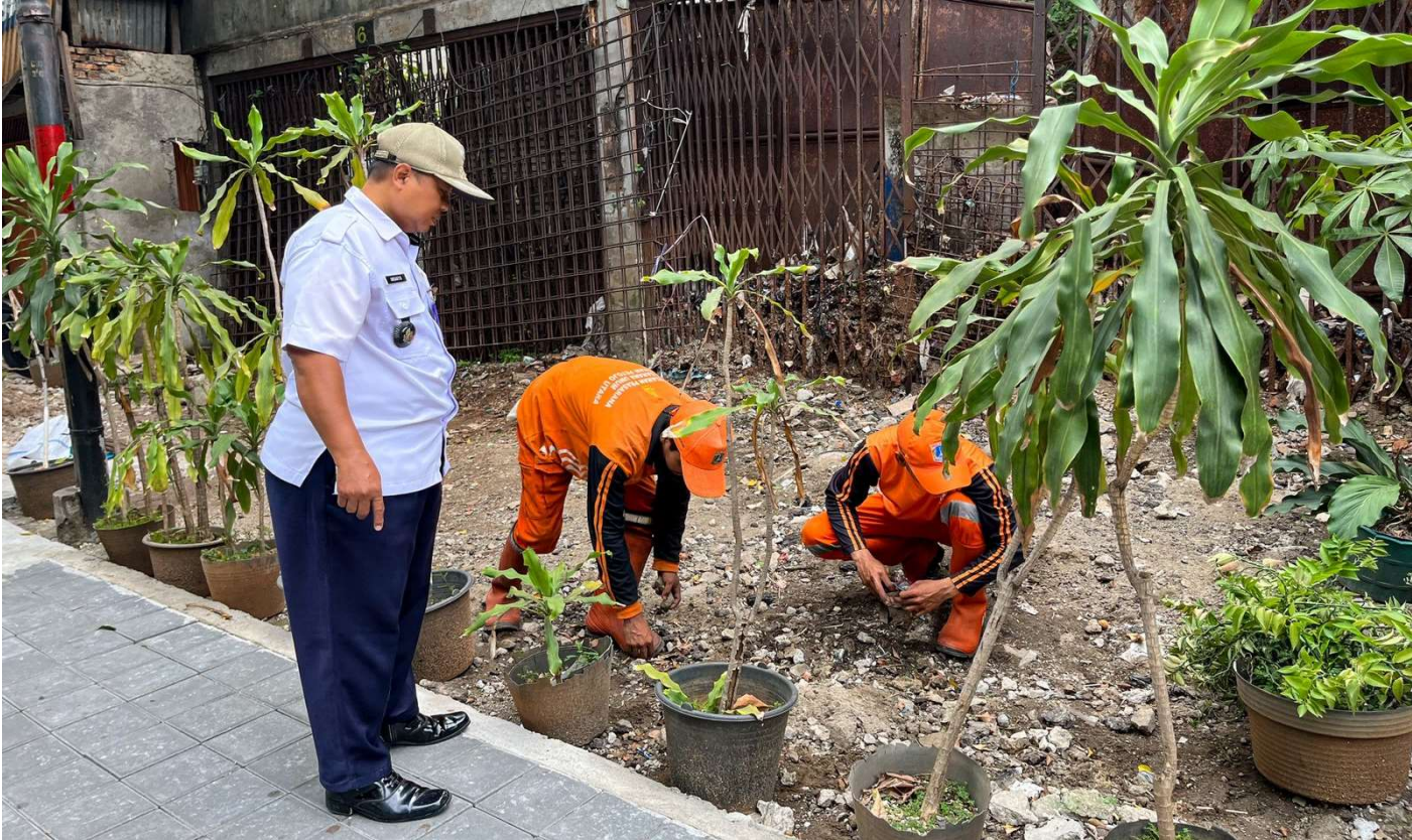
Lurah Petojo Utara meninjau penataan kawasan di Jalan Cideng Timur.