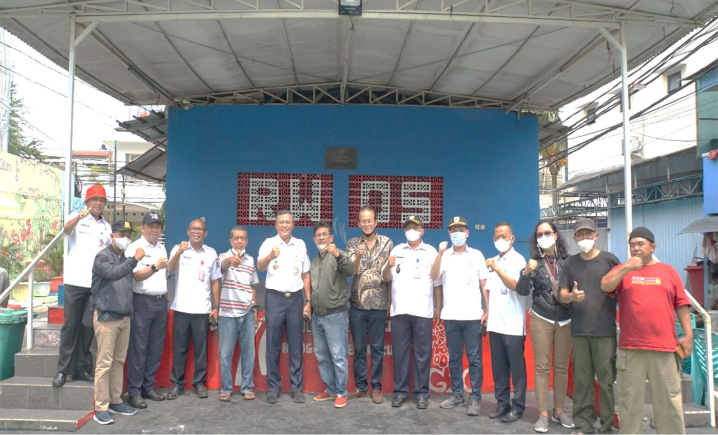
Peninjauan penataan kawasan di RW 05.

Perekonomian & Pemb 7 Dec, 2022 Reporter: Dinar Pusung | Editor: Andreas Pamakayo