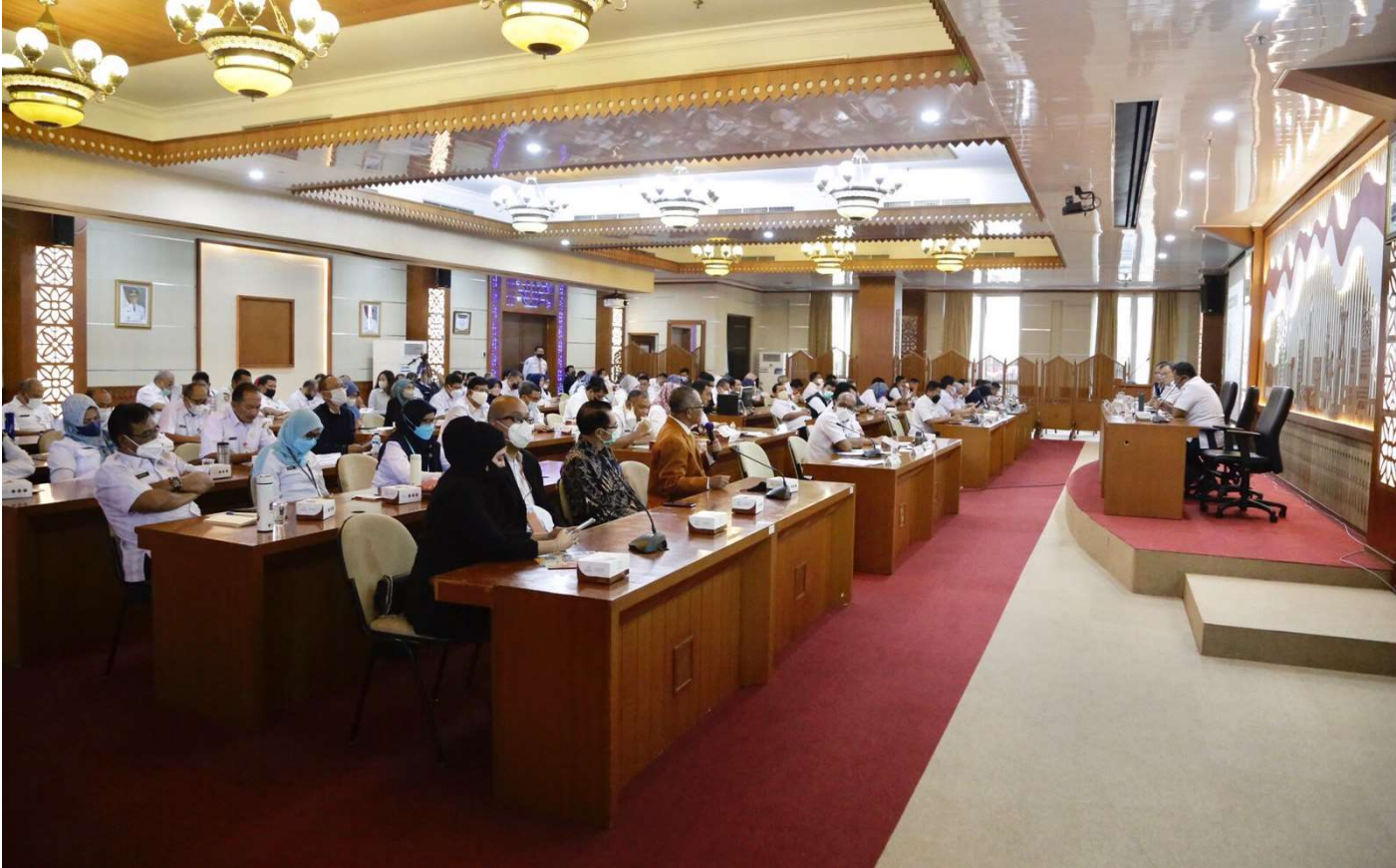
Rapat Kordinasi Wilayah (Rakorwil) Pemkot Jakpus di Ruang Pola, Kantor Wali Kota Jakarta Pusat, Jalan Tanah Abang I, Gambir, Rabu (10/8).

Kesra 10 Aug, 2022 Reporter: Nday | Editor: Iman