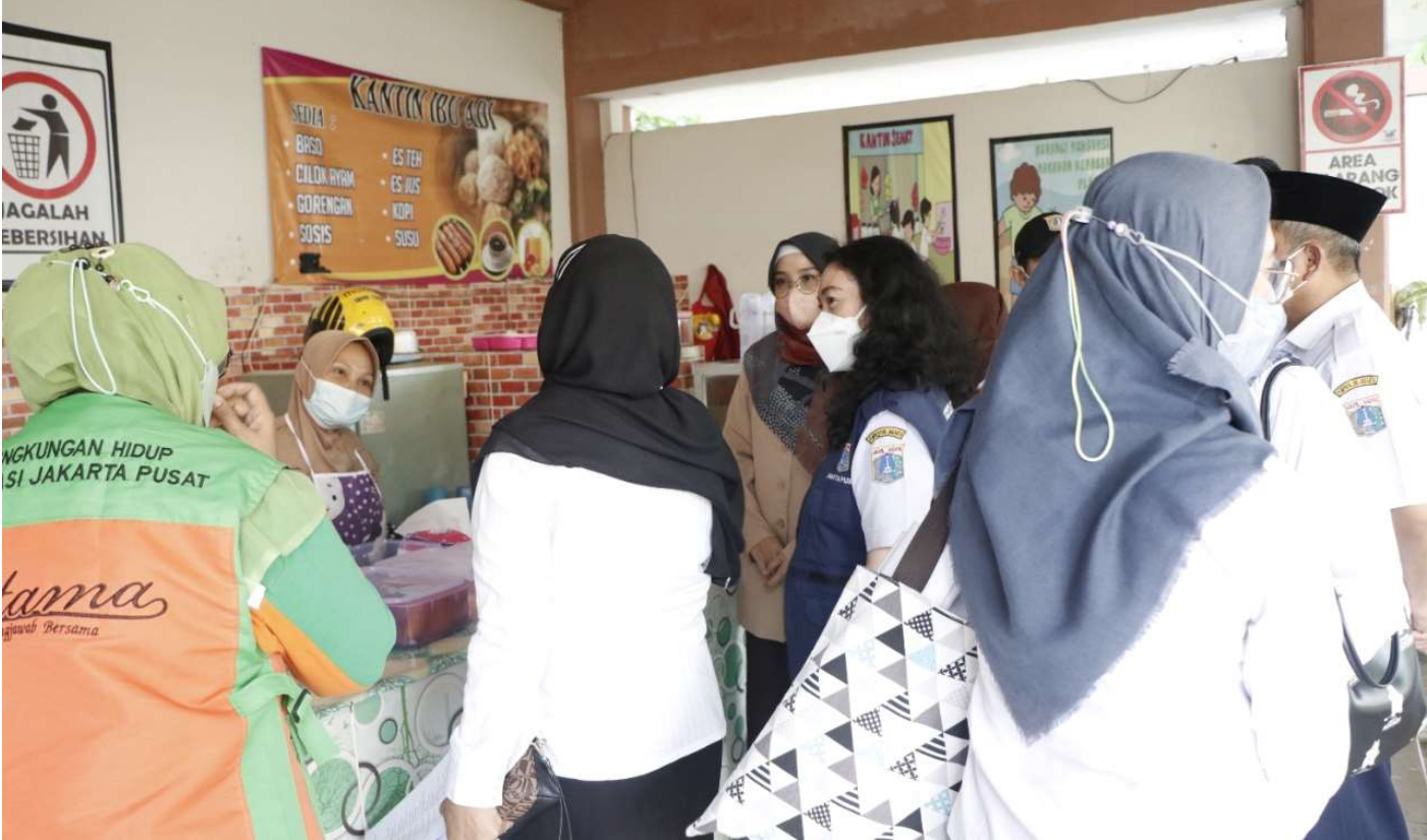
Pemkot Jakpus Lakukan Pembinaan Tiga SD Calon Adiwiyata di Johar Baru

Perekonomian & Pemb 10 Aug, 2022 Reporter: Maulana | Editor: Iman