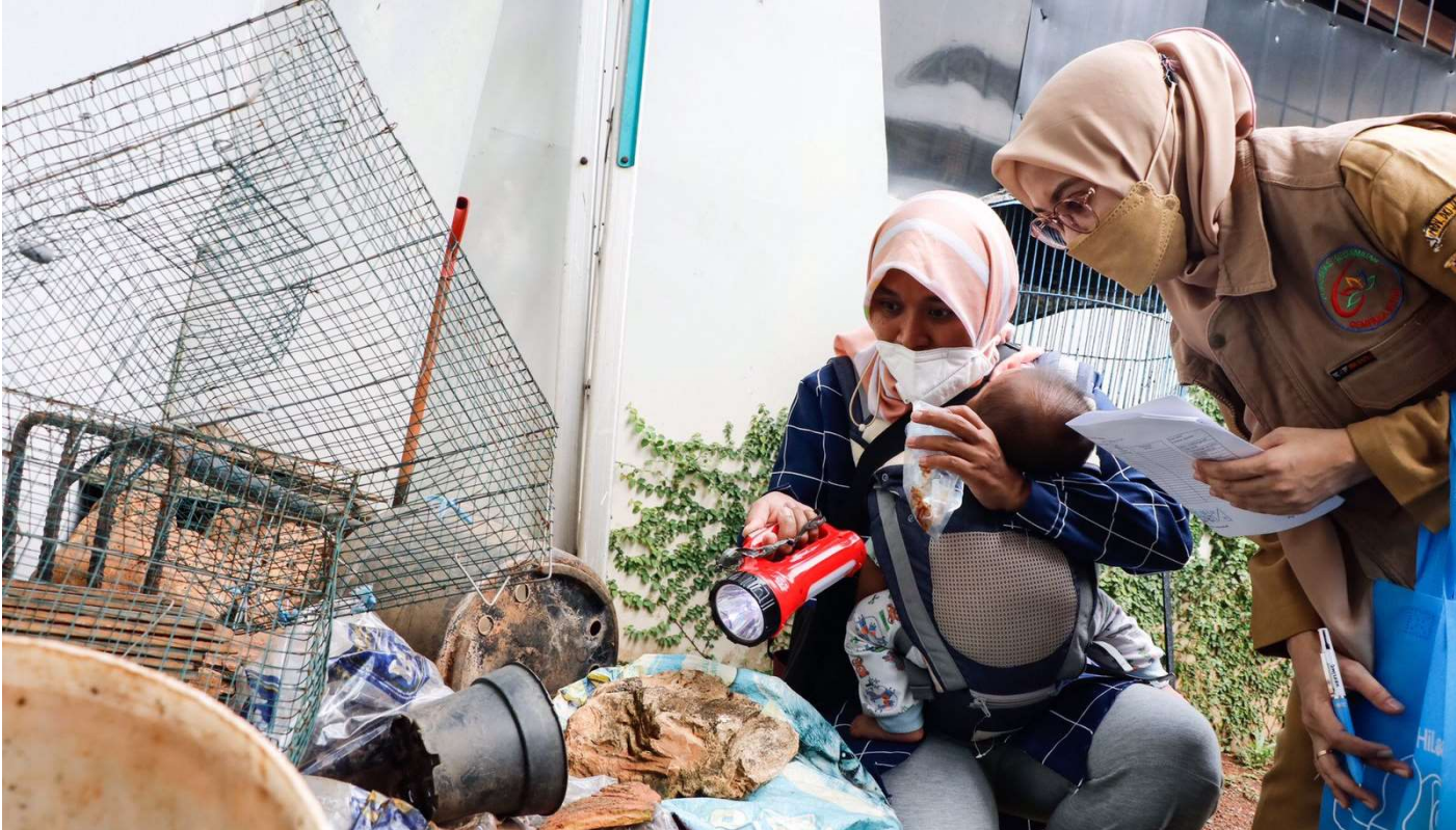
PSN di RT 07 RW 06 Kelurahan Cempaka Putih, Kecamatan Cempaka Putih, Jakarta Pusat, Selasa (12/4).

Kesra 12 Apr, 2022 Reporter: Maulana | Editor: Andreas Pamakayo