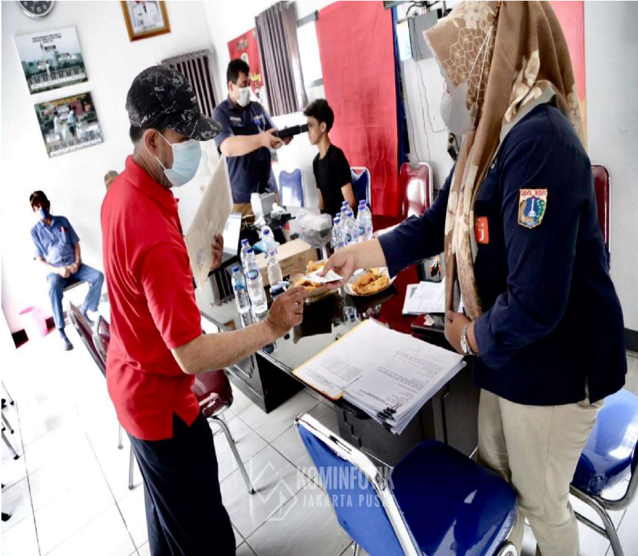
Sudin Dukcapil Kota Administrasi Jakarta Pusat menggelar layanan jemput bola di Balai Warga RW 01, Gambir.