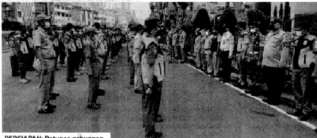
PERSIAPAN: Petugas gabungan diapelkan di sekitar Pasar Tanah Abang. Mereka akan menjaga 16 titik rawan menjelang Ramadan.

"Lokasi yang kami jaga seperti Pasar Tanah Abang agar tertib dari PKL dan kawasan Bongkaran agar tercipta keamanan serta peningkatan titik-titik yang rawan terjadi kerumunan," ucapnya. Prinsipnya, suasana Ramadan harus dijaga agar tidak sampai terjadi gangguan keamanan. (dom/co1/byu)