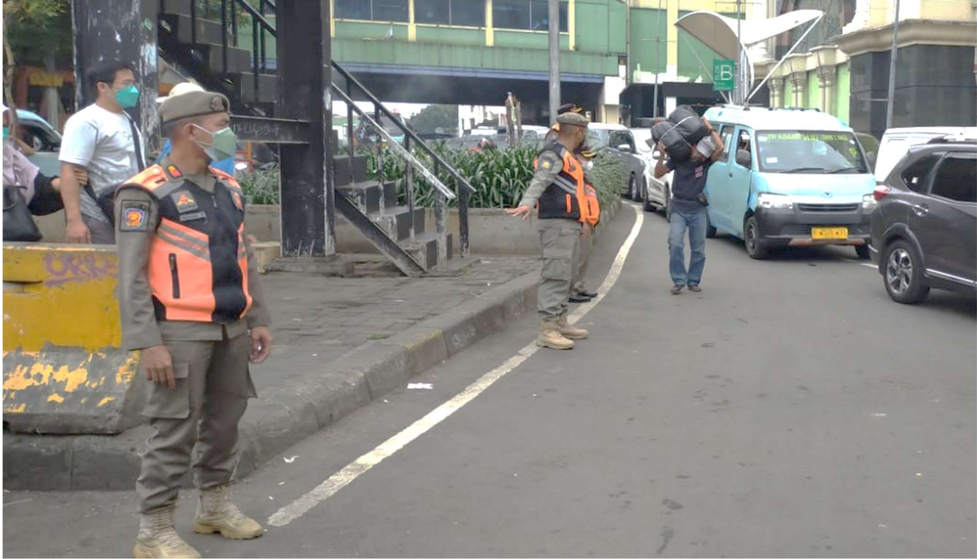
Satpol PP melakukan pengawasan prokes di Pasar Tanah Abang.

Pemerintahan 15 Mar, 2022 Reporter: Maulana | Editor: Andreas Pamakayo