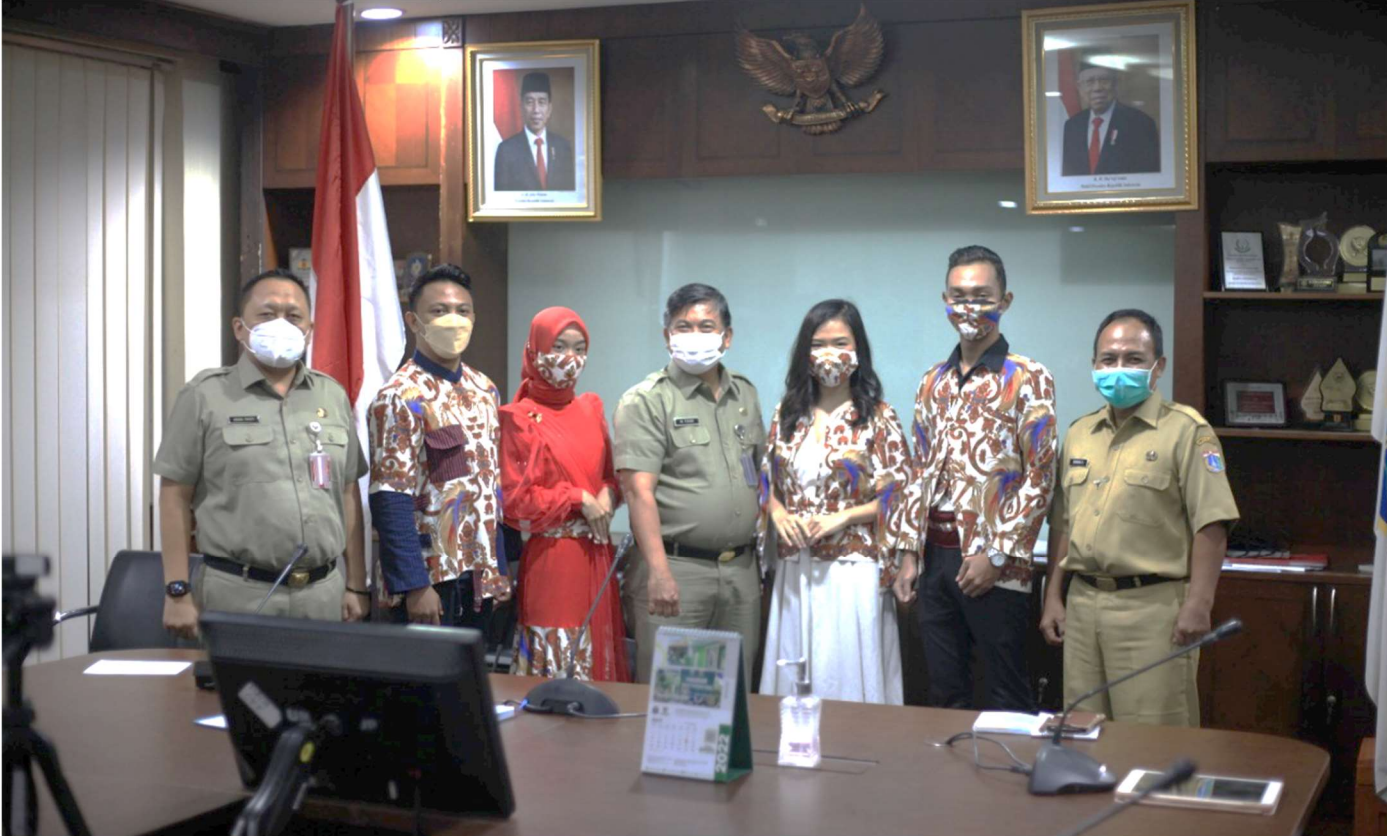
Asminkesra menerima audiensi dengan empat orang perwakilan Generasi Berencana (GenRe) Jakarta Pusat.

Kesra 15 Mar, 2022 Reporter: Iman | Editor: Andreas Pamakayo