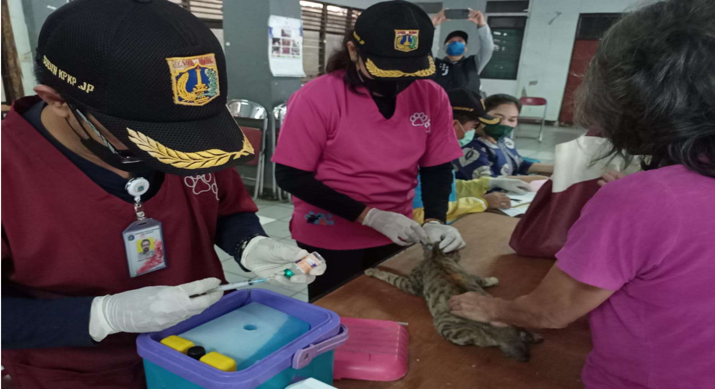
Sudin KPKP lakukan vaksinasi rabies.