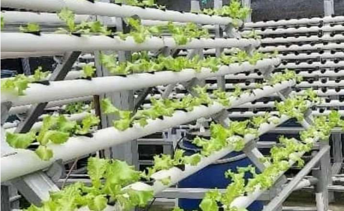
Ilustrasi.