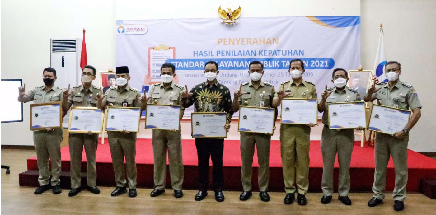
Pemberian penghargaan kepatuhan tinggi standar pelayanan publik tahun 2021 dari Ombudsman RI.