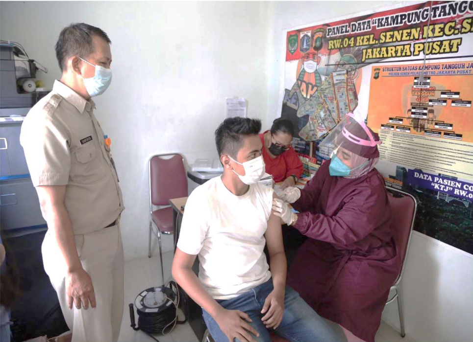
Vaksinasi di RPTRA Planet Senen.

Kesra 19 Apr, 2022 Reporter: Maulana | Editor: Andreas Pamakayo