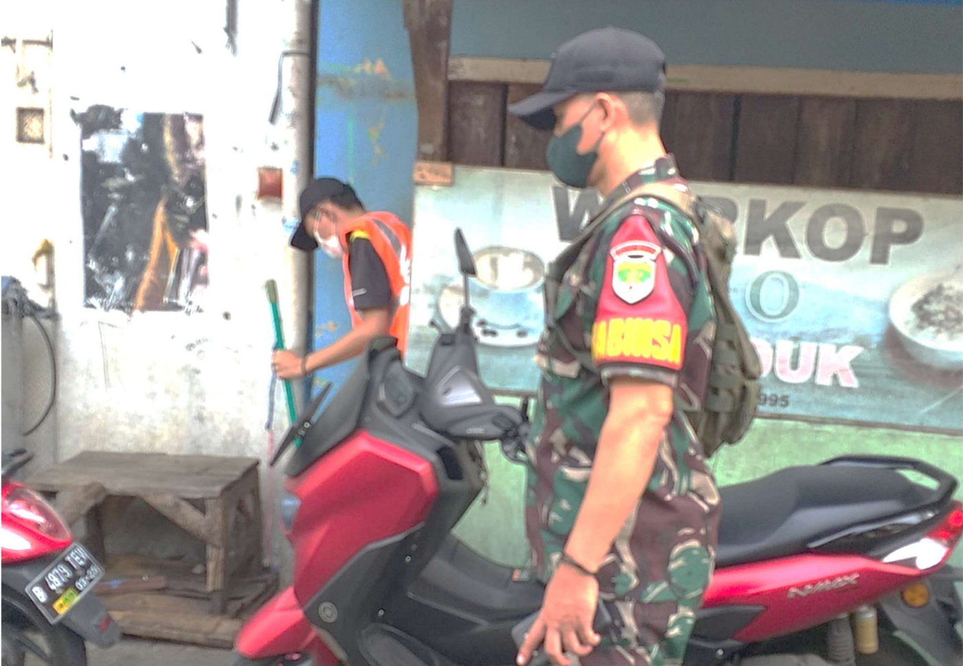
Babinsa mengawasi pelanggar tertib masker saat menjalani sanksi sosial.

Pemerintahan 19 Apr, 2022 Reporter: H. A. Daelani | Editor: Andreas Pamakayo