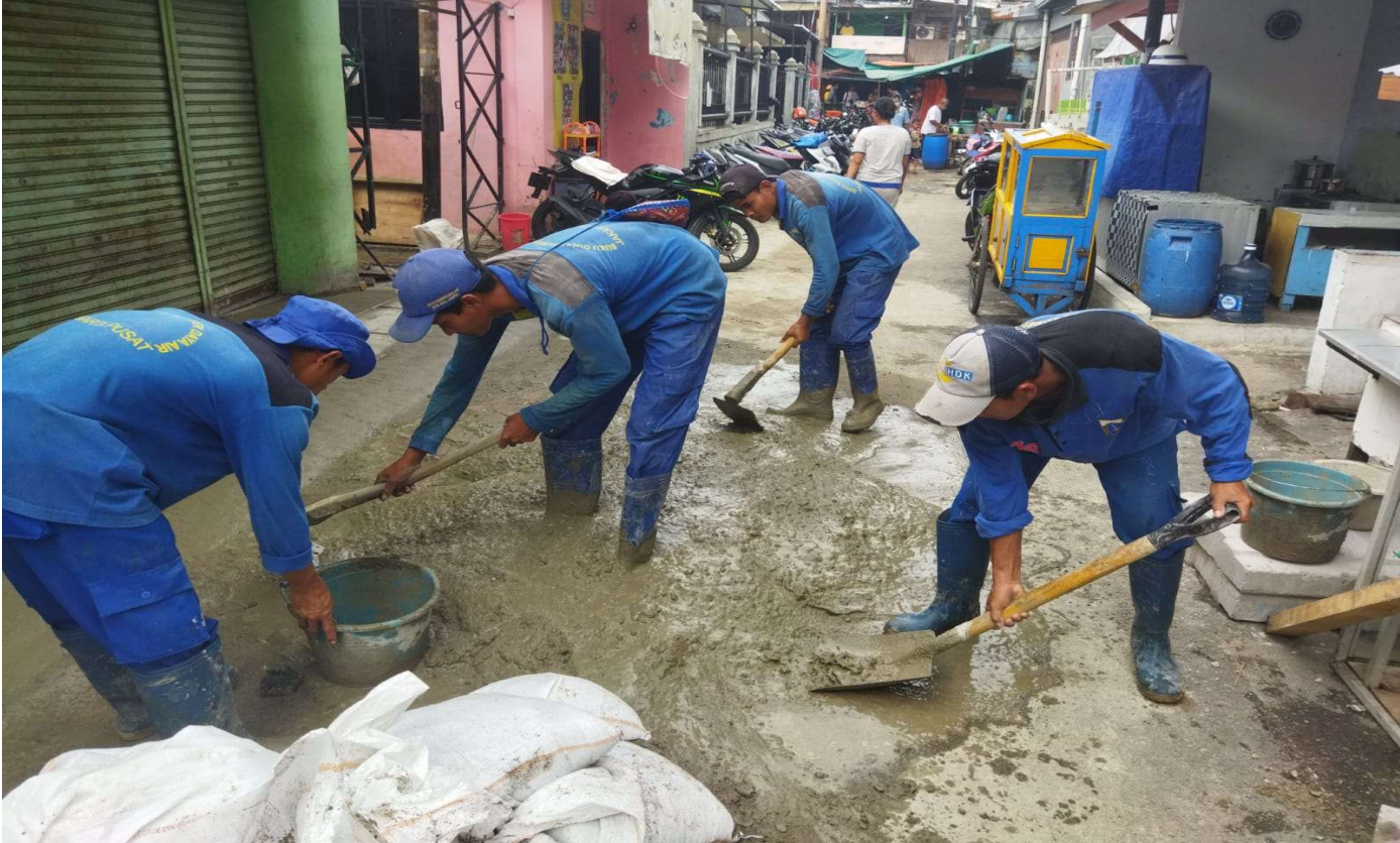
Suku Dinas Sumber Daya Air (Sudin SDA) Kecamatan Sawah Besar, melakukan kegiatan normalisasi saluran mikro.

Perekonomian & Pemb 19 Apr, 2022 Reporter: H. A. Daelani | Editor: Andreas Pamakayo