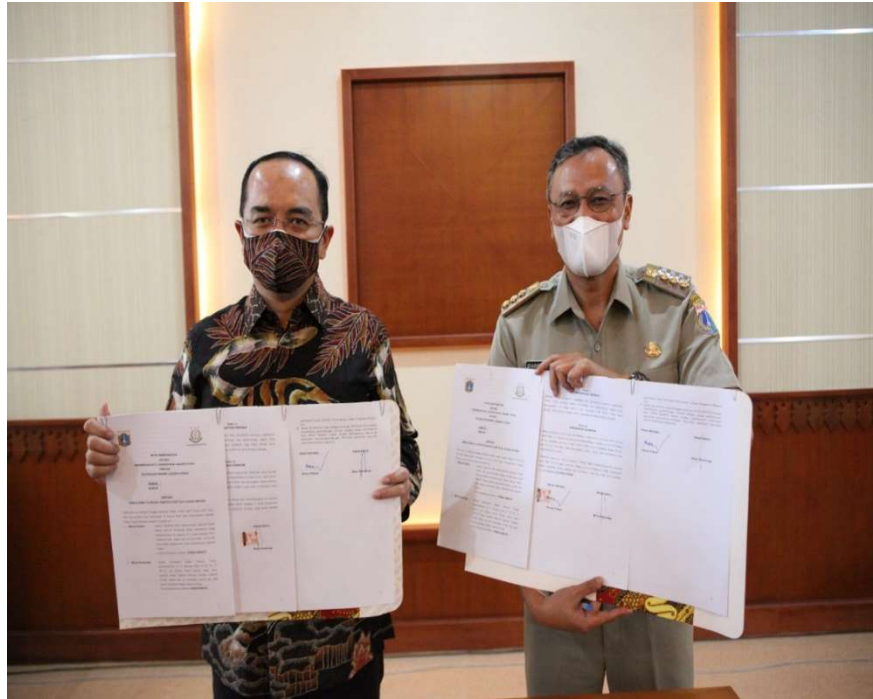
Wali Kota Administrasi Jakarta Pusat dan Kepala Kejaksaan Negeri melakukan penandatanganan nota kesepahaman.

Pemerintahan 19 Apr, 2022 Reporter: Andreas Pamakayo | Editor: Andreas Pamakayo