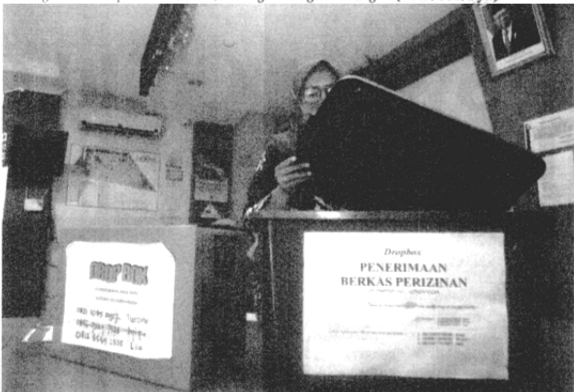
HANUNG HAMBURA/JAWA POS

Gubernur DKI Anies Baswedan mengapresiasi seluruh jajaran Pemprov DKI Jakarta yang telah bekerja sama dan berupaya maksimal dalam memberikan pelayanan terbaik kepada masyarakat. "Penghargaan ini kami persembahkan untuk masyarakat yang senantiasa memberikan masukan dan mendukung Pemprov DKI Jakarta dalam memberikan pelayanan publik yang prima," katanya. (dom/col/byu)