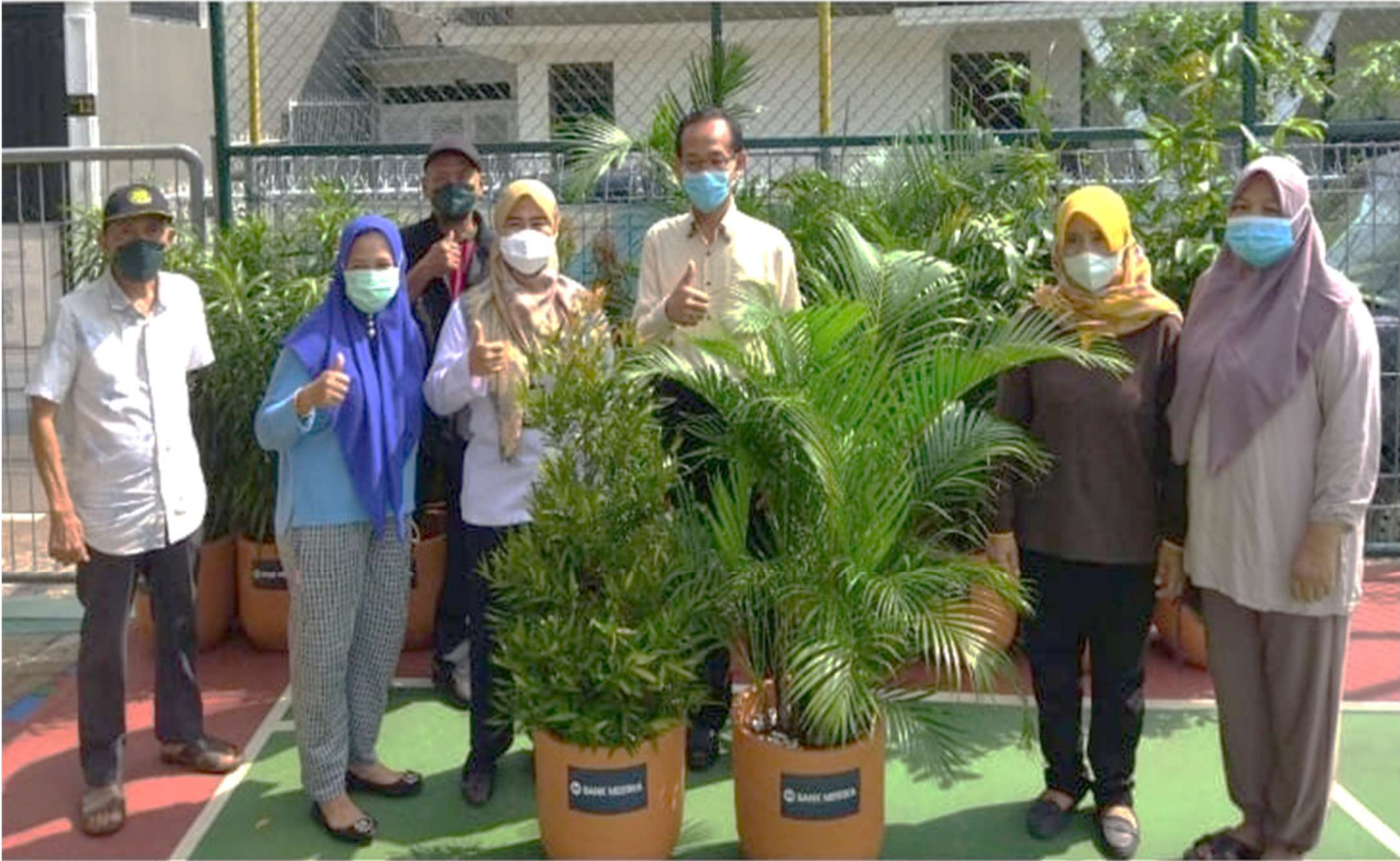
Penyerahan bantuan 20 pot pohon tanaman hias dari CSR Bank Mestika, Rabu (20/4).

Perekonomian & Pemb 20 Apr, 2022 Reporter: H. A. Daelani | Editor: Andreas Pamakayo