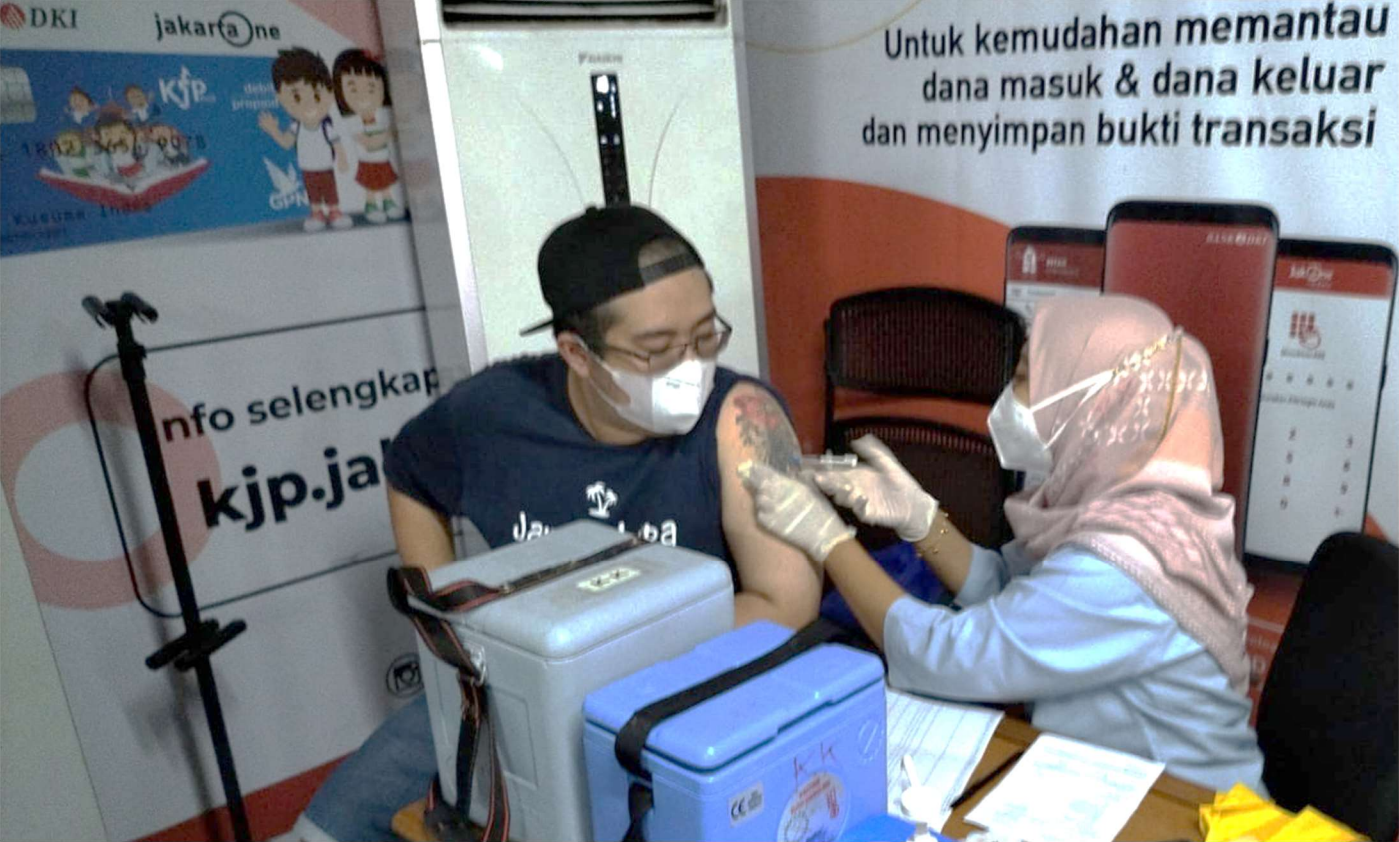
Kelurahan Kebon Kelapa menggelar vaksinasi Covid-19 di Ramadan Market.

Kesra 20 Apr, 2022 Reporter: Nelly Marlianti | Editor: Andreas Pamakayo