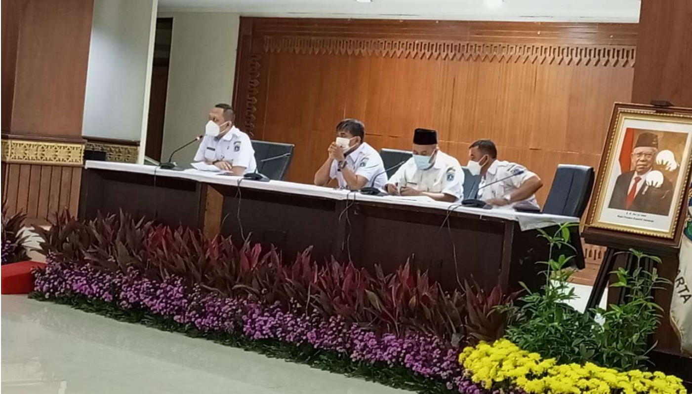
Rapat persiapan pelaksanaan Festival Olahraga Rakyat di Tingkat Kelurahan.

Kesra 20 Apr, 2022 Reporter: Andreas Pamakayo | Editor: Andreas Pamakayo