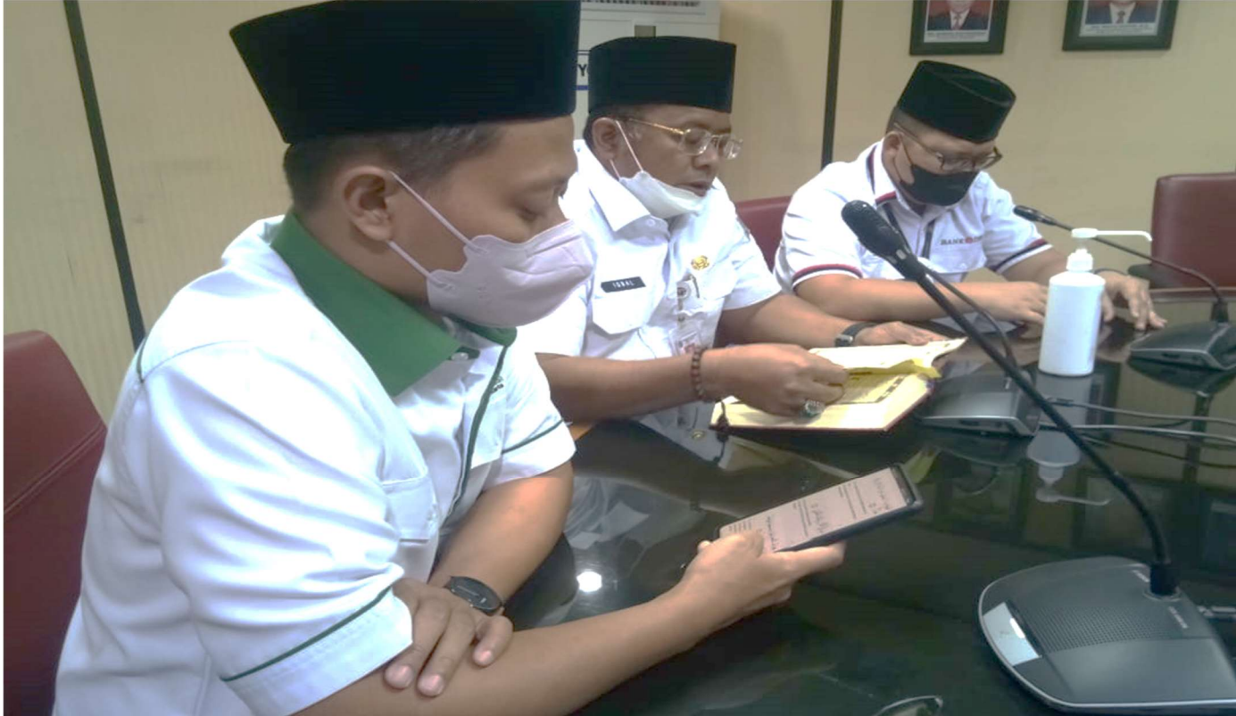
Jakarta Cinta Qur'an di Kantor Wali Kota Jakarta Pusat, Jalan Tanah Abang I, Gambir, Rabu (20/4).