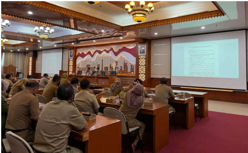
Persiapan koordinasi pemilihan pendamping Rembuk RW, di Ruang Pola.