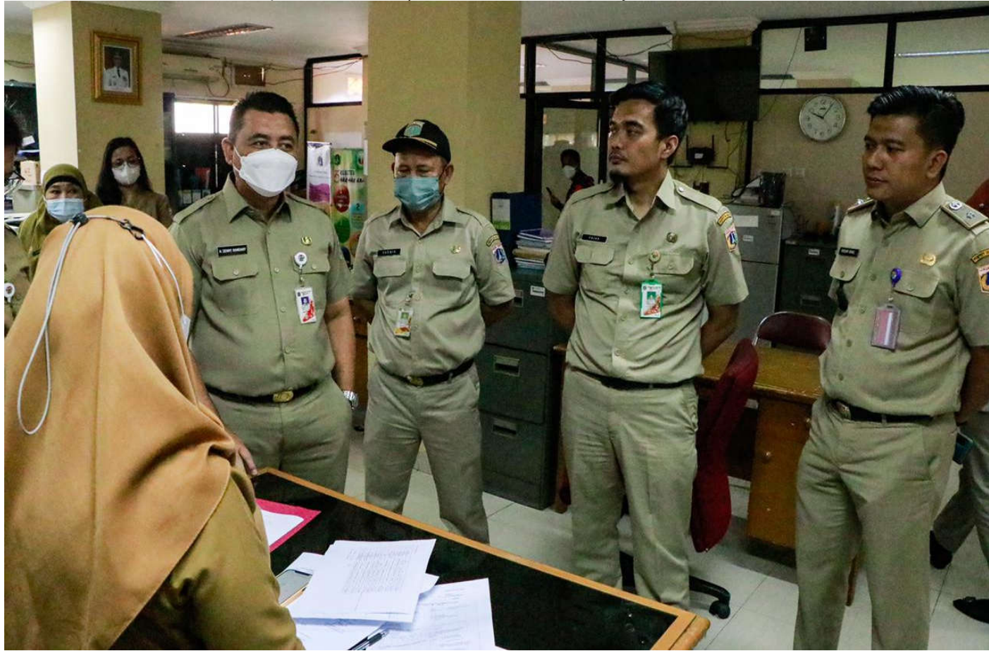
Aspem melakukan peninjauan pembinaan pelaksanaan Survei Kepuasan Masyarakat (SKM) di Kantor Kelurahan Kebon Melati.

Pemerintahan 22 Nov, 2022 Reporter: Maulana | Editor: Andreas Pamakayo