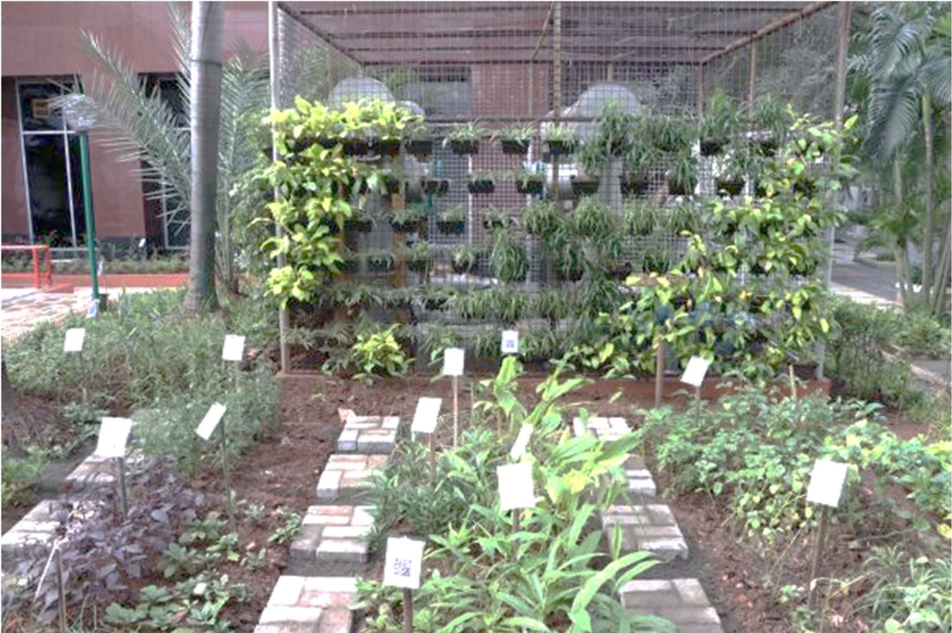
Ilustrasi.