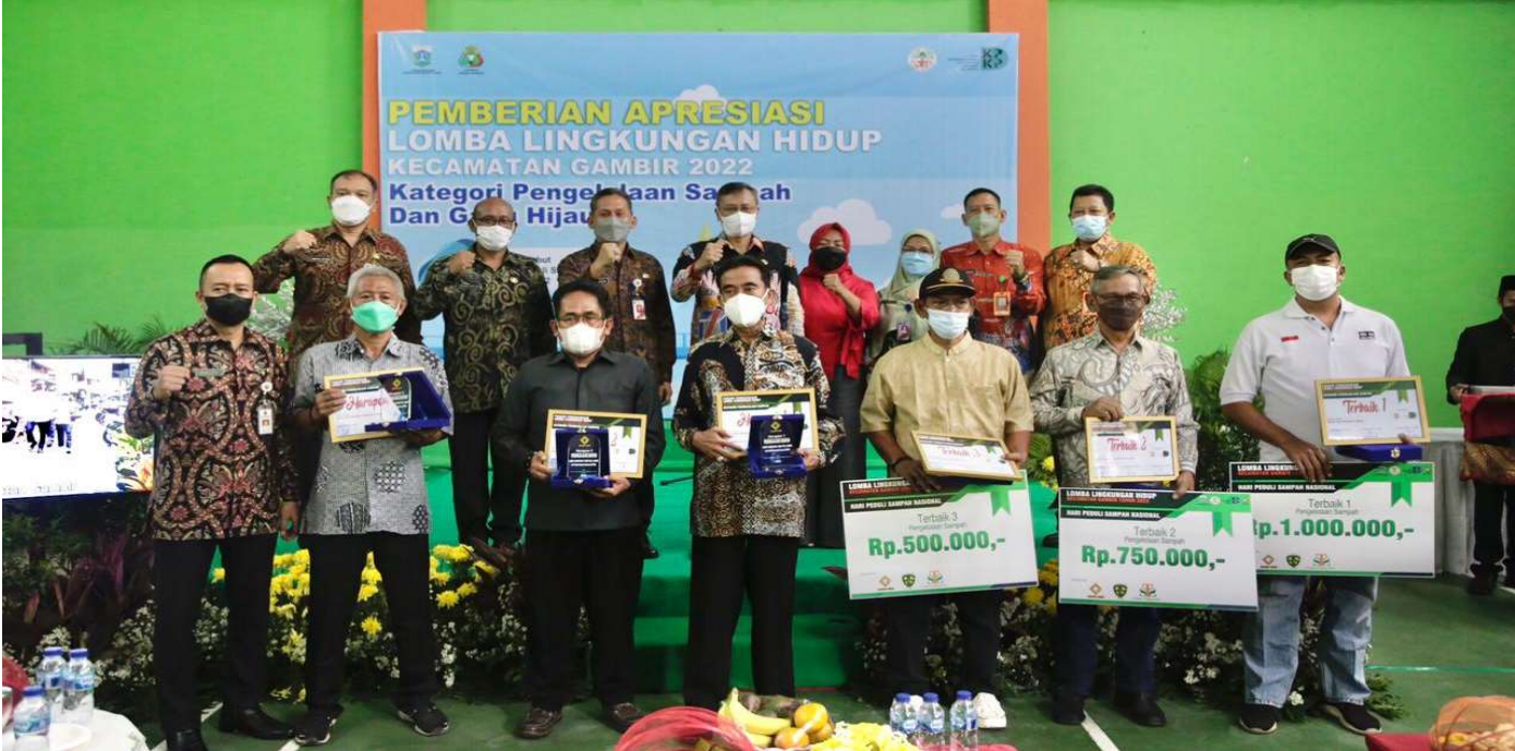
Pemberian apresiasi bagi pemenang lomba Lingkungan Hidup Tingkat Kecamatan Gambir.

Kelurahan Petojo Utara RW 06 dan Kelurahan Cideng RW 01 terbaik pertama dalam lomba Lingkungan Hidup Tingkat Kecamatan Gambir.