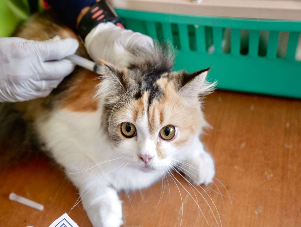
Vaksinasi HPR di Kelurahan Kramat.