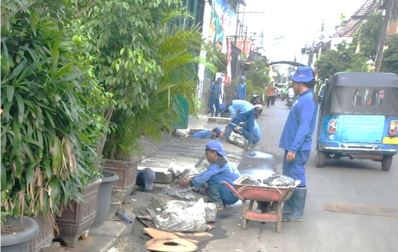
Pengurasan saluran air di Jalan Kalibaru Timur III sisi utara RW 07 Kelurahan Bungur.

Perekonomian & Pemb 24 Feb, 2022 Reporter: Maulana | Editor: Andreas Pamakayo