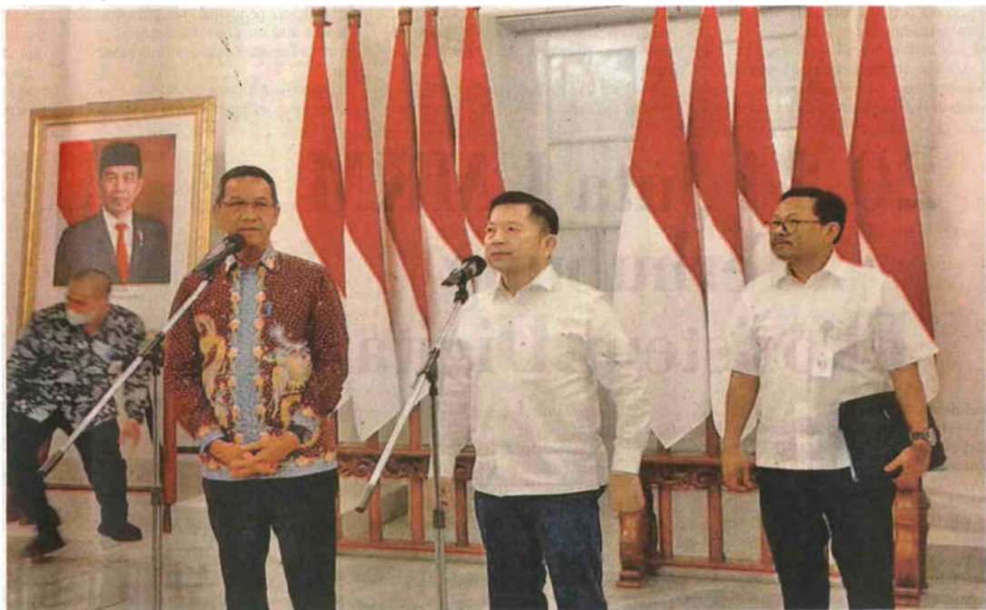
MENTERI BAPPENAS — Penjabat (PJ) Gubernur DKI Jakarta, Heru Budi Hartono bersama dengan Menteri Badan Perencanaan Pembangunan Nasional (Bappenas), Suharso Monoarfa di Balai Kota DKI Jakarta, Kecamatan Gambir, Jakarta Pusat, Kamis (24/11/2022). Pihaknya menggelar diskusi tertutup terkait kepindahan IKN.

Yang terpenting bagi Menteri Suharsono adalah bahwa DKI Jakarta akan tetap menjadi pusat kegiatan ekonomi di Indonesia. (m36)