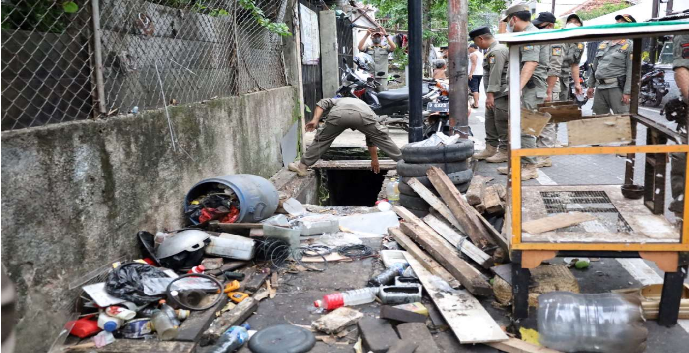
Penertiban bangunan yang berdiri di atas saluran air.

Pemerintahan 24 Nov, 2022 Reporter: Azzahara Magang | Editor: Andreas Pamakayo