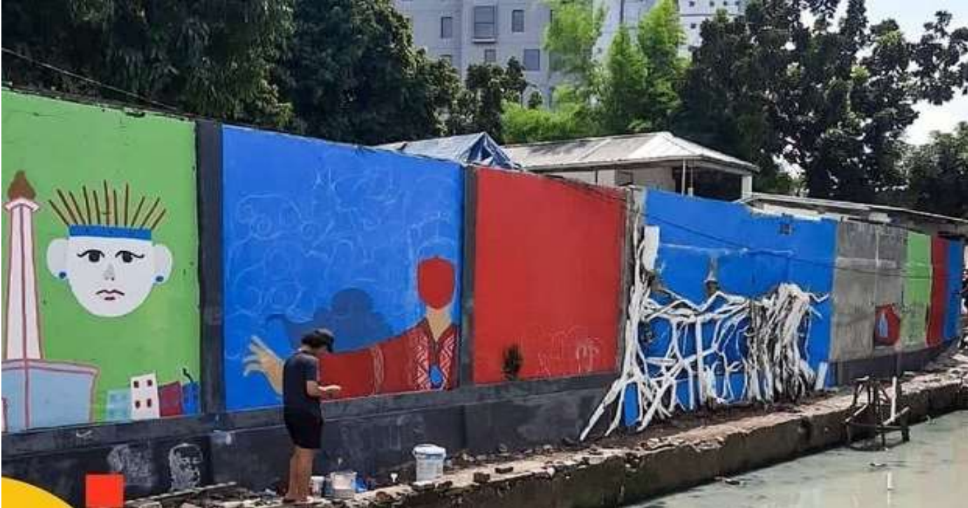
Penataan kawasan unggulan di wilayah Kelurahan Kampung Bali.