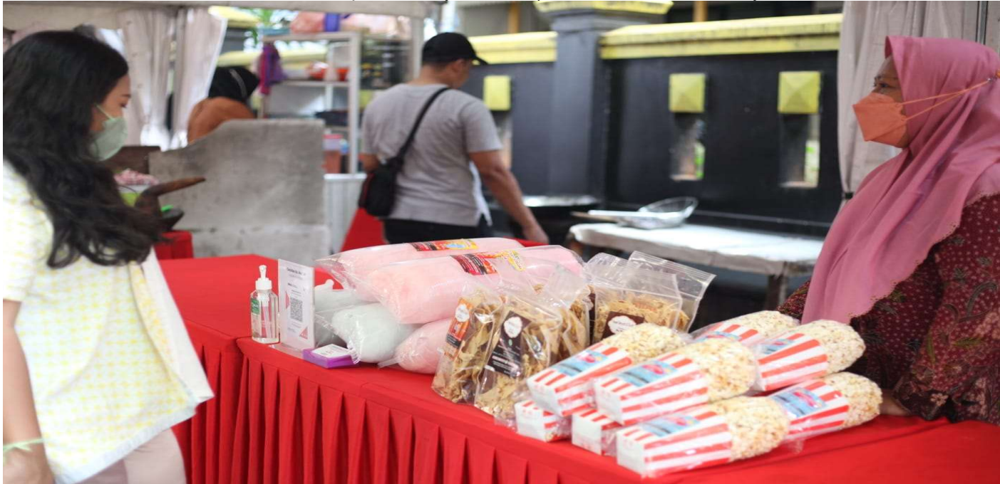
Bazar Jakpreneur Kecamatan Tanah Abang.