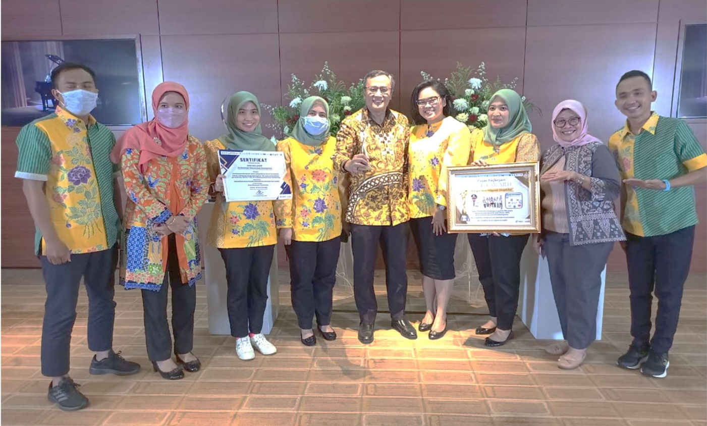
Puskesmas Kecamatan Kemayoran Raih Gold Award kategori Mutu Pelayanan Masyarakat.