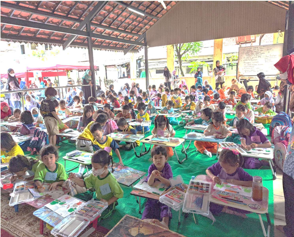
Lomba mewarnai dan bazar Jakpreneur, di RPTRA Taman Guntur, Kecamatan Tanah Abang, Rabu (26/10).

Perekonomian & Pemb 26 Oct, 2022 Reporter: Maulana | Editor: Andreas Pamakayo