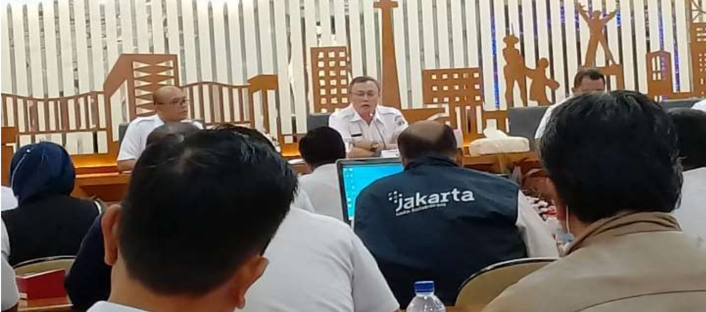
Rapat terbatas, di Ruang Pola, Kantor Wali Kota Jakarta Pusat, Jalan Tanah Abang I, Gambir, Rabu (26/10).

Perekonomian & Pemb 26 Oct, 2022 Reporter: Andreas Pamakayo | Editor: Andreas Pamakayo