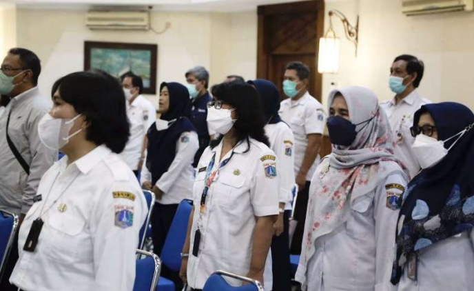
Pembekalan ASN yang akan memasuki Batas Usia Pensiun (BUP).

Pemerintahan 26 Oct, 2022 Reporter: Maulana | Editor: Andreas Pamakayo