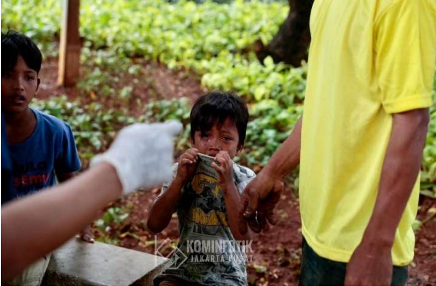
Penjangkauan PPKS di wilayah Jakarta Pusat.

Pemerintahan 26 Oct, 2022 Reporter: Andreas Pamakayo | Editor: Andreas Pamakayo