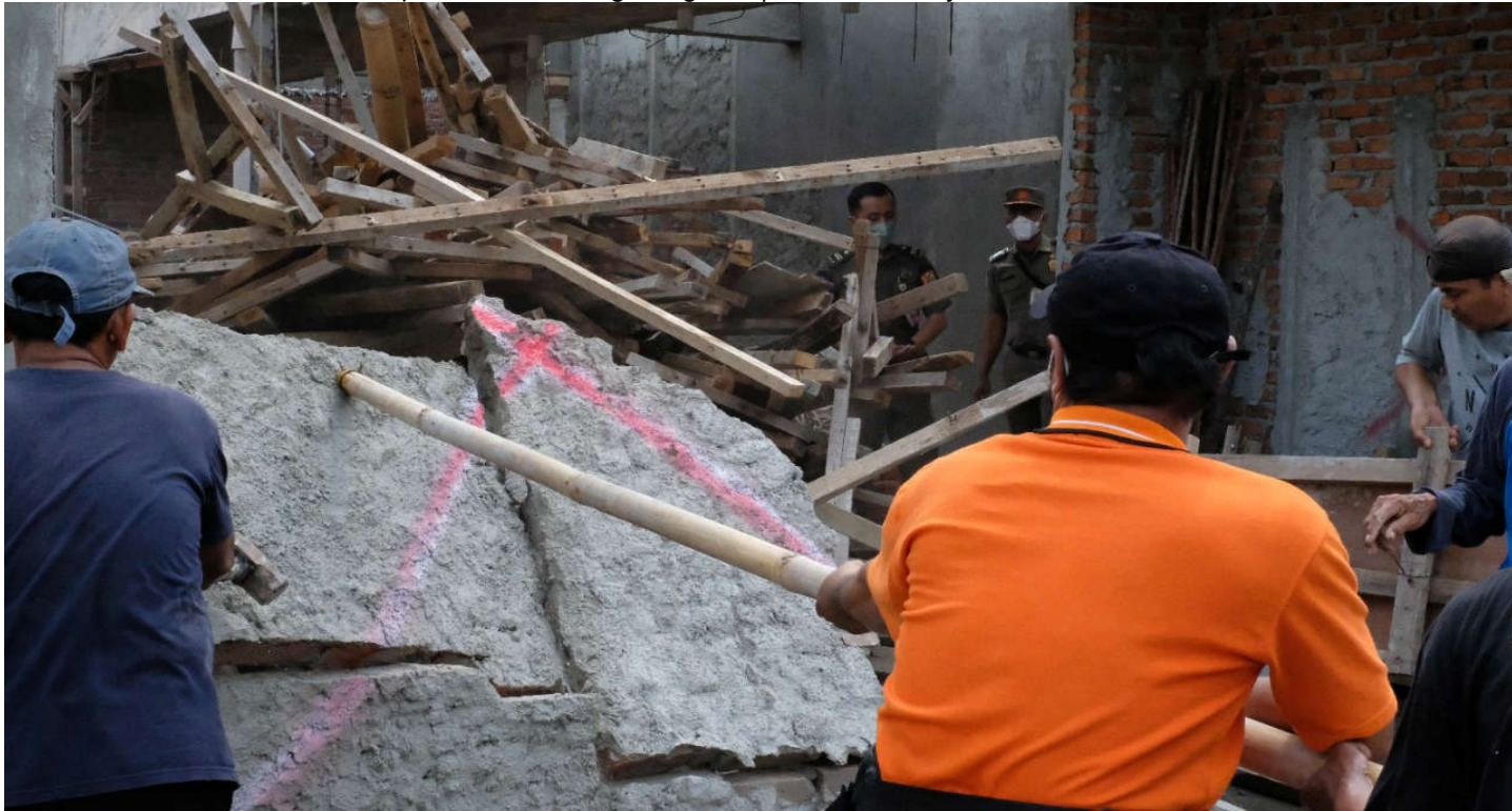
Petugas melakukan eksekusi terhadap pelanggaran aturan, Senin (28/11).

Pemerintahan 28 Nov, 2022 Reporter: Berlian Sigit Sugiarto | Editor: Shendy Adam