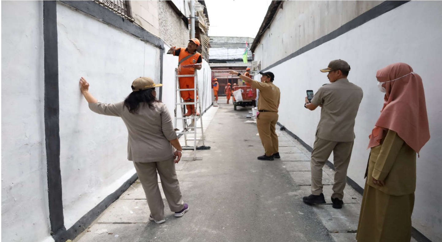
Penataan kawasan di Kelurahan Kampung Rawa terus dilakukan.