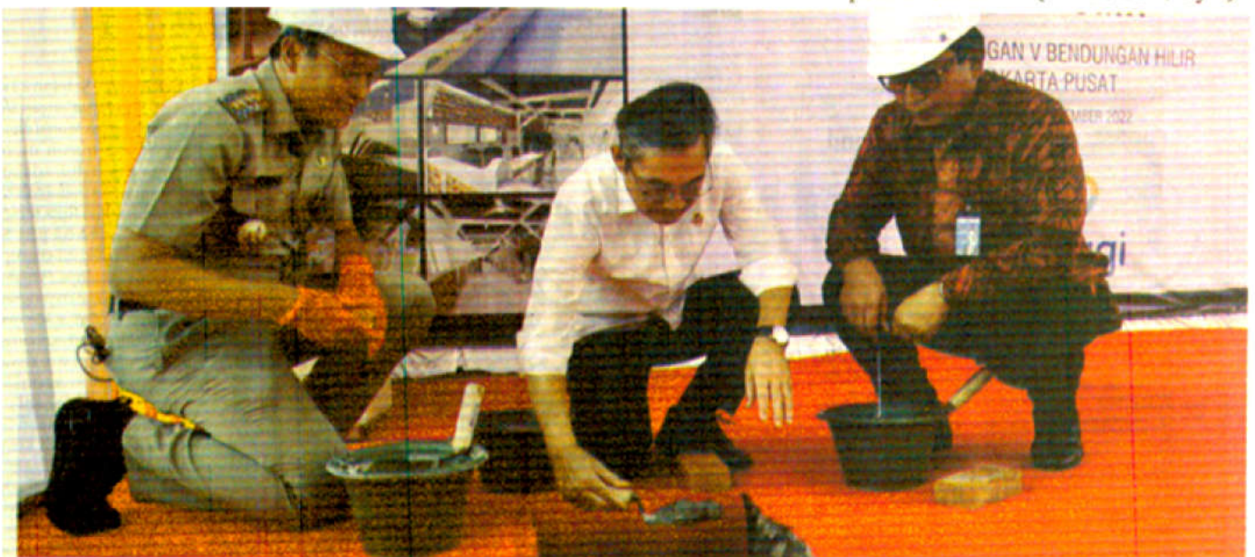
SINERGI Anggota VII BPK Novy G.A. Pelenkahu (tengah) menyendokkan semen pertama pembangunan kantin layang usaha mikro dan kecil (UMK) di Jalan Pejompongan V, Bendungan Hilir, Tanah Abang, kemarin (28/11).

Saat ini, kantin layang di atas trotoar di Jakarta juga ada di sekitar Kompleks Kementerian PUPR di Kebayoran Baru. Kantin yang beroperasi sejak Januari lalu itu mengakomodasi para pedagang makanan yang selama ini berjualan di sekeliling kompleks tersebut. ( dom/co1/byu )