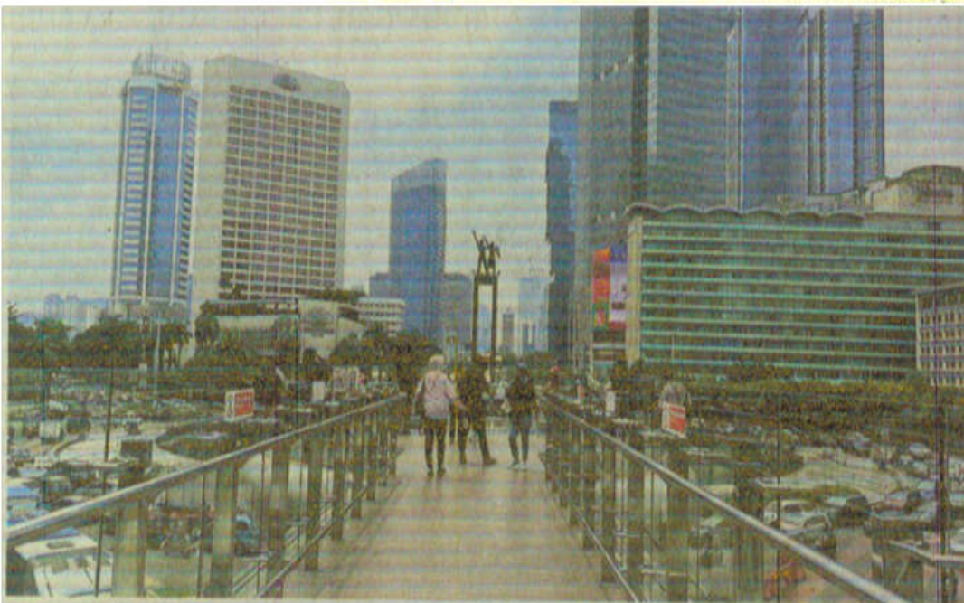
MIS FRANSISKA DEWI

Namun, Indra menyatakan, dalam merevitalisasi kedua halte ikonik, PT Transjakarta tidak gegabah dan tidak ada aturan yang dilanggar. Secara konteks, desain halte menggunakan pendekatan dengan perspektif universal yang dapat diakses seluruh kelompok dengan berbagai macam pengguna. (Z02)