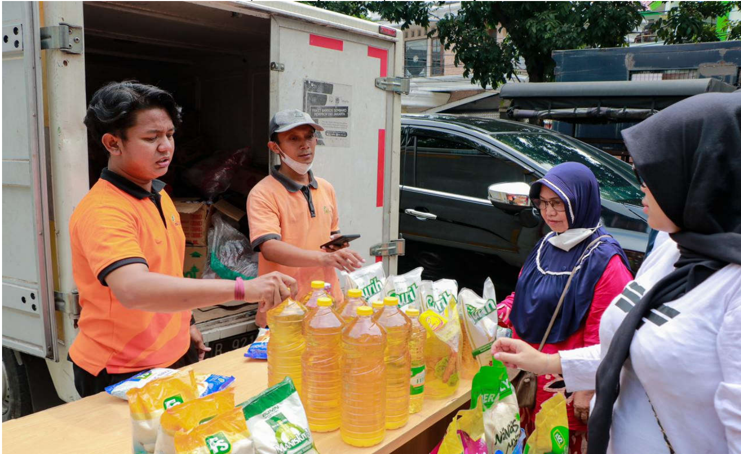
Petugas PD Pasar Jaya menggelar barang-barang dalam program pasar murah di Kecamatan Johar Baru, Senin (28/11).