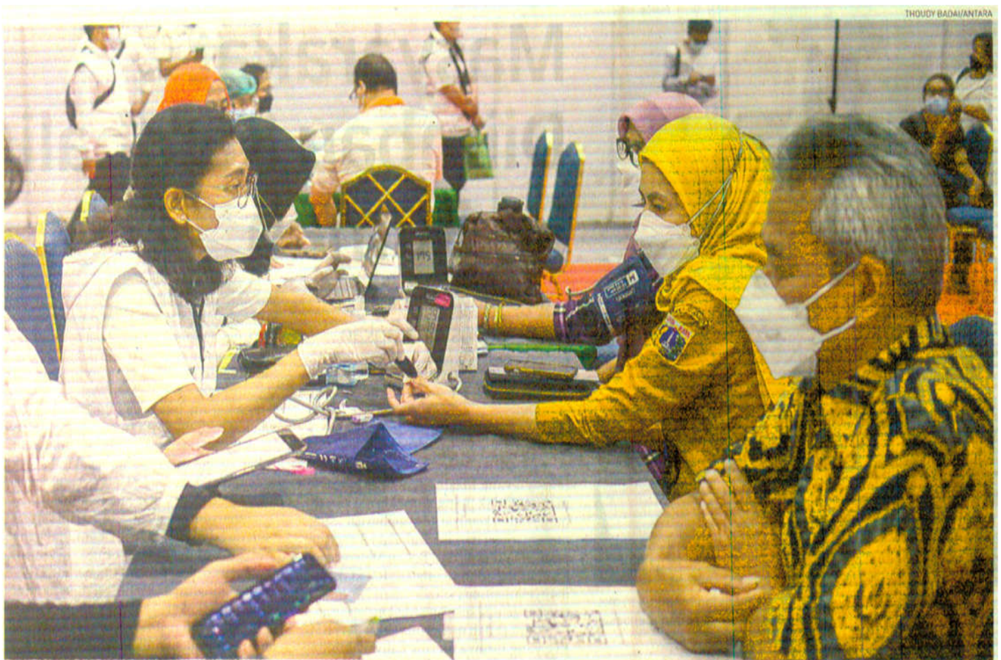
PEDULI KESEHATAN Petugas memeriksa kesehatan pengunjung pada peringatan Hari Kesehatan Nasional (HKN) DKI Jakarta di Jakarta Convention Center, Jakarta Pusat, Senin (28/11). Dinas Kesehatan DKI Jakarta menyelenggarakan peringatan HKN tingkat provinsi bertema 'Yuk Ramaikan! Bersama wujudkan Jakarta Sehat Jiwa dan Raga' yang mengajak masyarakat untuk peduli menjaga kesehatan.

Republika - Kesra - DINAS KESEHATAN - Provinsi DKI Jakarta - Pelayanan Kesehatan - 29 November 2022 -