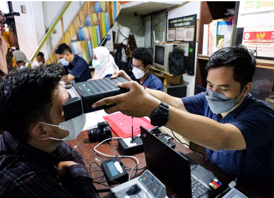
Sudin Dukcapil Kecamatan Cempaka Putih menggelar layanan jemput bola di Sekretariat RW 04 Cempaka Putih Timur.

Pemerintahan 29 Mar, 2022 Reporter: Maulana | Editor: Andreas Pamakayo