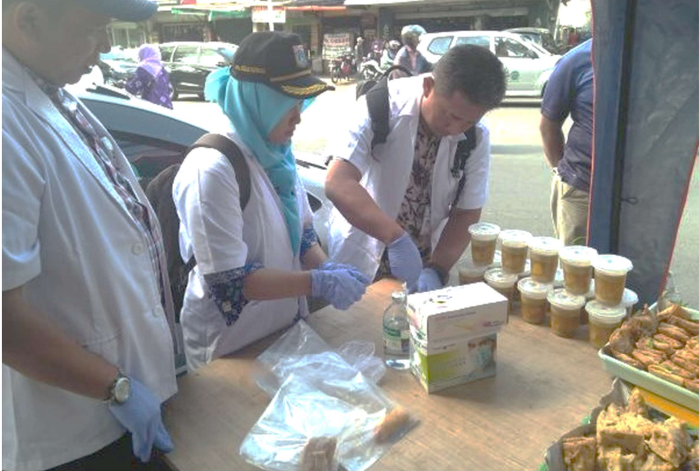
Ilustrasi. (foto diambil jauh sebelum pandemi)