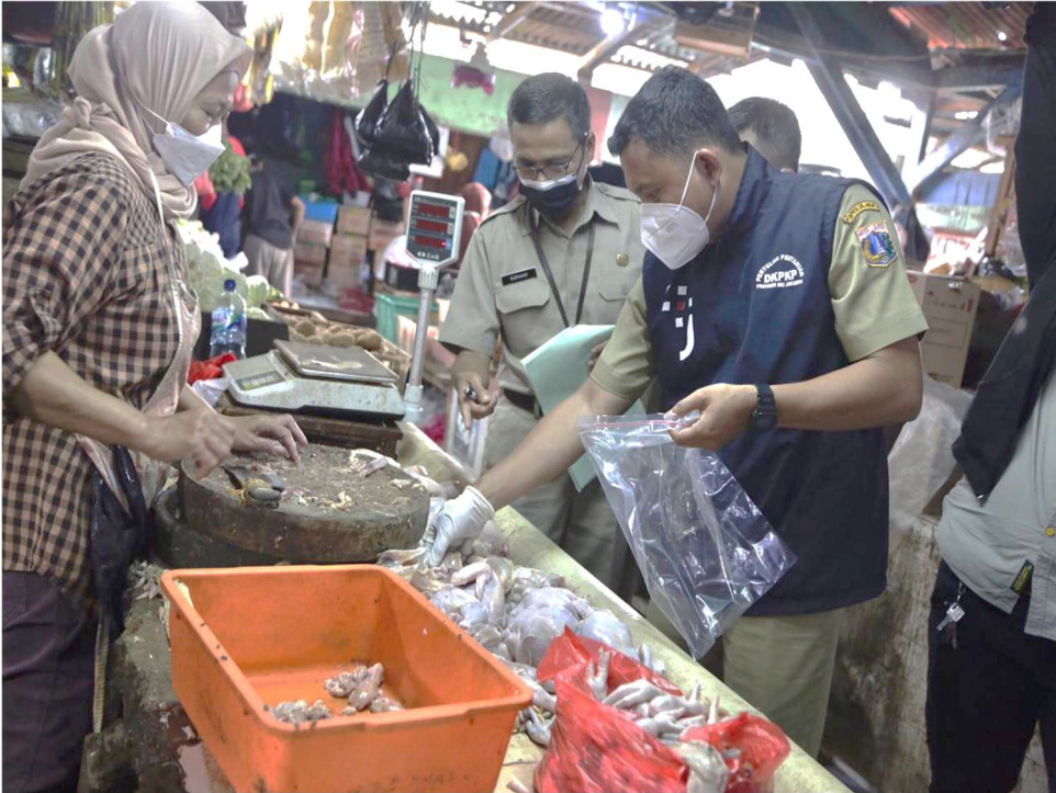
Sudin KPKP melakukan pengawasan keamanan pangan terpadu jelang bulan Ramadan 1443 H.

Perekonomian & Pemb 29 Mar, 2022 Reporter: Maulana | Editor: Andreas Pamakayo