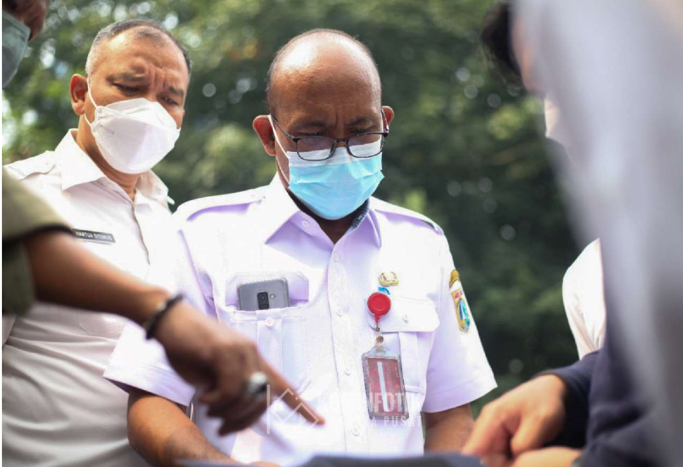
Asekbang meninjau pembangunan jembatan di Jalan Karet Pasar Baru Barat, Kelurahan Karet Tengsin, Kecamatan Tanah Abang, Rabu (30/3).