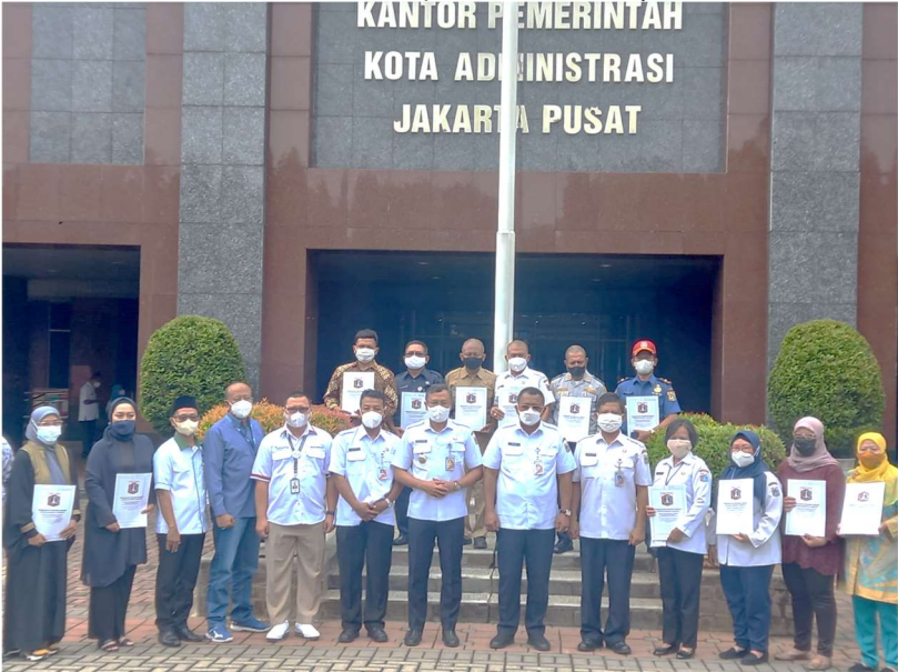
Surat Keputusan (SK) Pensiun kepada 19 Aparatur Sipil Negara (ASN), yang telah mencapai Batas Usia Pensiun (BUP).

Pemerintahan 30 Mar, 2022 Reporter: Maulana | Editor: Andreas Pamakayo