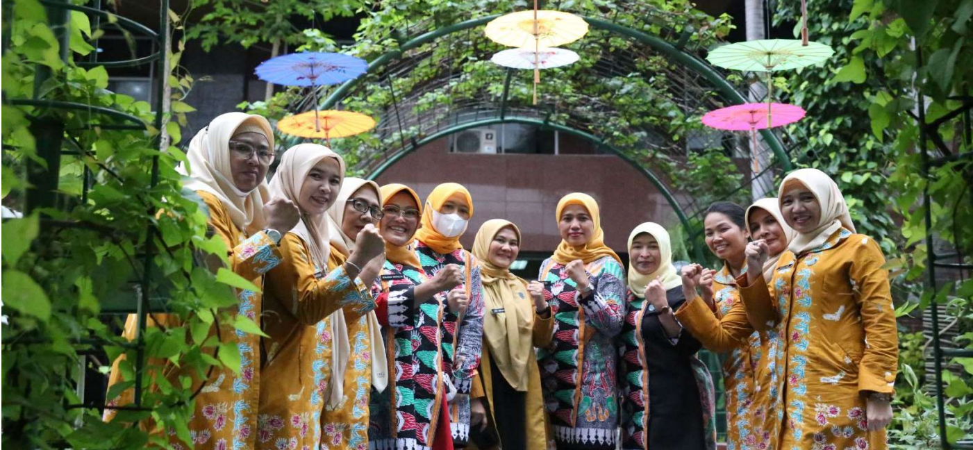
Pj Ketua TP-PKK DKI Jakarta saat meninjau JP Farm.