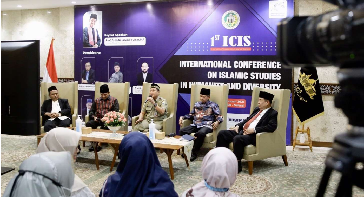
Konferensi Internasional Studi Islam Tahun 2023, di Ruang VVIP Masjid Istiqlal.

Kesra 31 Jan, 2023 Reporter: Zaki Ahmad Thohir | Editor: Andreas Pamakayo