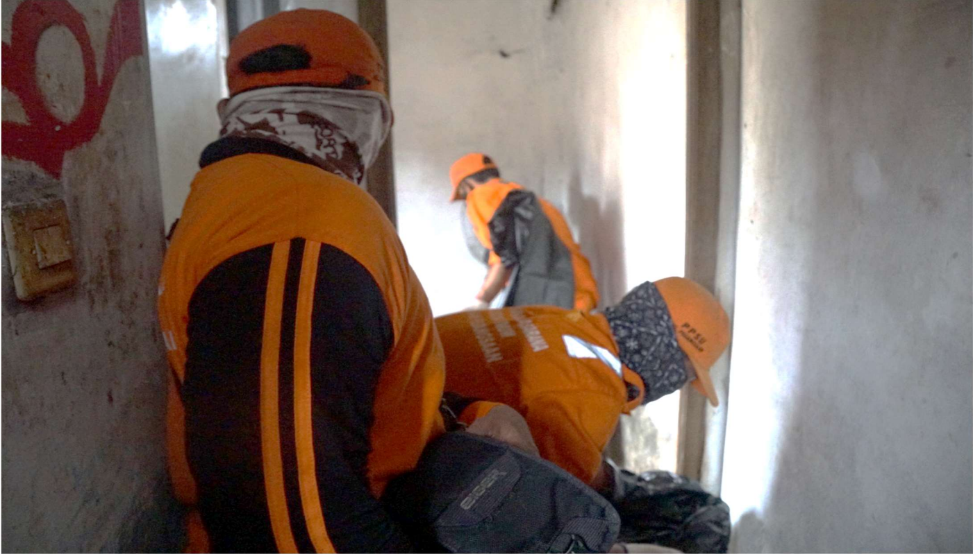
PPSU Kelurahan Pegangsaan lakukan bersih-bersih di rumah kosong.

Pemerintahan 31 Jan, 2023 Reporter: Farandy Purba | Editor: Andreas Pamakayo