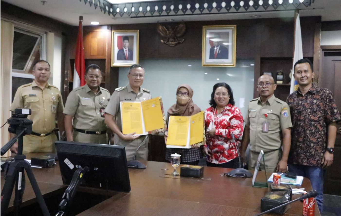
Penandatanganan BAST.