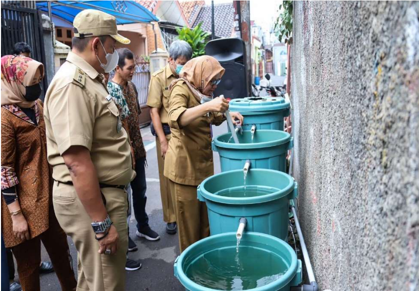
Tim Verifikasi meninjau tempat membuat kolam ikan dengan konsep terasering.