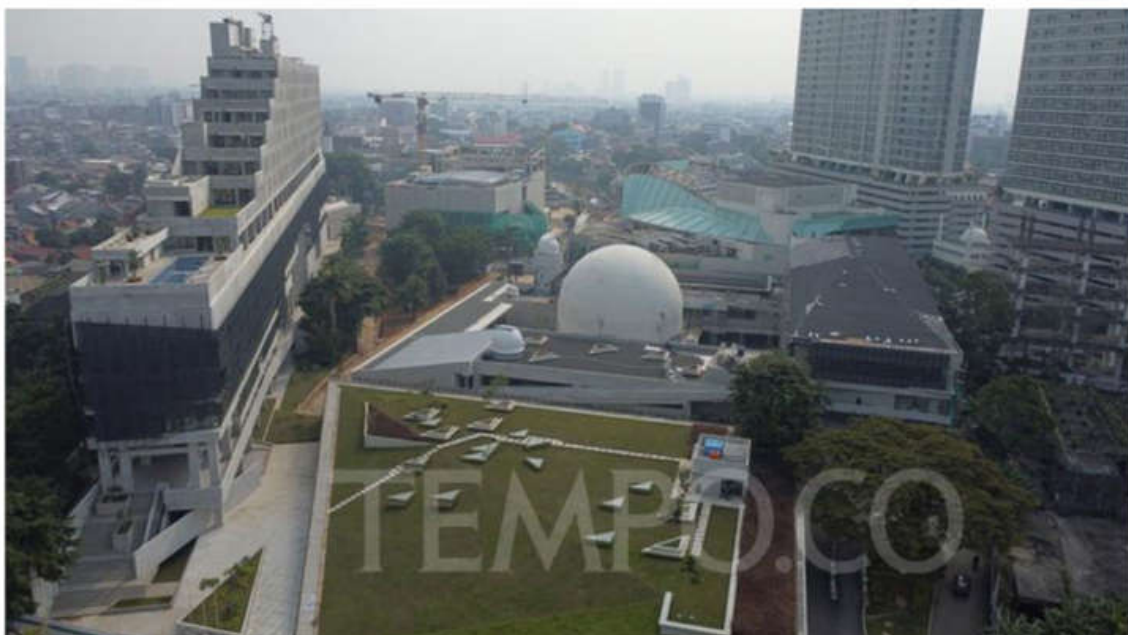
Foto udara proyek revitalisasi Taman Ismail Marzuki (TIM) di Cikini, Jakarta Pusat, Jumat, 11 Maret 2022. Pengerjaan revitalisasi TIM yang dimulai pertengahan tahun 2019 tersebut ditargetkan selesai pada akhir tahun 2022.