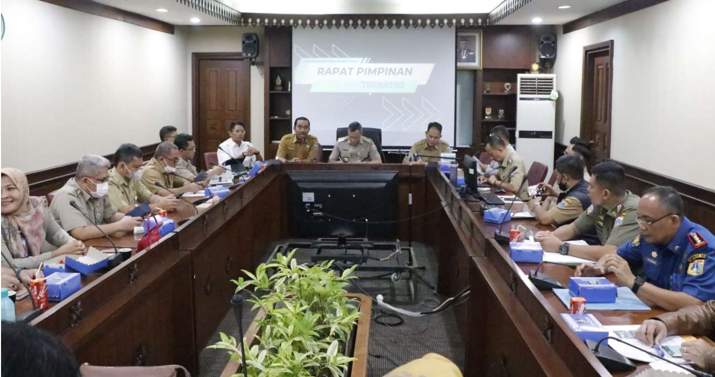
Rapat pimpinan terbatas.