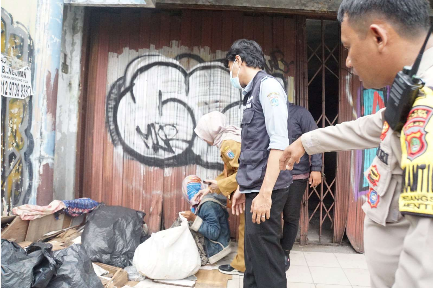
Jajaran Kecamatan Menteng dan Kelurahan Pegangsaan melakukan penjangkauan PPKS.