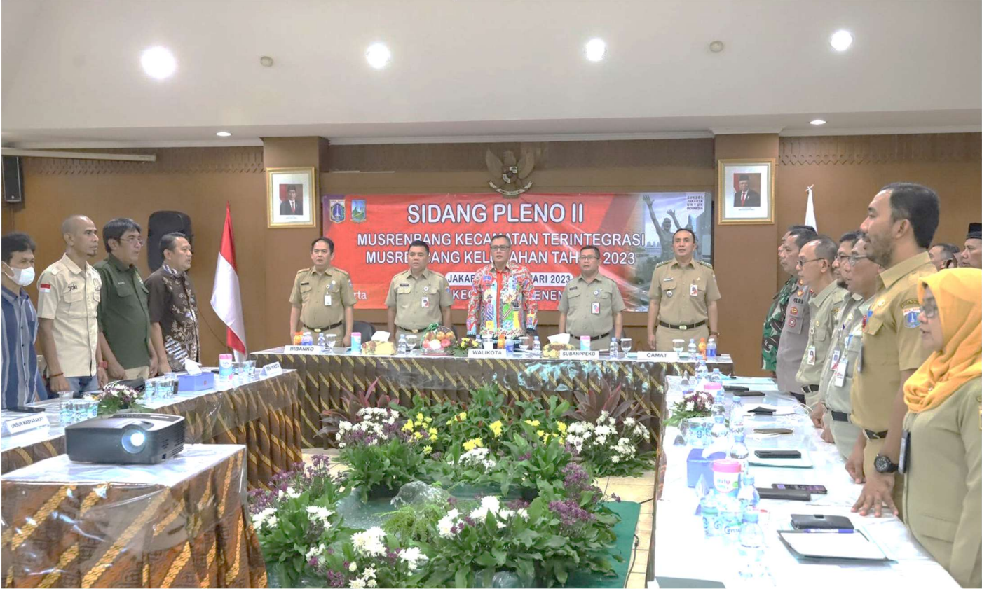
Sidang pleno II musrenbang Kecamatan Senen.

Pemerintahan 28 Feb, 2023 Reporter: Dinar Pusung | Editor: Andreas Pamakayo