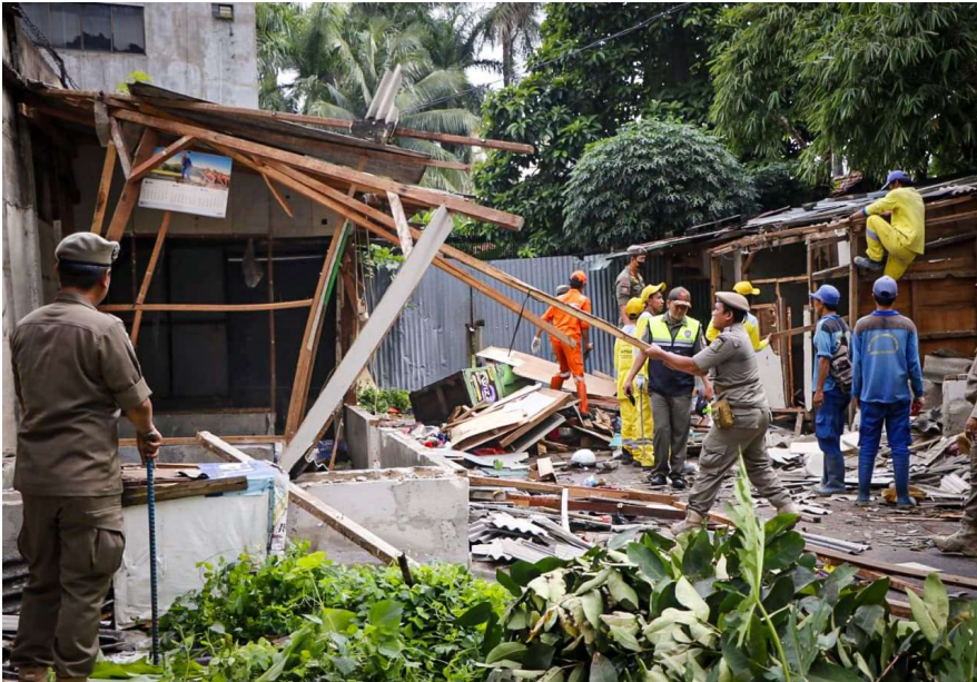
Petugas gabungan menertibkan bangunan liar di Jalan Juanda IV.