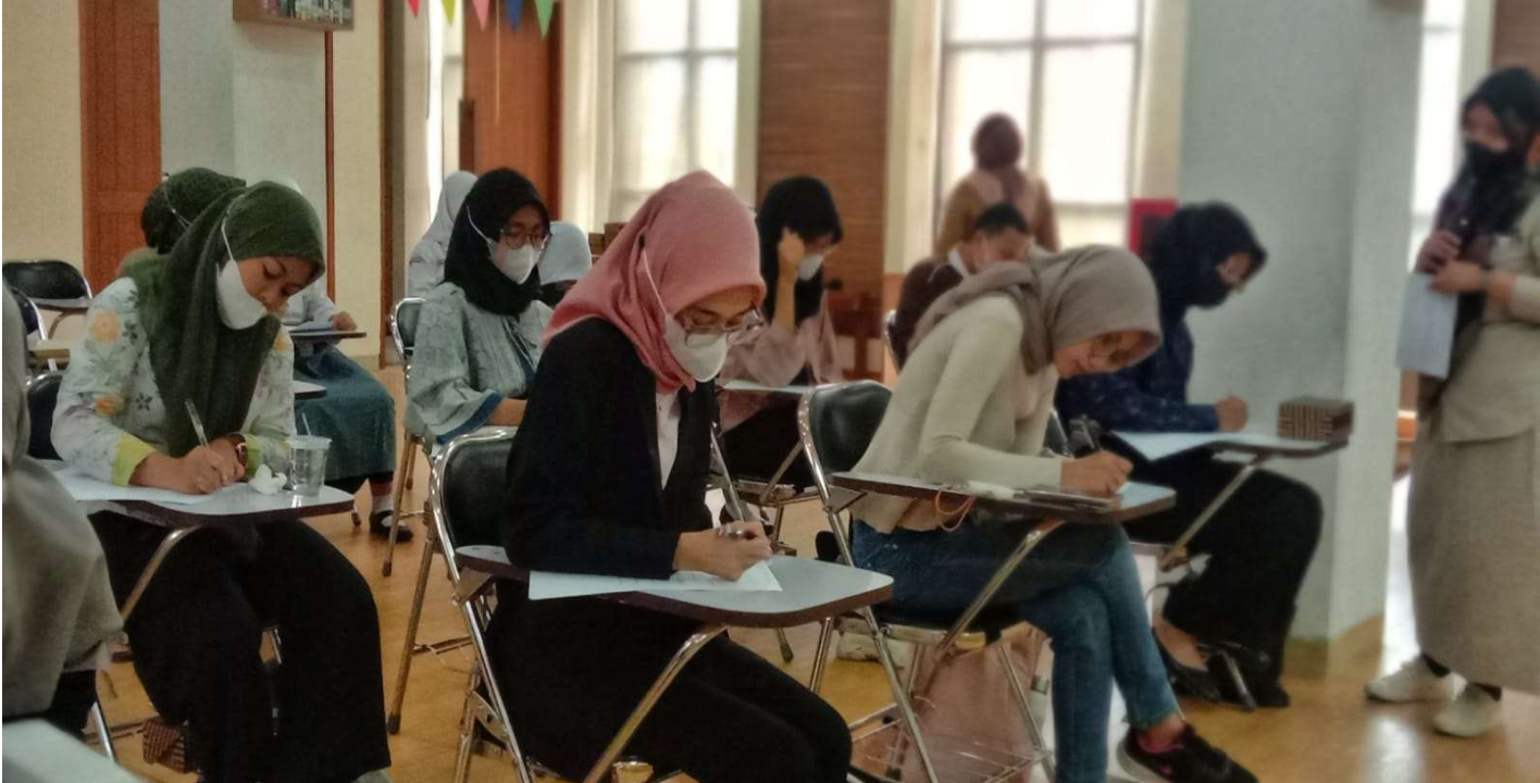
Sebanyak 23 kandidat calon Duta Baca Tingkat Kota mengikuti seleksi tertulis.

Kesra 28 Feb, 2023 Reporter: Farandy Purba | Editor: Andreas Pamakayo