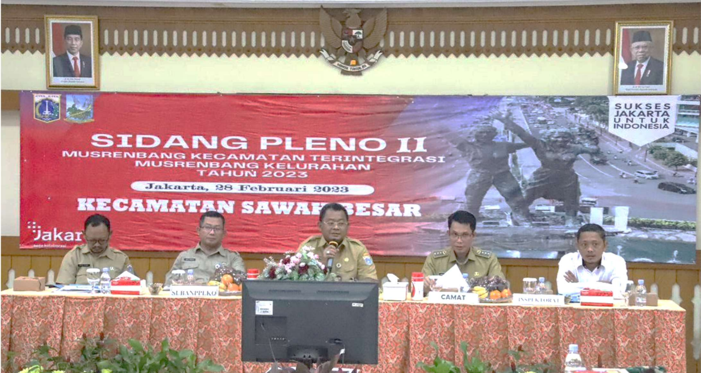
Sidang pleno II musrenbang Kecamatan Sawah Besar.

Pemerintahan 28 Feb, 2023 Reporter: Andreas Pamakayo | Editor: Andreas Pamakayo