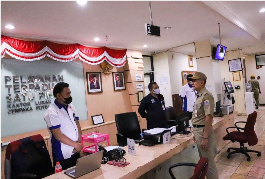
Camat Cempaka Putih sidak pelayanan PTSP.

Pemerintahan 2 Jan, 2023 Reporter: Berlian Sigit | Editor: Andreas Pamakayo