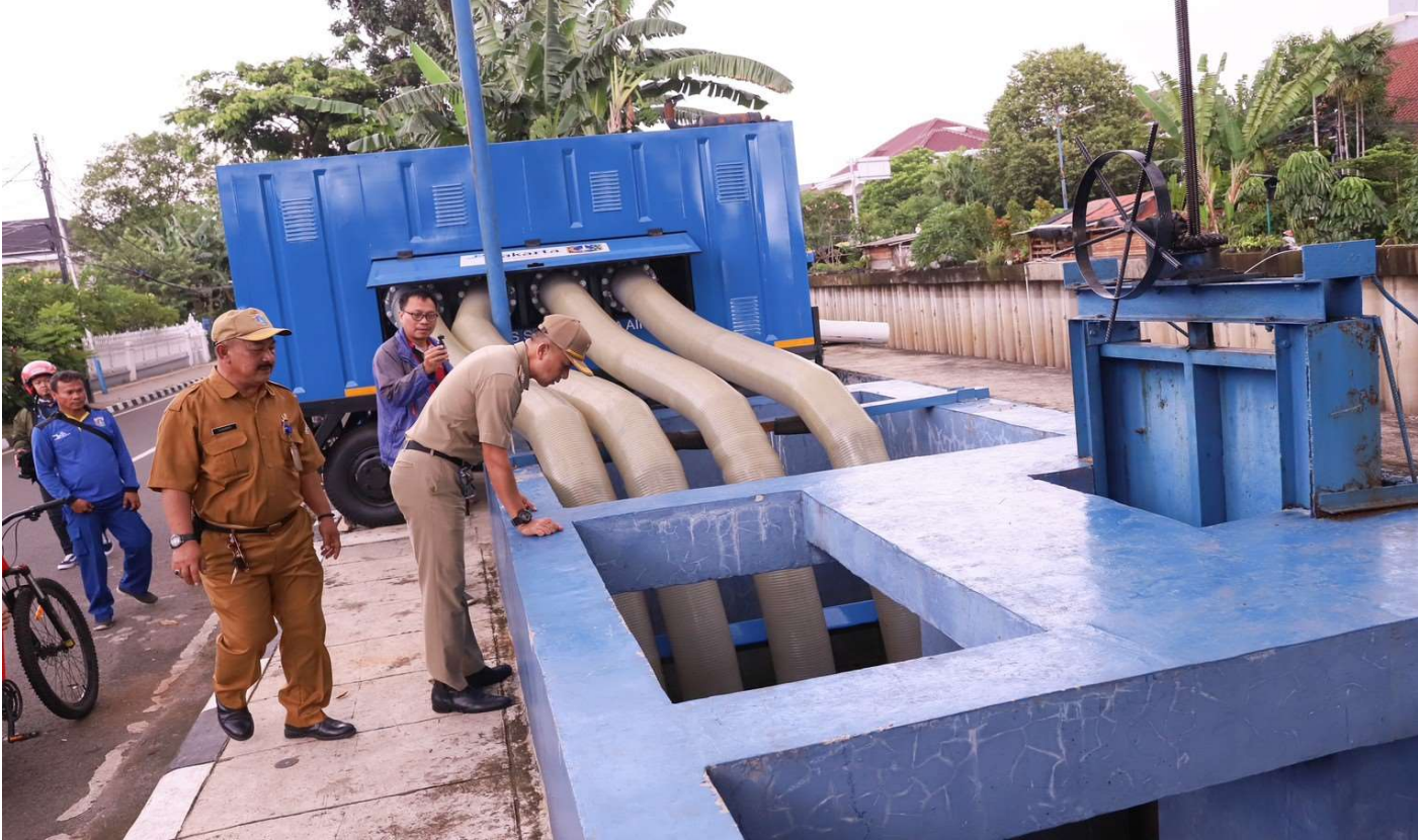
Camat Cempaka Putih memantau pompa air.

Perekonomian & Pemb 2 Jan, 2023 Reporter: Malik Maulana | Editor: Andreas Pamakayo