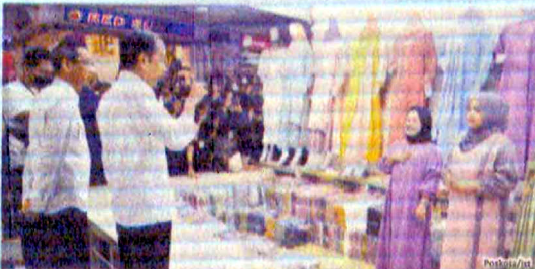
Presiden Joko Widodo saat mengunjungi Pasar Tanah Abang, Jakarta.