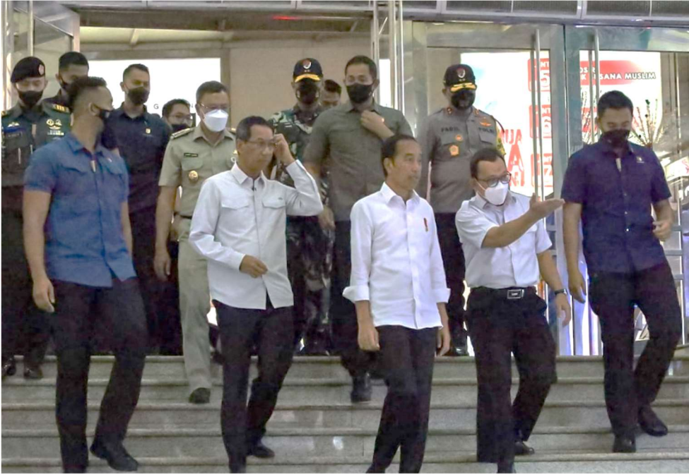
Presiden Jokowi tinjau Pasar Tanah Abang.