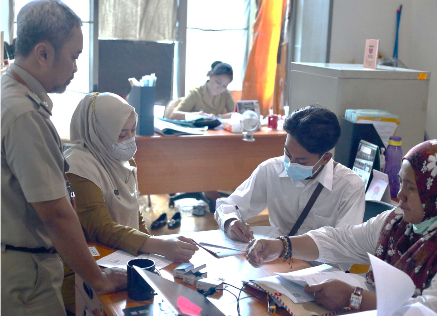
Penandatanganan kontrak kerja PPSU Kelurahan Gelora.

Pemerintahan 2 Jan, 2023 Reporter: Andreas Pamakayo | Editor: Andreas Pamakayo