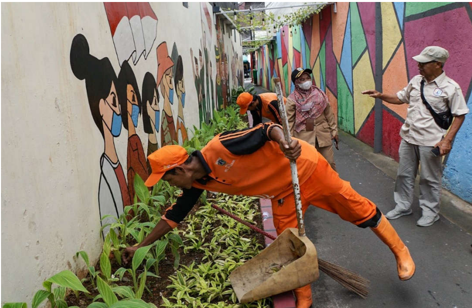
Penataan kawasan di Gang Pancasila, Kelurahan Paseban.