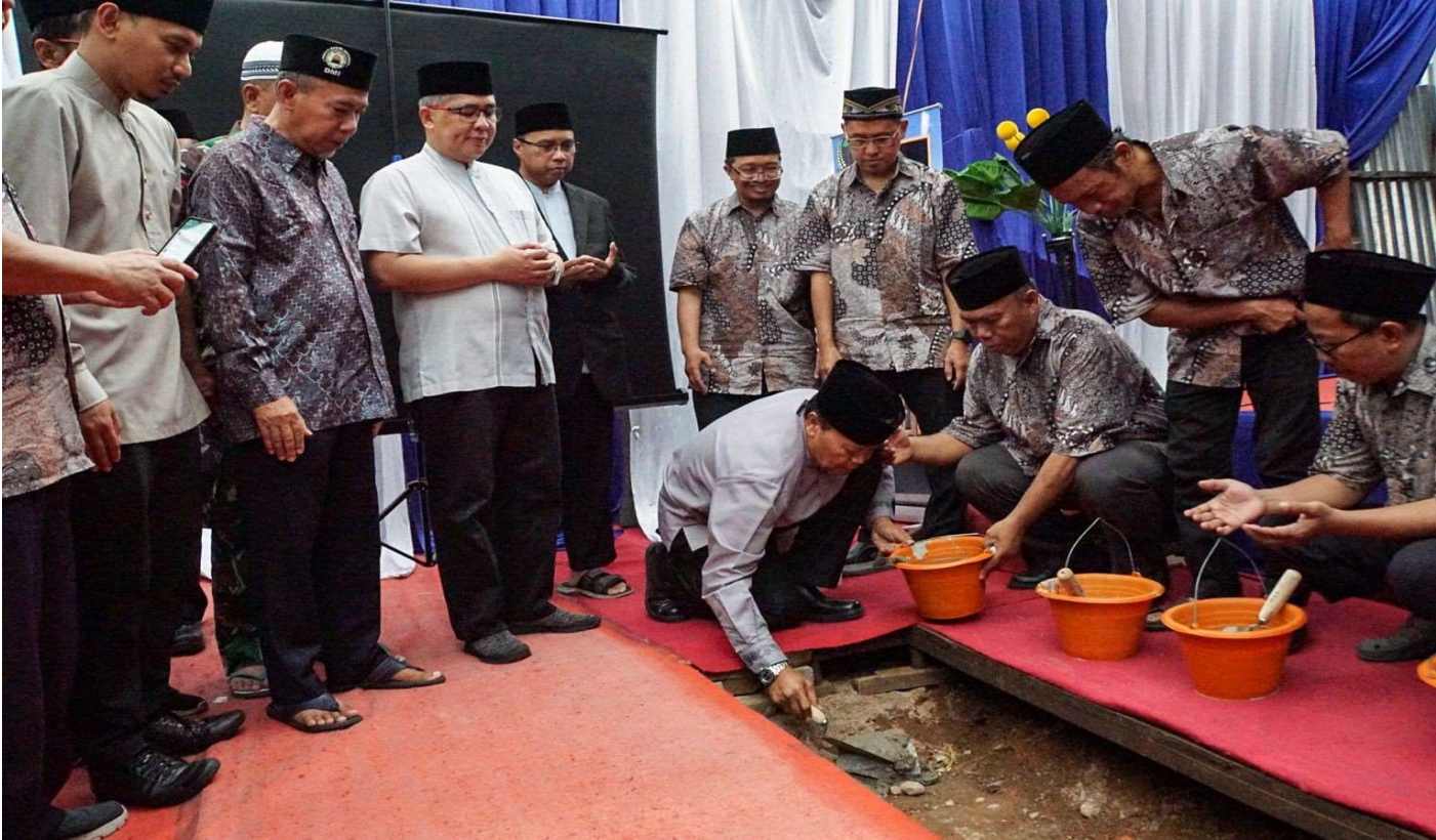
Peletakan batu pertama pembangunan Rumah Yatim dan Tahfidz Al-Qur'an.

Kesra 2 Apr, 2023 Reporter: Malik Maulana | Editor: Andreas Pamakayo