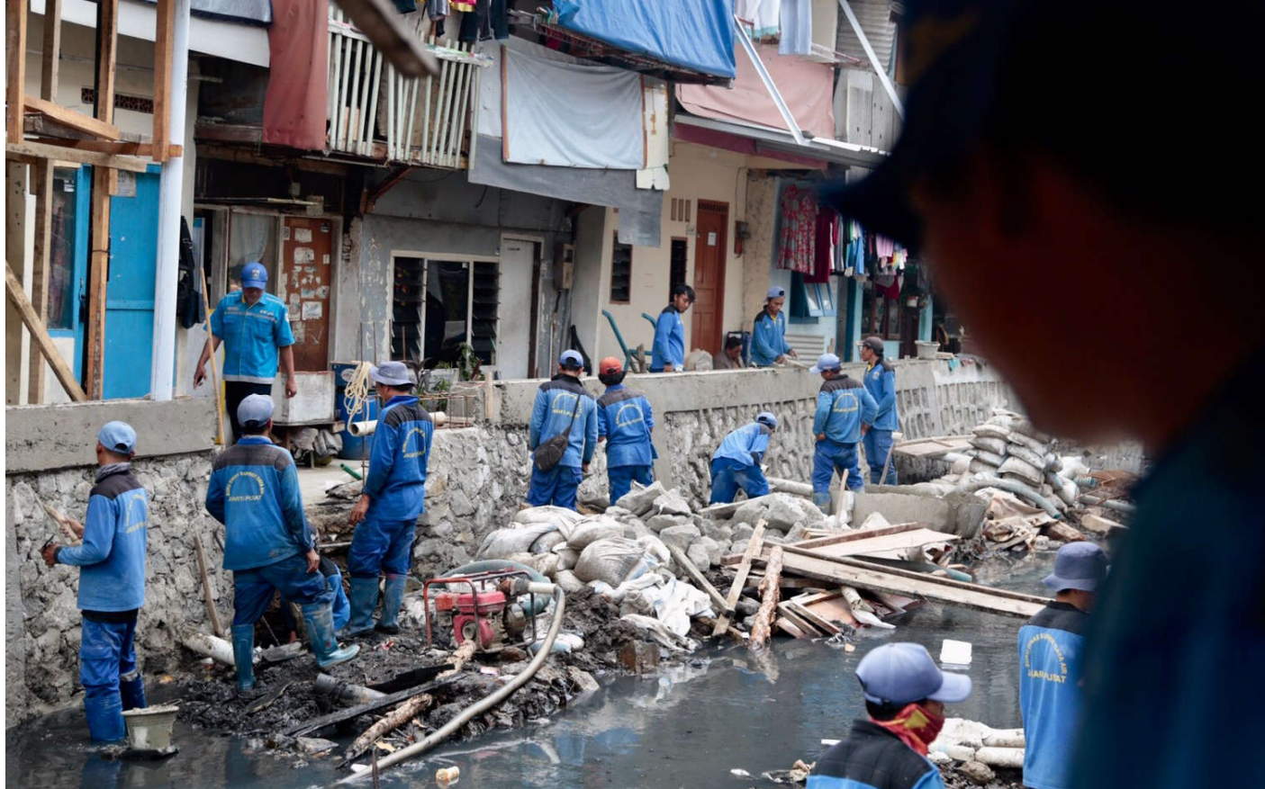
Pengerjaan turap Kali Anak Ciliwung.

Perekonomian & Pemb 3 Apr, 2023 Reporter: Danar Pusung | Editor: Andreas Pamakayo