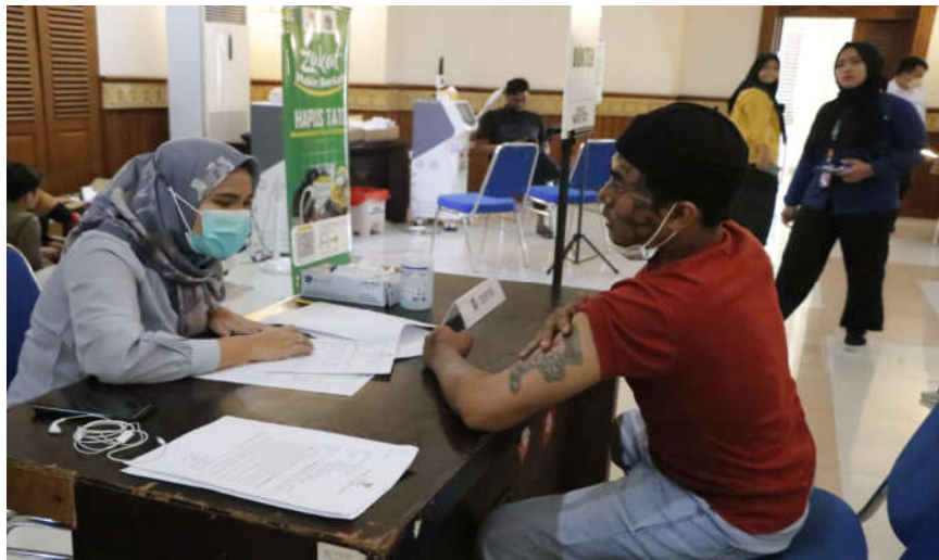
Hapus tato di Kantor Wali Kota Jakarta Pusat.

Kesra 3 Apr, 2023 Reporter: Maulana | Editor: Andreas Pamakayo