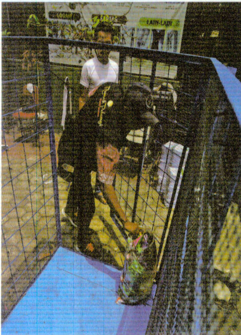
JAGA KEBERSIHAN: Petugas memisahkan sampah plastik di Bank Sampah Induk Gesit, Menteng Dalam, Jakarta Selatan. Pemprov DKI terus mendorong dilakukannya pengelolaan sampah di tingkat RW.