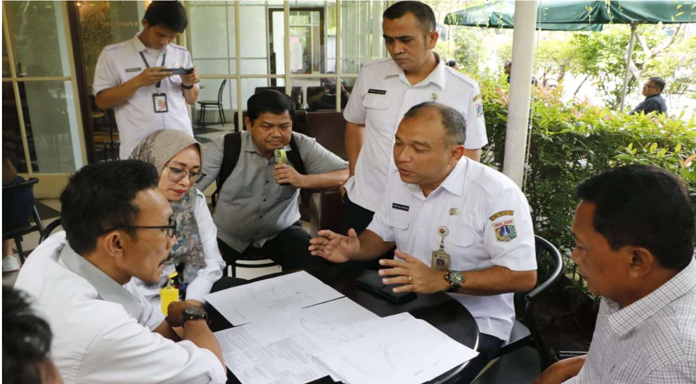
Kabag PKLH menerangkan fasos-fasum PT Bioskop Metropole.

Perekonomian & Pemb 3 May, 2023 Reporter: Maulana | Editor: Andreas Pamakayo