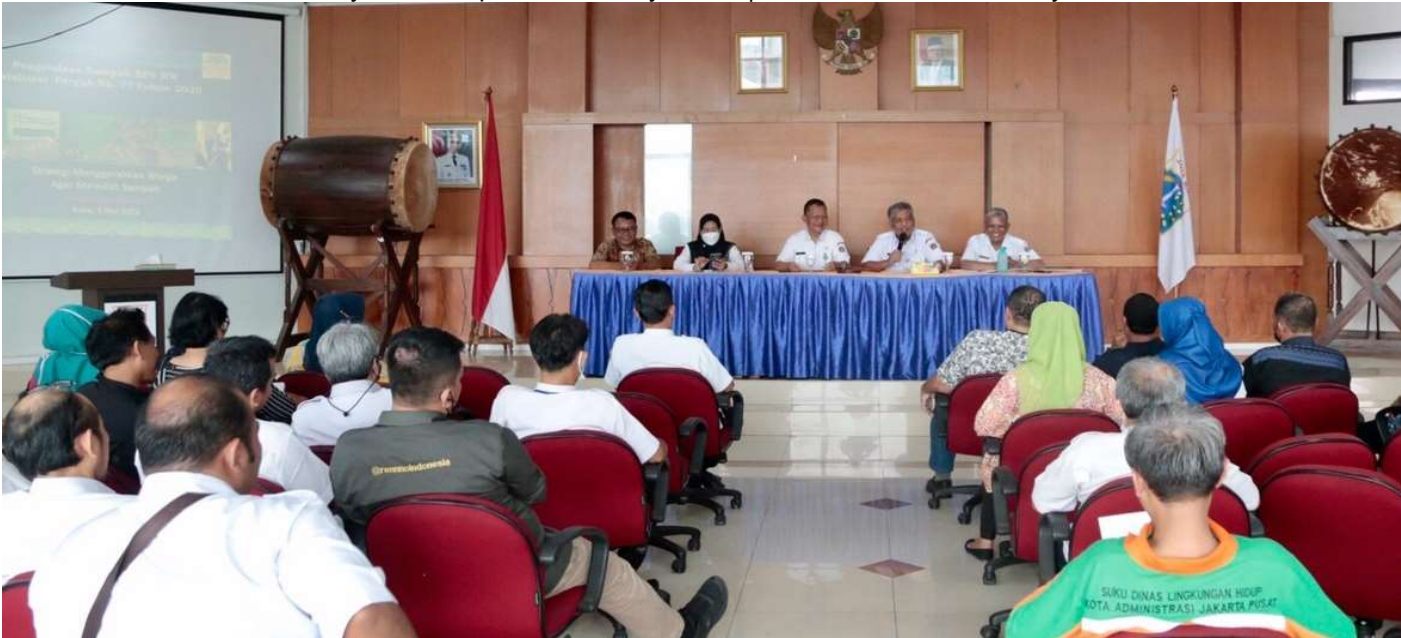
Sosialisasi pengelolaan sampah di tingkat RW.

Perekonomian & Pemb 3 May, 2023 Reporter: Farandy Purba | Editor: Andreas Pamakayo