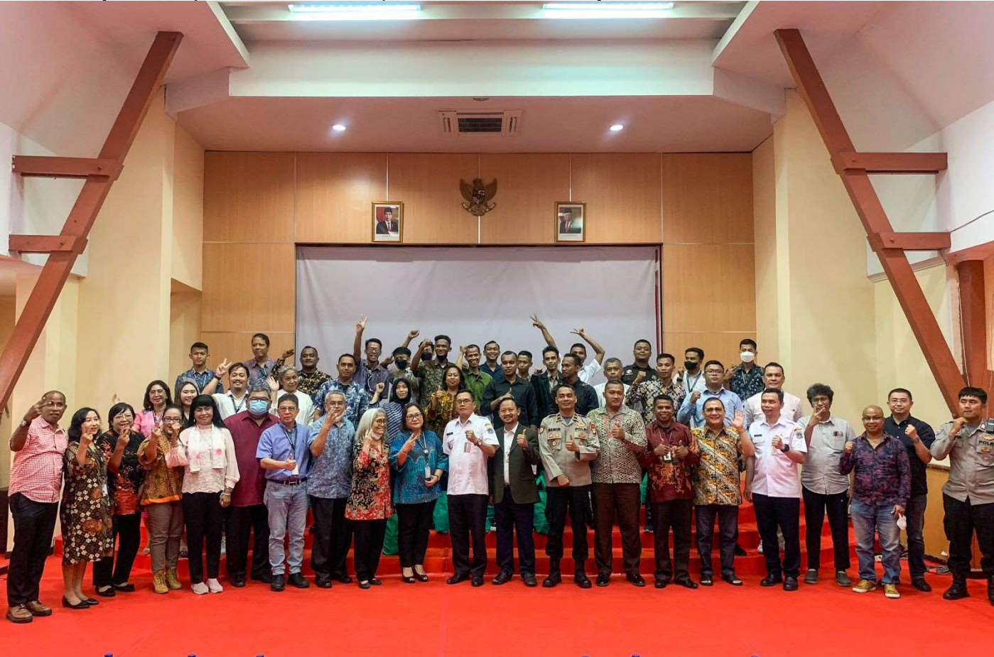
Halalbihalal di UKI Salemba.

Kesra 3 May, 2023 Reporter: Malik Maulana | Editor: Andreas Pamakayo