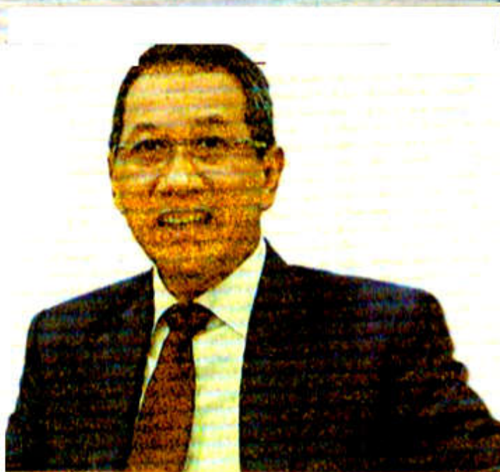
Penjabat Gubernur DKI Jakarta, Heru Budi Hartono

"Kalau nanti di Thamrin, Gatot Subroto, Sudirman, jam 08.00 WIB yang masuk kerja 50 persen, kan kurang lebih bisa 30 persen mengurangi (kemacetan)," pungkas Heru. (Aldi/mif)