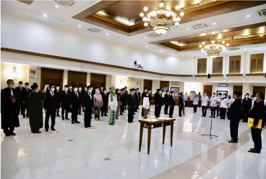
Pelantikan anggota PPK.

Pemerintahan 4 Jan, 2023 Reporter: Danar Pusung | Editor: Andreas Pamakayo