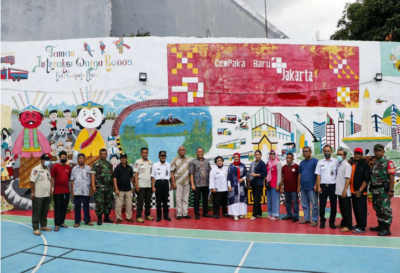
TP-PKK kunjungi penataan kawasan kelurahan.

Kesra 4 Jan, 2023 Reporter: Maulana | Editor: Andreas Pamakayo