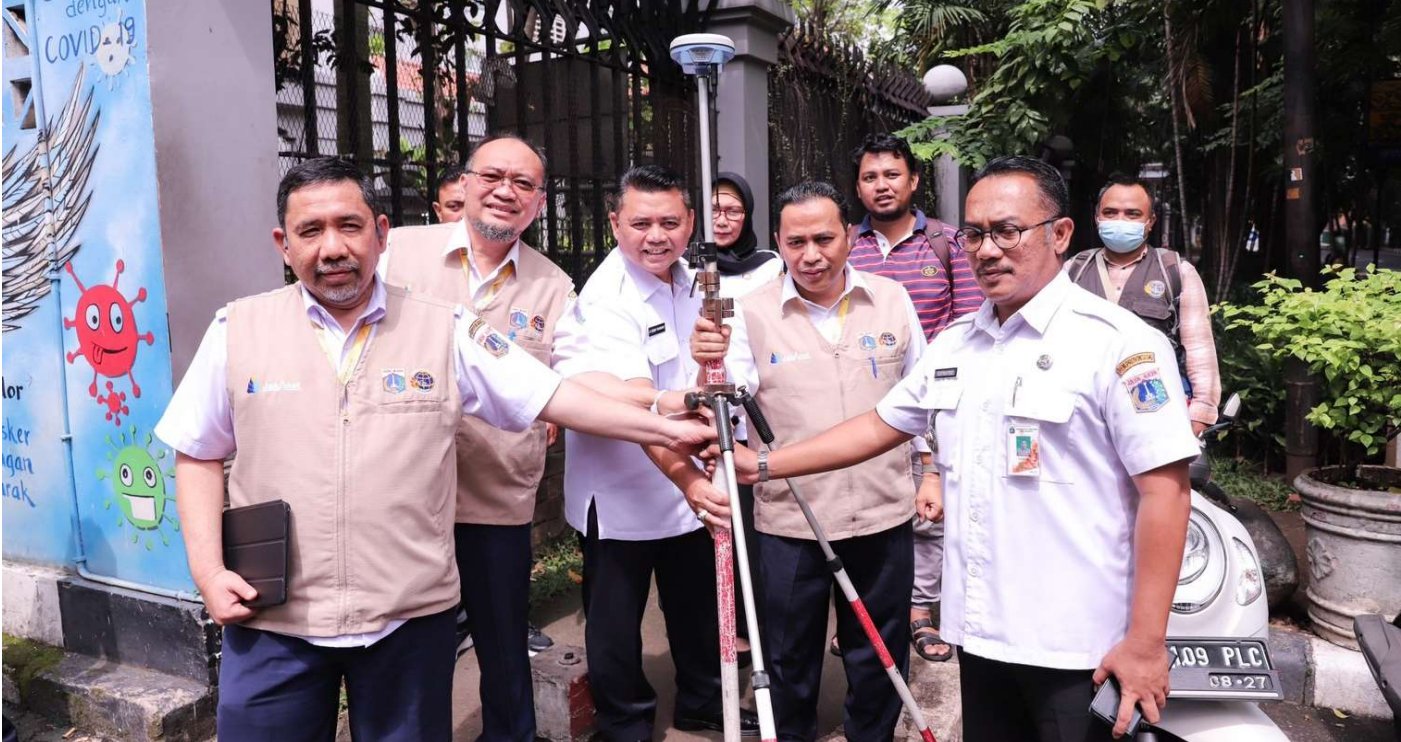
Pengukuran tanah dalam rangka pensertifikatan aset milik Pemprov DKI Jakarta.

Pemerintahan 4 Jan, 2023 Reporter: Maulana | Editor: Andreas Pamakayo