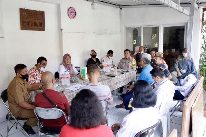
Pra Rembuk RW Kelurahan Senen.

Pemerintahan 4 Jan, 2023 Reporter: Dinar Pusung | Editor: Andreas Pamakayo