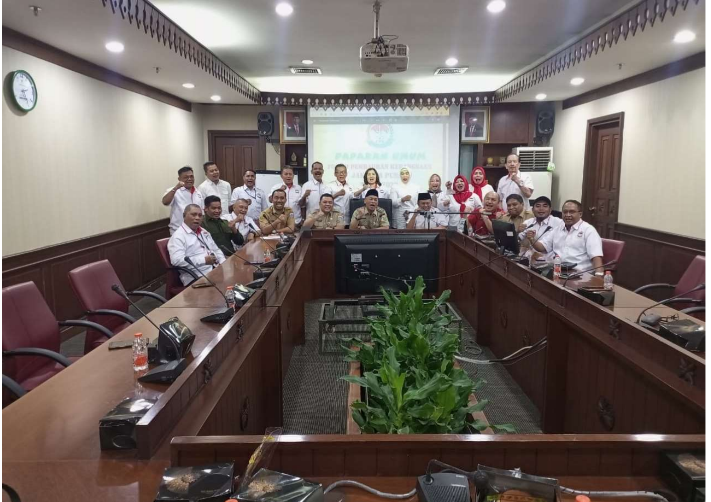
Wawali terima audiensi FPK.

Pemerintahan 4 Jul, 2023 Reporter: Andreas Pamakayo | Editor: Andreas Pamakayo