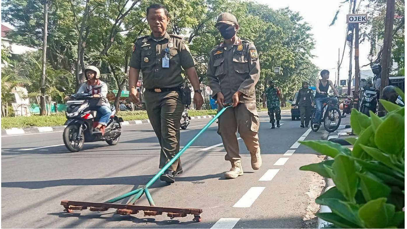
Operasi ranjau paku.

Pemerintahan 4 Jul, 2023 Reporter: Maulana | Editor: Andreas Pamakayo