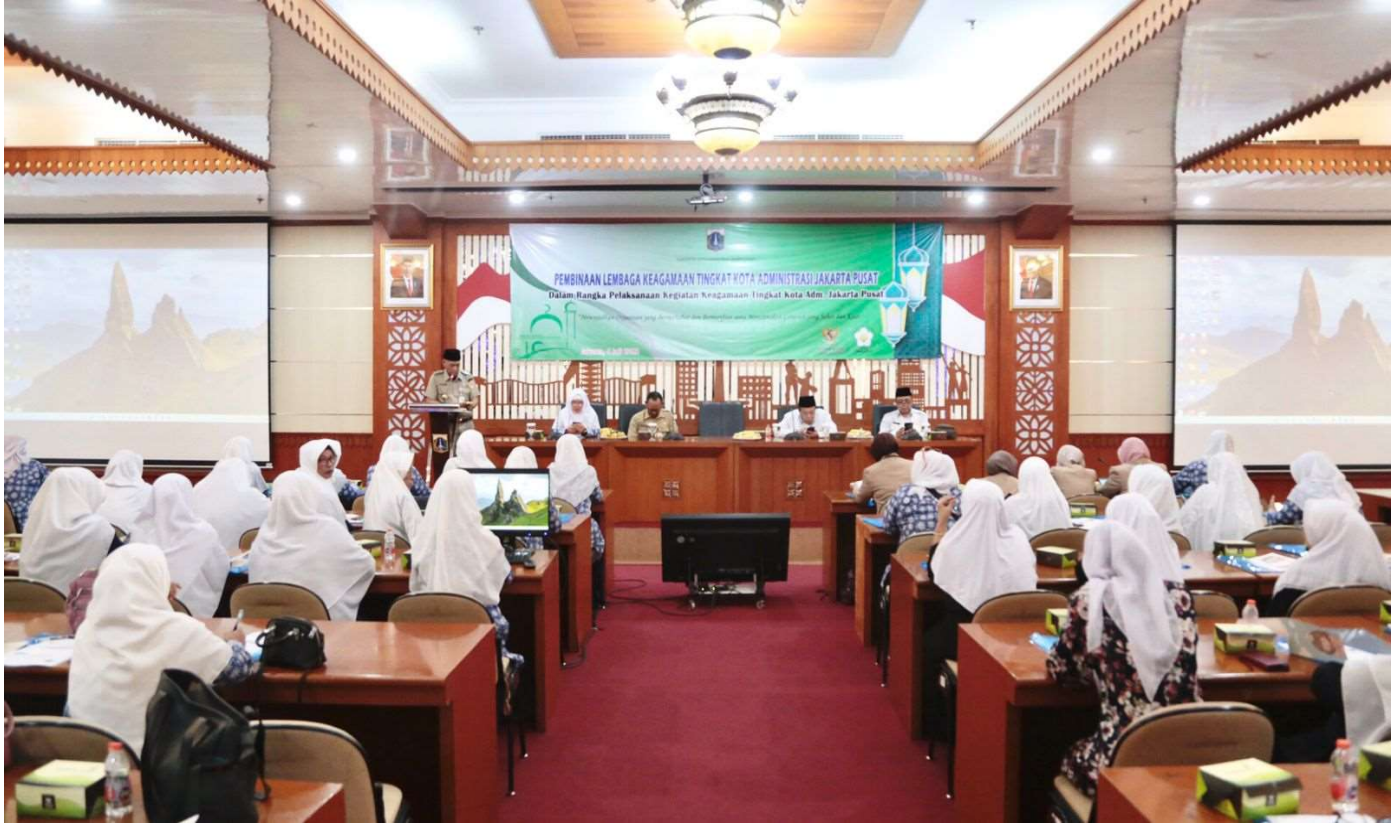
Pertemuan antara Pemkot Administrasi Jakarta Pusat dengan Forum Komunikasi Masjid Taklim (FKMT).

Kesra 4 Jul, 2023 Reporter: Iman | Editor: Andreas Pamakayo