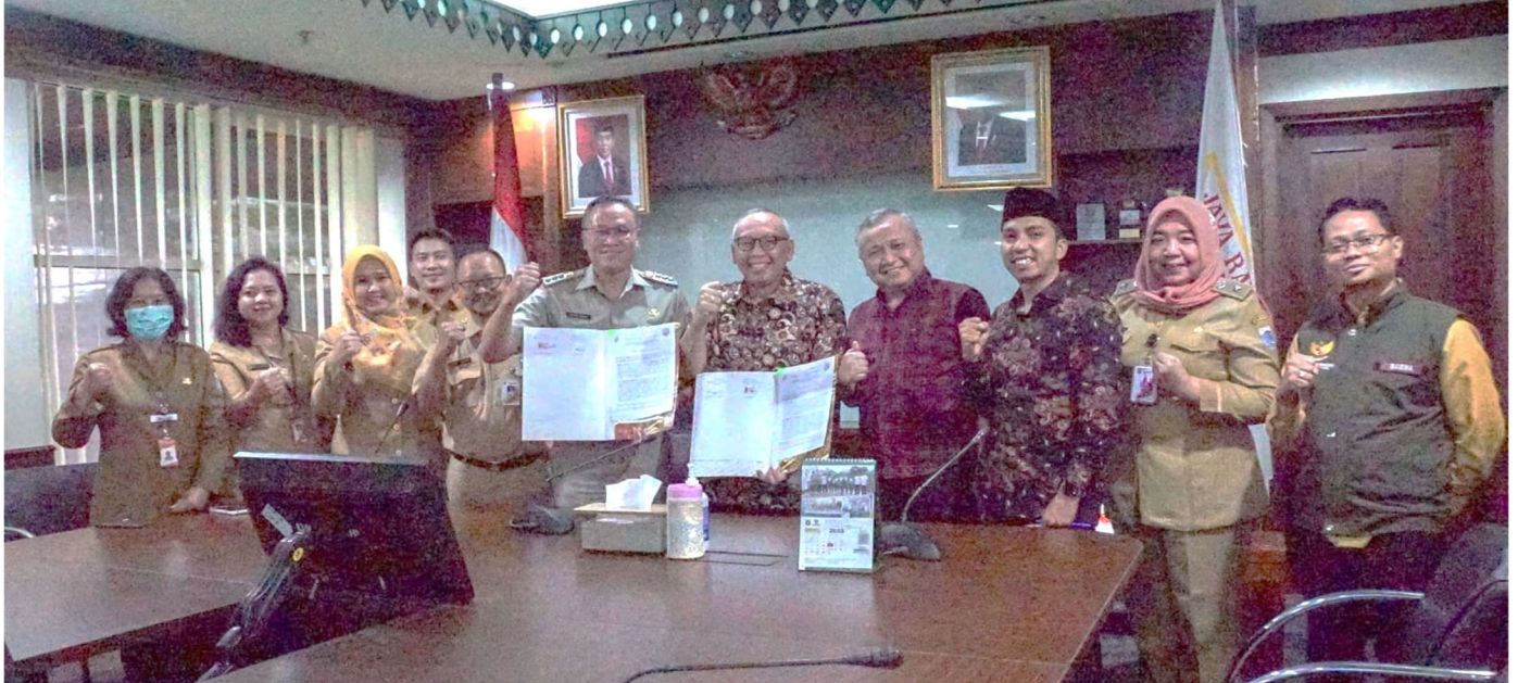
Penandatanganan Nota Kesepakatan Orang Tua Asuh Atasi Stunting.

Kesra 4 Jul, 2023 Reporter: Maulana | Editor: Andreas Pamakayo