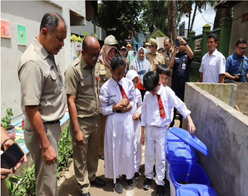
Pemkot Jakpus Laksanakan Program Sekolah Adiwiyata Tahun 2023.

Perekonomian & Pemb 6 Mar, 2023 Reporter: Farandy Purba | Editor: Iman