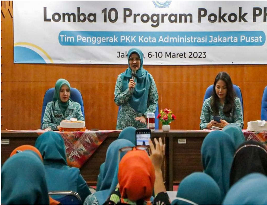
TP PKK Jakpus Gelar Lomba 10 Program Pokok PKK.

Kesra 6 Mar, 2023 Reporter: Maulana Yusuf | Editor: Iman