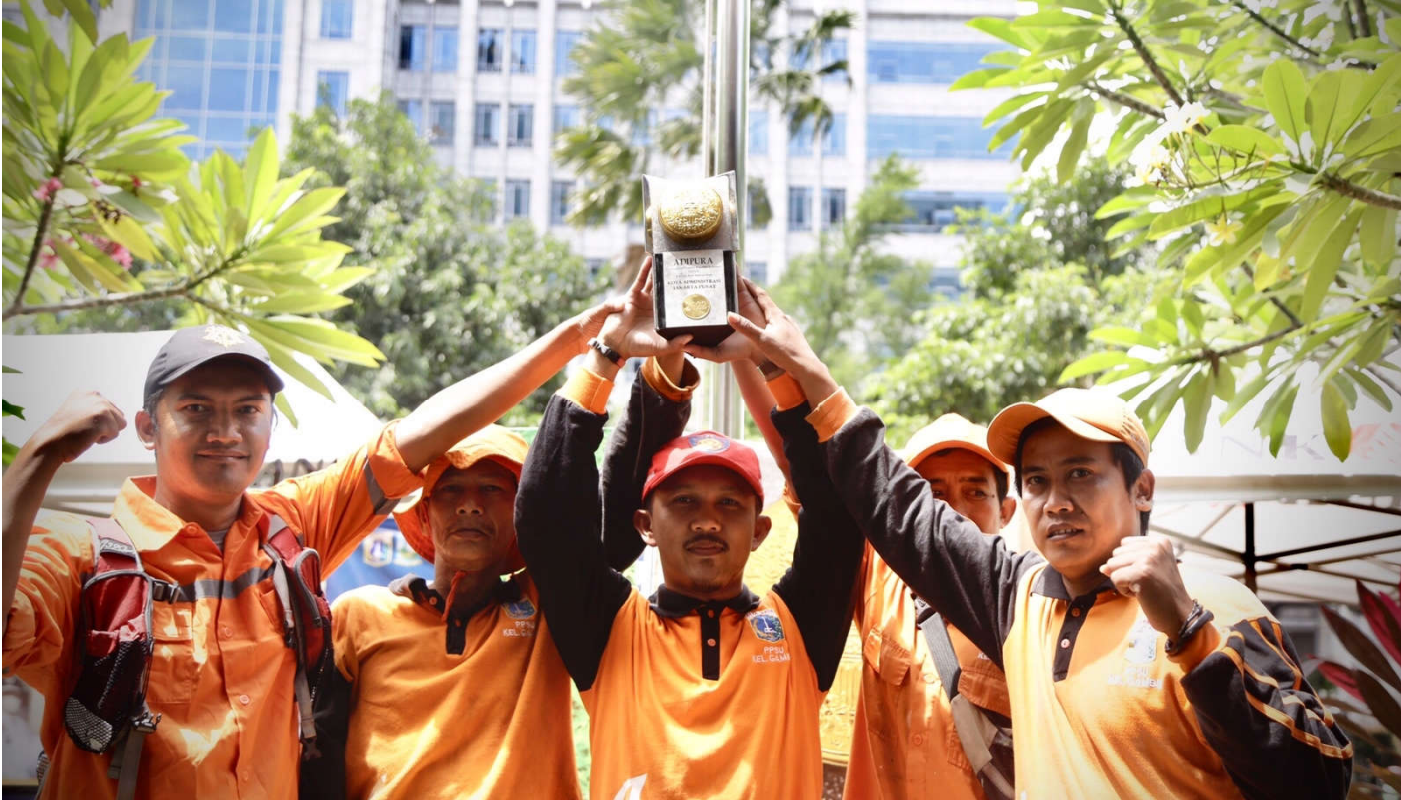
Rayakan Adipura, Kecamatan Gambir Adakan Tasyakuran.