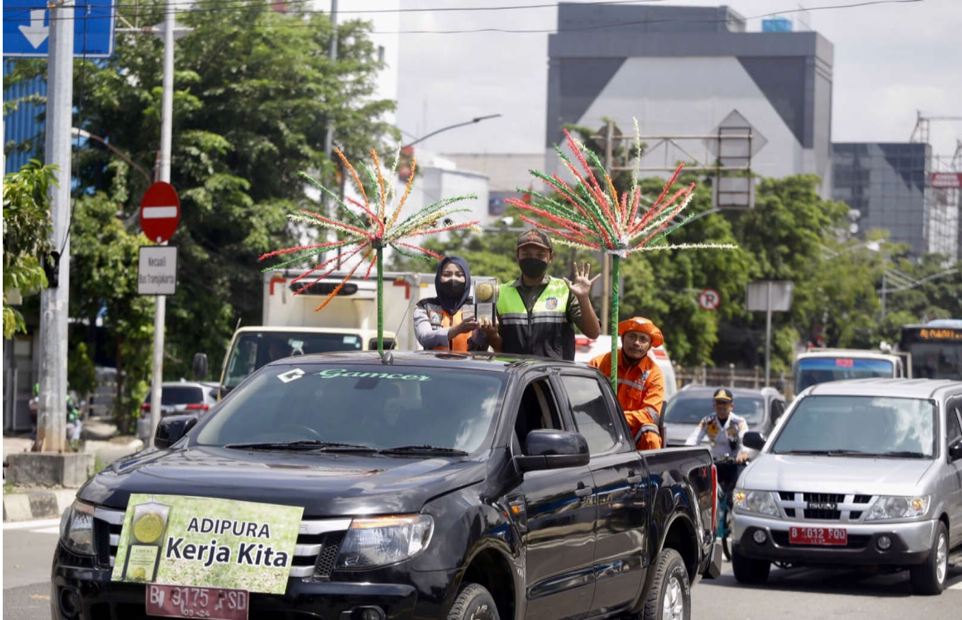
Raih Adipura, Jakarta Pusat Adakan Kirab dari Gambir.

Kesra 6 Mar, 2023 Reporter: Danar Pusung | Editor: Iman