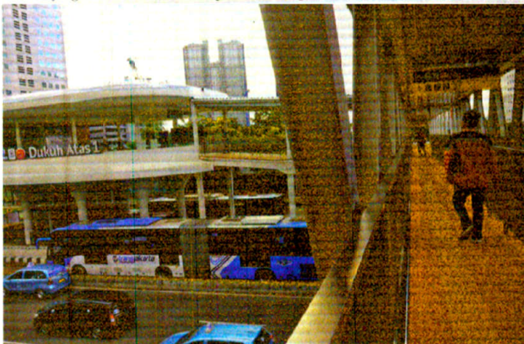
FUNGSIKAN HALTE — Halte bus Dukuh Atas Transjakarta, Jalan Sudirman, Menteng, Jakarta Pusat, Senin (6/3/2022) sudah berfungsi untuk umum walau belum selesai sepenuhnya. Seperti diketahui, untuk meningkatkan kenyamanan penumpang Transjakarta

Apri menginformasikan setidaknya terdapat 12 rute yang dilakukan penyesuaian, 1 rute ditutup, dan 2 rute yang tidak berubah.