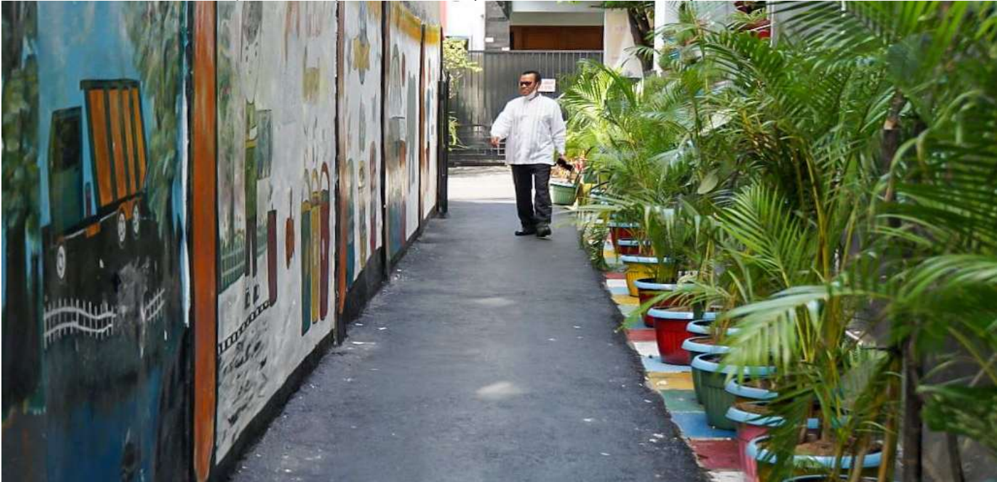
Asri dan hijau, hasil penataan Gang Wijaya Kesuma, RT 10 RW 05.

Perekonomian & Pemb 6 Apr, 2023 Reporter: Maulana | Editor: Andreas Pamakayo