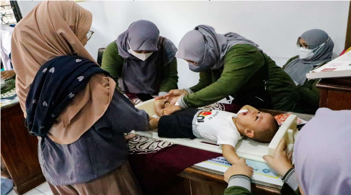
Posyandu balita di Pos RW 08, Kecamatan Cempaka Putih, Jakarta Pusat, Kamis (6/4).

Kesra 6 Apr, 2023 Reporter: Malik Maulana | Editor: Andreas Pamakayo