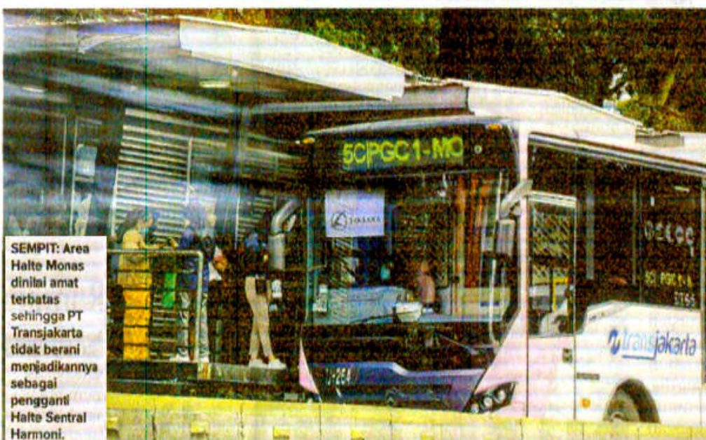
SEMPIT: Area Halte Monas dinilai amat terbatas sehingga PT Transjakarta tidak berani menjadikannya sebagai pengganti Halte Sentral Harmoni.

Syafrin menjelaskan, Halte Monas sebagai pengganti Halte Sentral Harmoni baru bisa tersedia paling cepat tahun depan. Menurut dia, Halte Monas sudah lama direncanakan untuk menjadi sentral sementara pengganti Harmoni. (rya/col/byu)