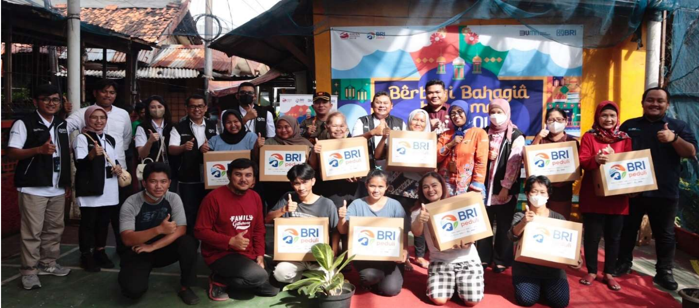
Pemberian bantuan sembako dari CSR.

Kesra 6 Apr, 2023 Reporter: Zaki Ahmad Thohir | Editor: Andreas Pamakayo