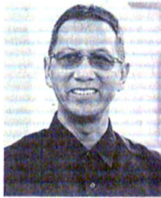
Heru Budi Hartono