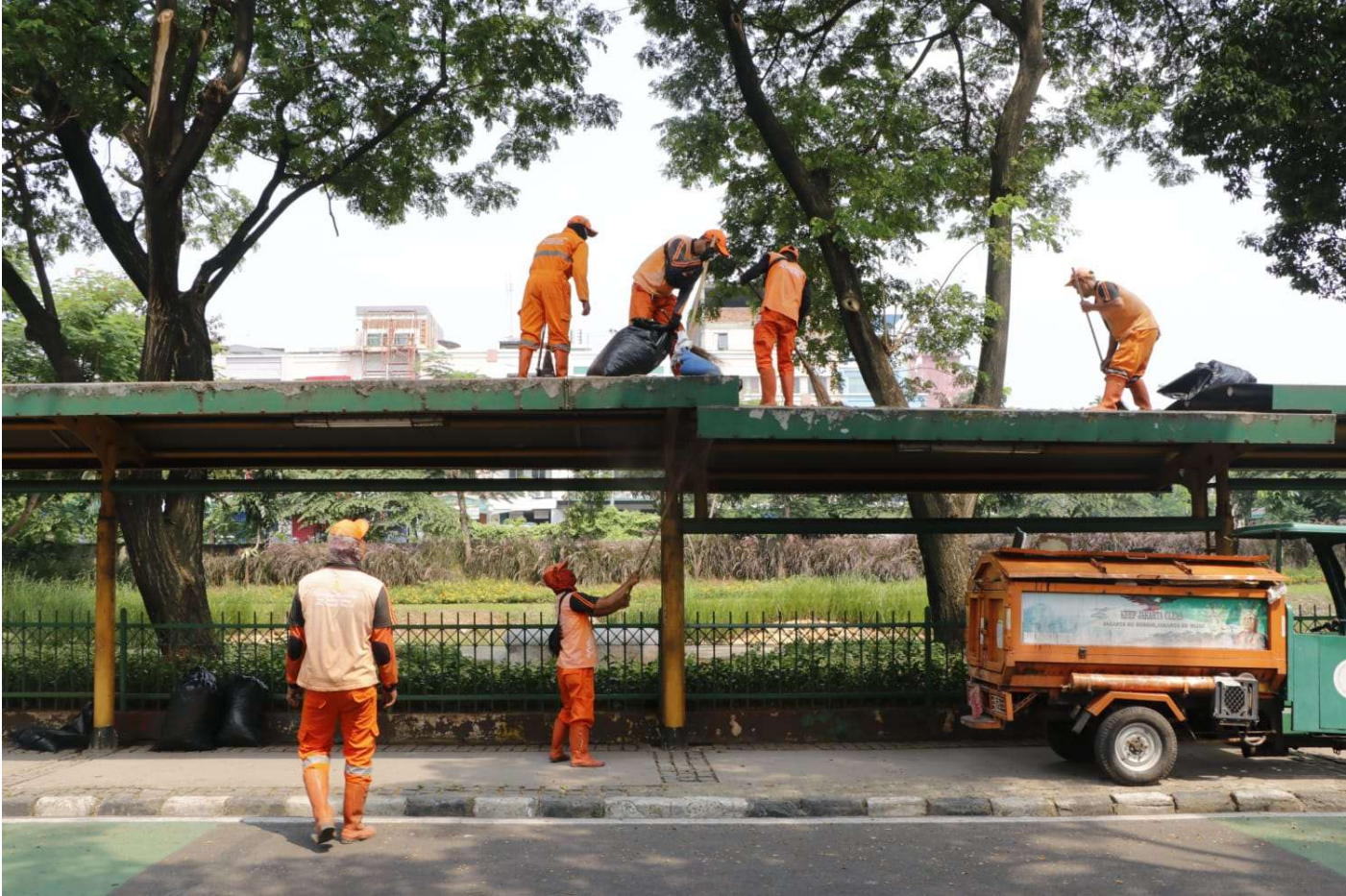
PPSU membersihkan Halte Cempaka Mas.