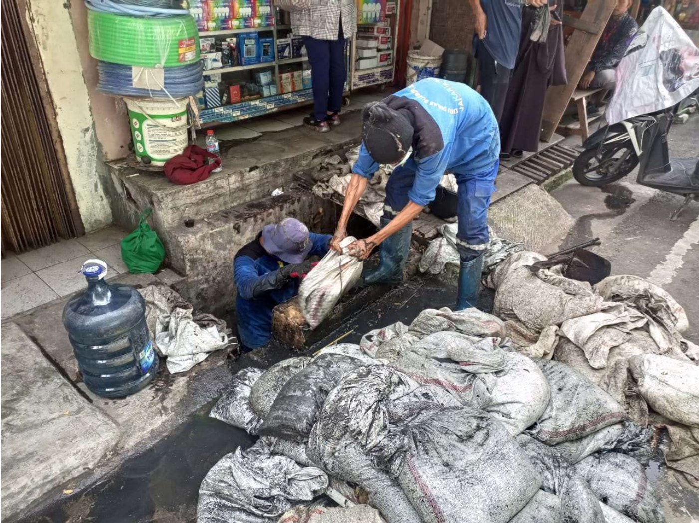
Petugas SDA Kecamatan Gambir menguras saluran di Jalan Kebon Jahe Kober V.

Perekonomian & Pemb 12 Jan, 2023 Reporter: Andreas Pamakayo | Editor: Andreas Pamakayo