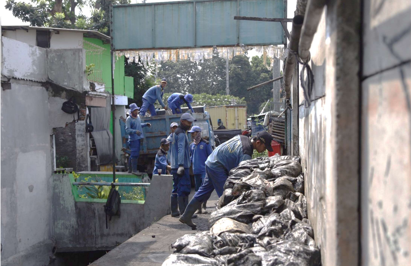
Pengurasan saluran PHB Jalan Rajawali Selatan 1.

Perekonomian & Pemb 12 Jan, 2023 Reporter: Danar Pusung | Editor: Andreas Pamakayo