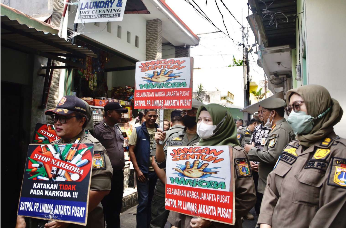
Satpol PP Kota Administrasi Jakarta Pusat melakukan sosialisasi bahaya narkoba di RW 01 Kelurahan Karang Anyar.

Pemerintahan 12 Jan, 2023 Reporter: Zaki Ahmad Thohir | Editor: Andreas Pamakayo