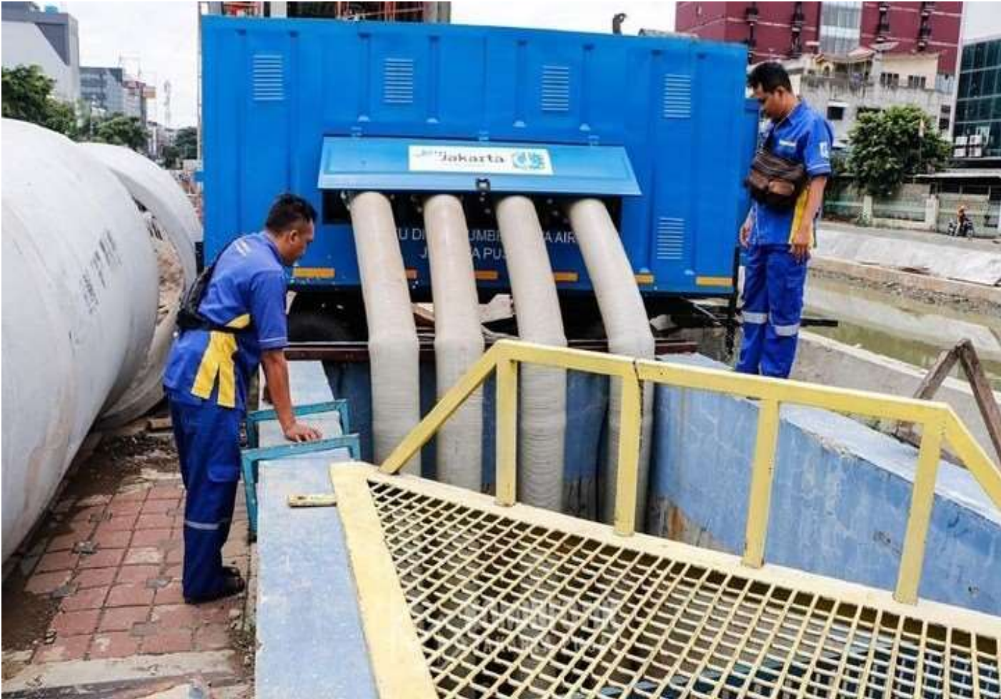
Ilustrasi.