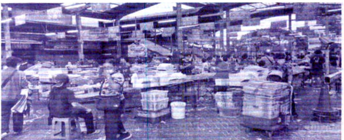
JAJAKAN KUE — Pedagang kue tampak menjajakan dagangannya di Pasar Kue Subuh Senen Jaya, Blok 5, Jakarta Pusat, pada Kamis (12/1/2023). Rencananya seluruh pedagang tersebut akan direlokasi 10 Februari 2023.

Warta Kota - Pemerintahan - Dinas Perindustrian, Perdagangan, Koperasi dan Usaha kecil Menengah - Provinsi DKI Jakarta - Pasar Kue Subuh - 13 Januari 2023 -