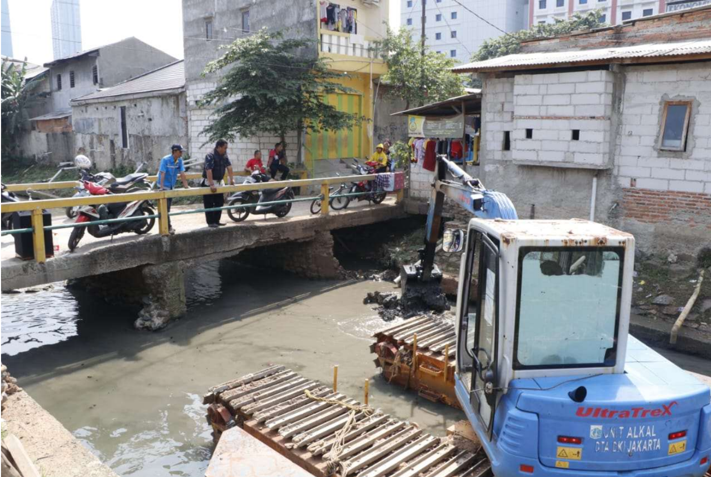
Pengerukan Kali Utan Kayu.