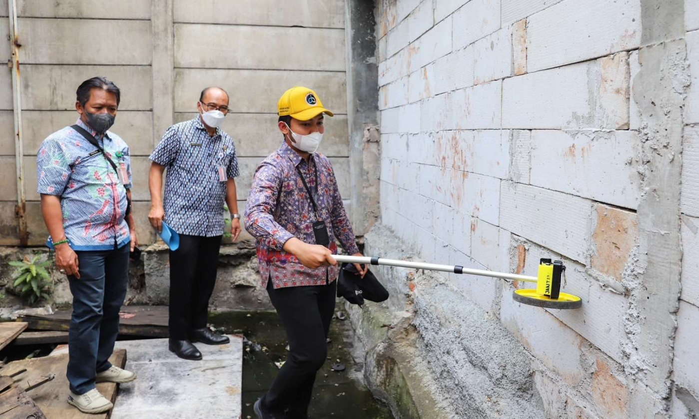
Peninjauan fisik kewajiban fasos fasum di Dipo Tower.