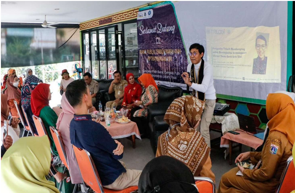
Pelatihan mendongeng.

Kesra 12 Jun, 2023 Reporter: Farandy Purba | Editor: Andreas Pamakayo