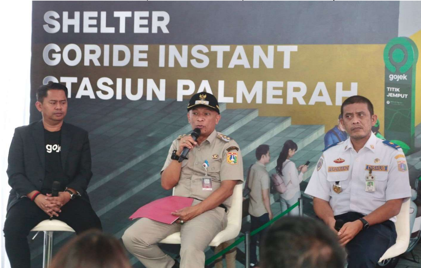
Peresmian shelter atau area pengendapan untuk para mitra ojek online (ojol).

Perekonomian & Pemb 12 Jun, 2023 Reporter: Zaki Ahmad Thohir | Editor: Andreas Pamakayo