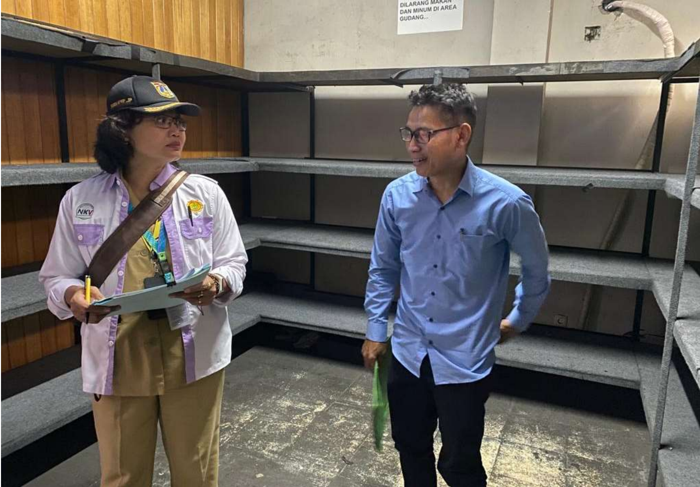
Sudin KPKP mengaudit permohonan NKV.

Perekonomian & Pemb 12 Jun, 2023 Reporter: Danar Pusung | Editor: Andreas Pamakayo