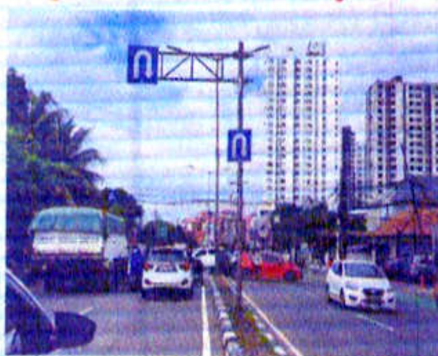
Putaran balik pejompongan.

Menanggapi rencana Dinas Perhubungan (Dis-hun) DKI itu, warga Bendungan Hilir berharap bahwa