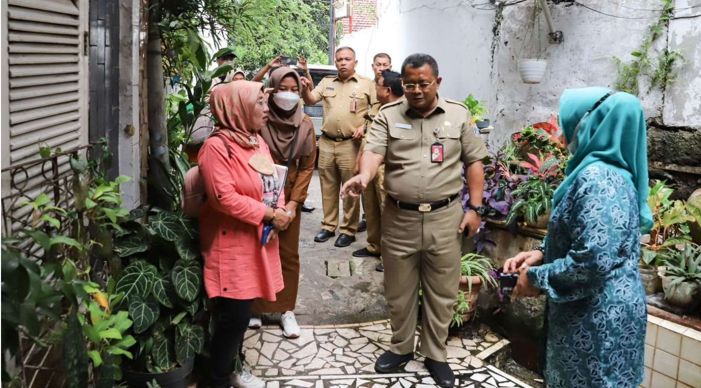
Peninjauan Proklim di wilayah Kelurahan Pasar Baru.

Perekonomian & Pemb 14 Feb, 2023 Reporter: Malik Maulana | Editor: Andreas Pamakayo