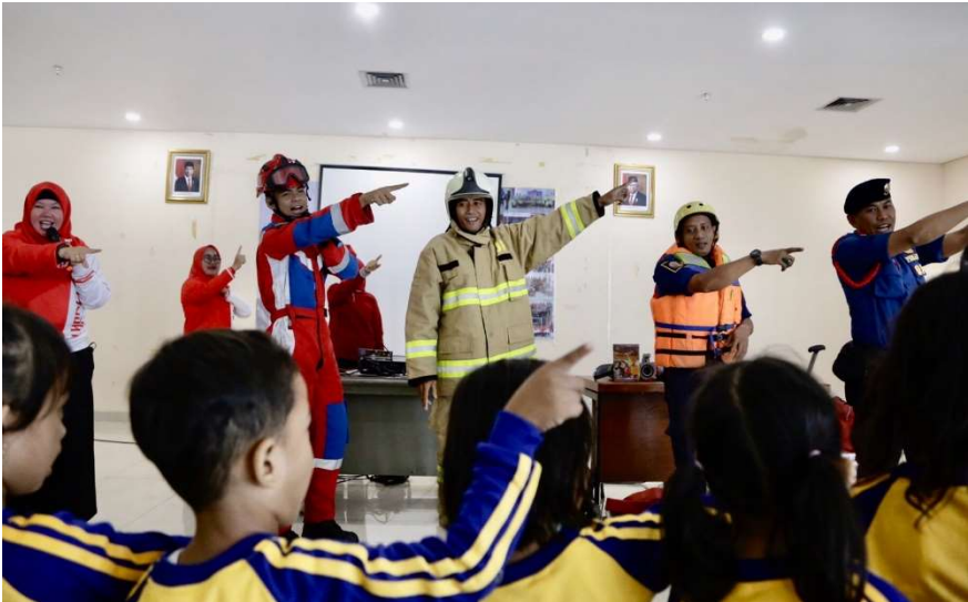
Pengenalan pekerjaan petugas Sudin Gulkarmat.

Kesra 14 Feb, 2023 Reporter: Zaki Ahmad Thohir | Editor: Andreas Pamakayo