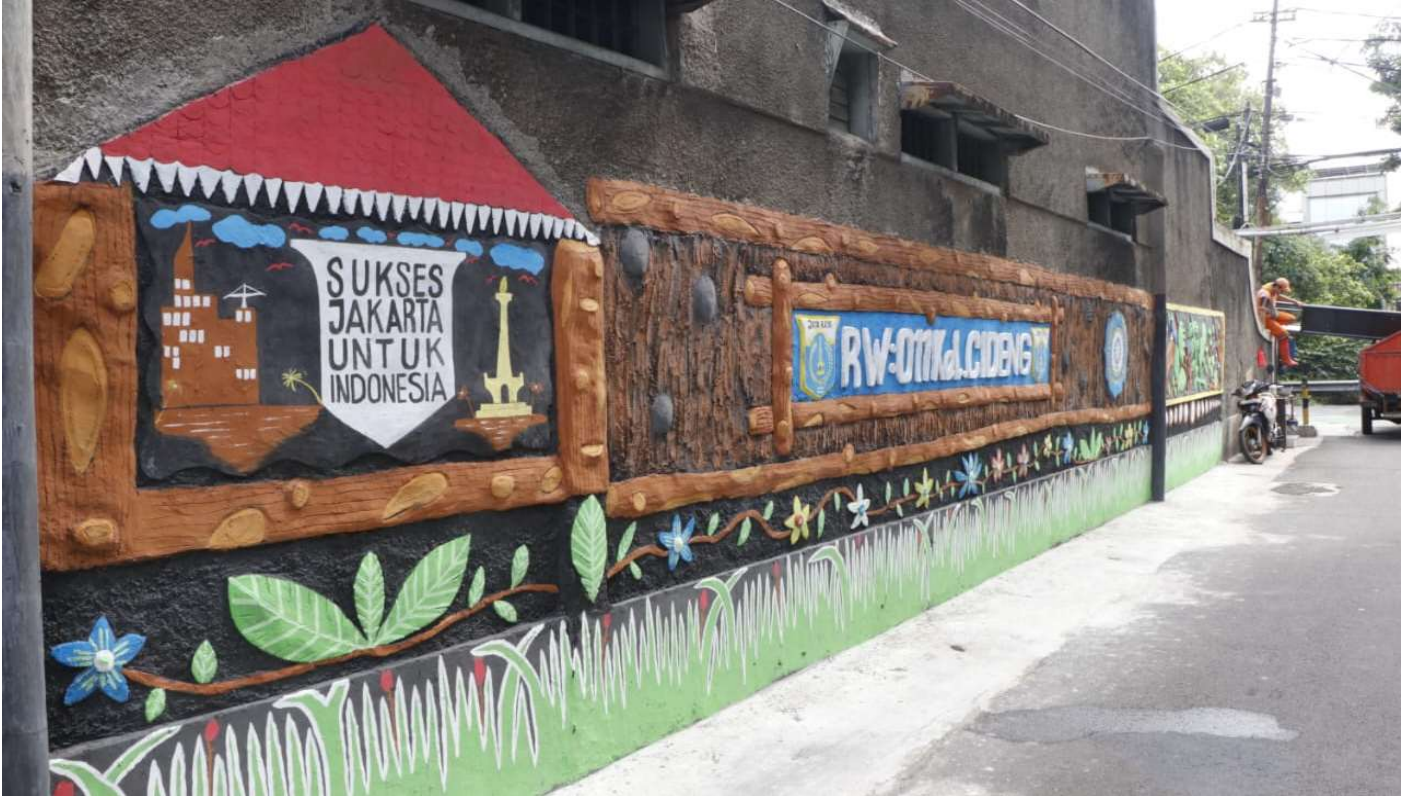
Penataan kawasan unggulan.

Perekonomian & Pemb 14 Feb, 2023 Reporter: Maulana | Editor: Andreas Pamakayo