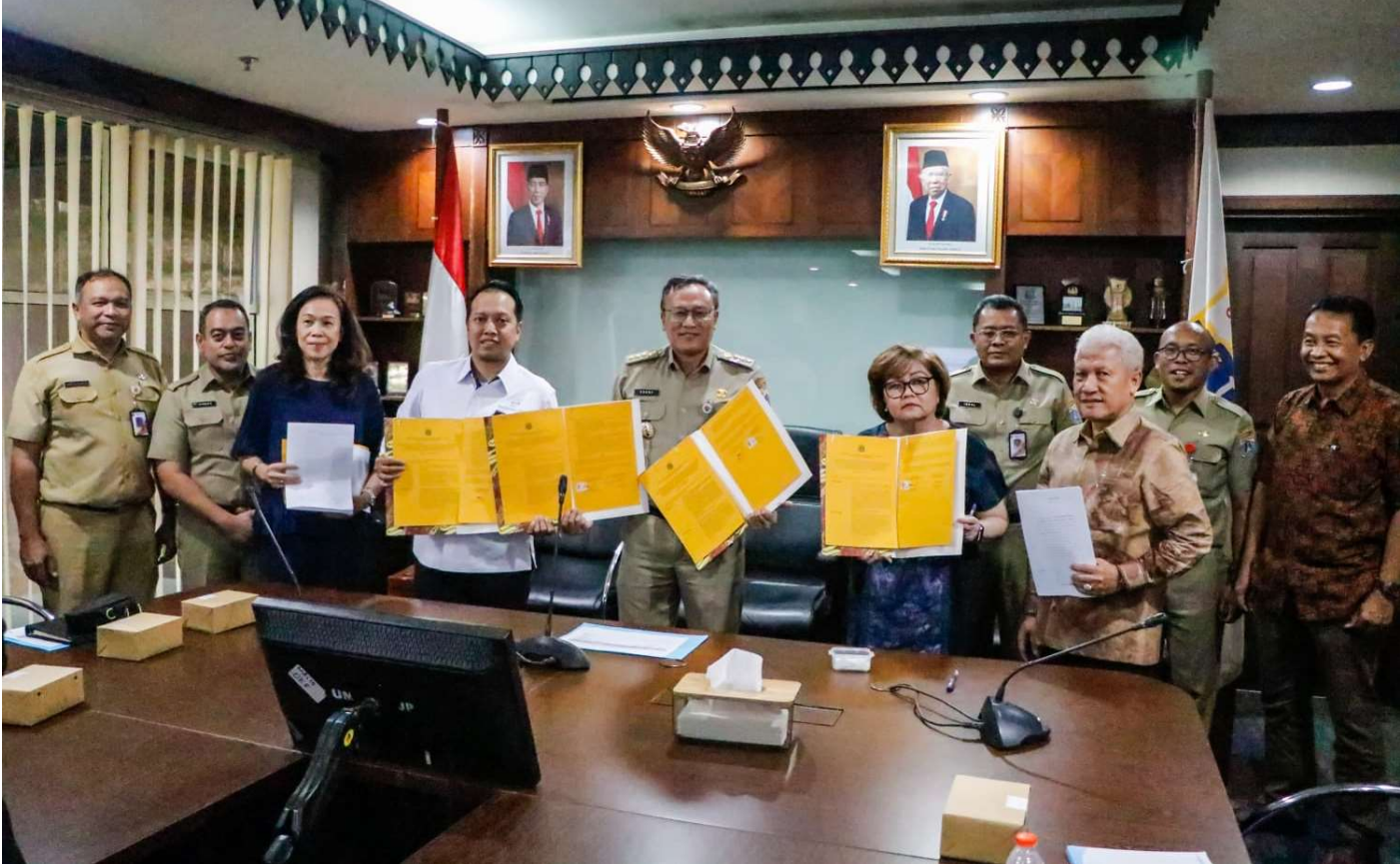
Penandatanganan BAST.

Perekonomian & Pemb 15 Aug, 2023 Reporter: Maulana | Editor: Andreas Pamakayo