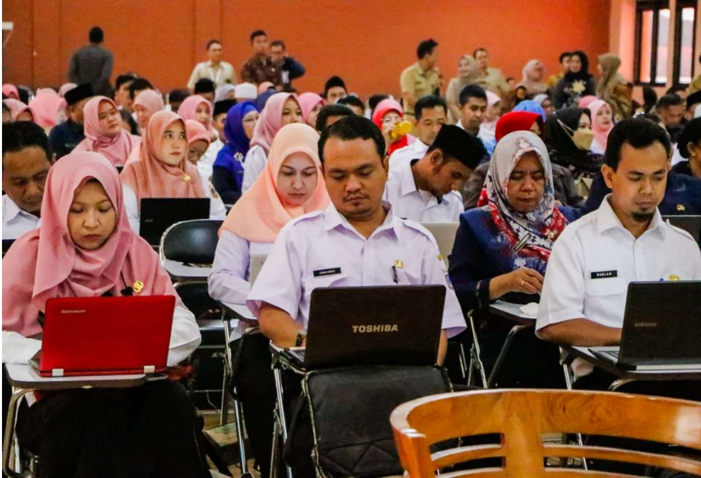
Sosialisasi penilaian kerja P3K Pendidik.

Kesra 15 Aug, 2023 Reporter: Muhamad Aulia | Editor: Andreas Pamakayo