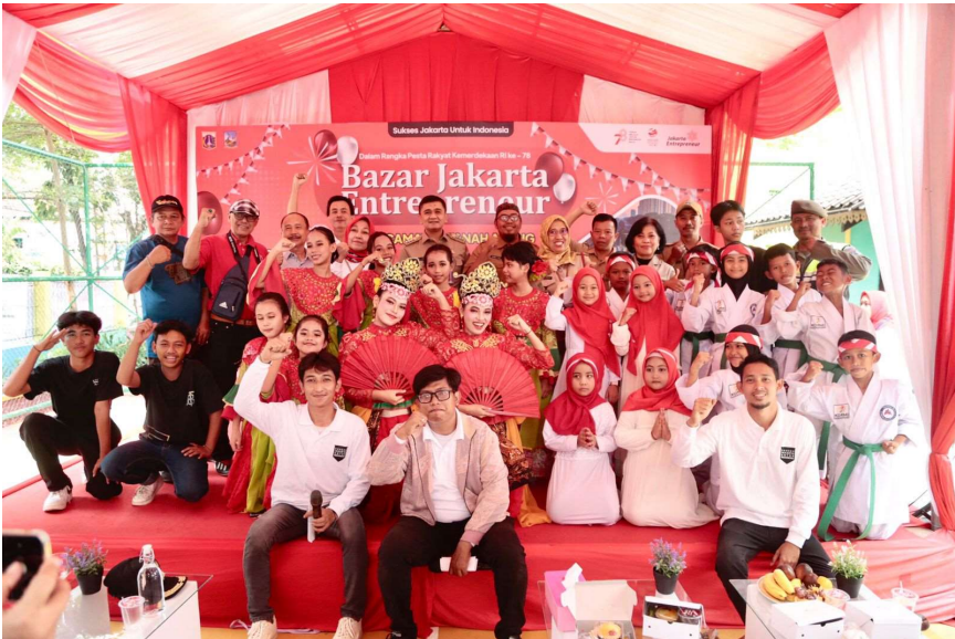
Bazar Jakarta Entrepreneur dan juga pentas seni Kelurahan Kampung Bali.

Perekonomian & Pemb 15 Aug, 2023 Reporter: Zaki Ahmad Thohir | Editor: Andreas Pamakayo