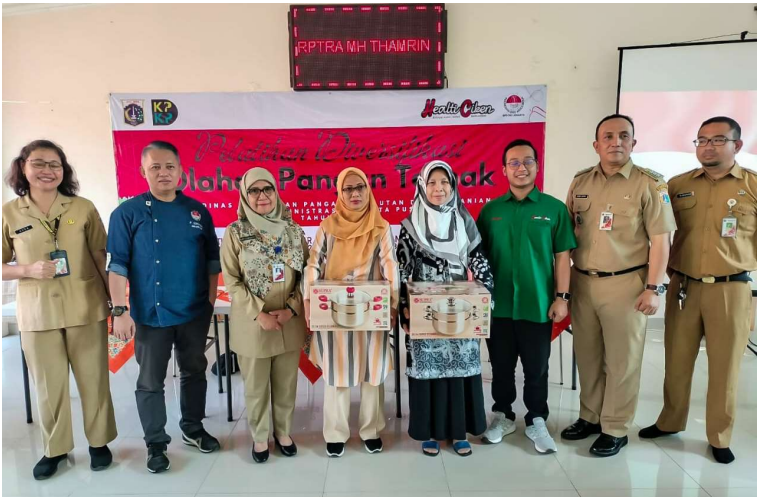
Pemberian bantuan pelatihan berupa panci dua susun kepada peserta.

Perekonomian & Pemb 15 Aug, 2023 Reporter: Angga Rizkyanda | Editor: Andreas Pamakayo