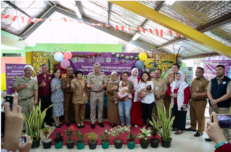
Pencanangan vaksin rotavirus di RPTRA Gondangdia.

Kesra 15 Aug, 2023 Reporter: Rio Cornelianto | Editor: Andreas Pamakayo