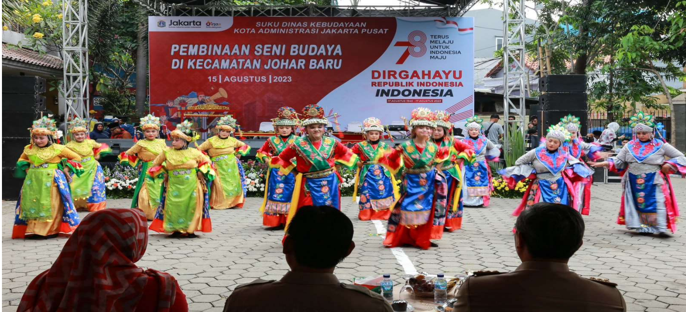
Warga Johar Baru menggelar pertunjukan seni budaya.

Kesra 15 Aug, 2023 Reporter: Malik Maulana | Editor: Andreas Pamakayo