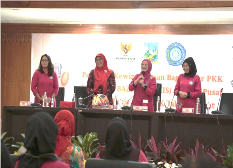
TP PKK bersama Baznas Bazis melaksanakan kegiatan pelatihan kewirausahaan.

Kesra 16 Mar, 2023 Reporter: Zaki Ahmad Thohir | Editor: Andreas Pamakayo