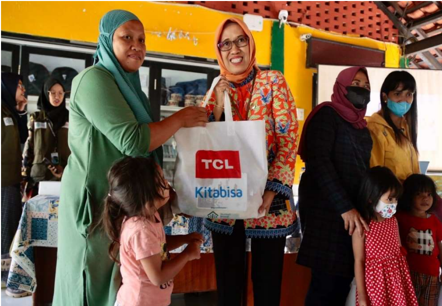
Pemberian makanan tambahan bergizi bagi balita di wilayah Kelurahan Kampung Bali.

Kesra 16 Mar, 2023 Reporter: Andreas Pamakayo | Editor: Andreas Pamakayo