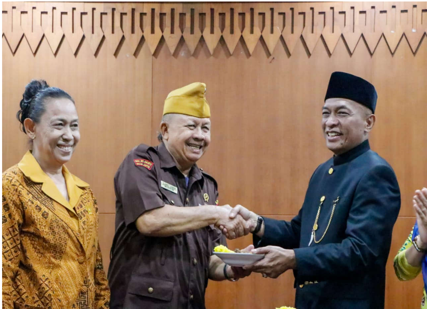
Tasyakuran HUT Kemerdekaan RI bersama veteran.