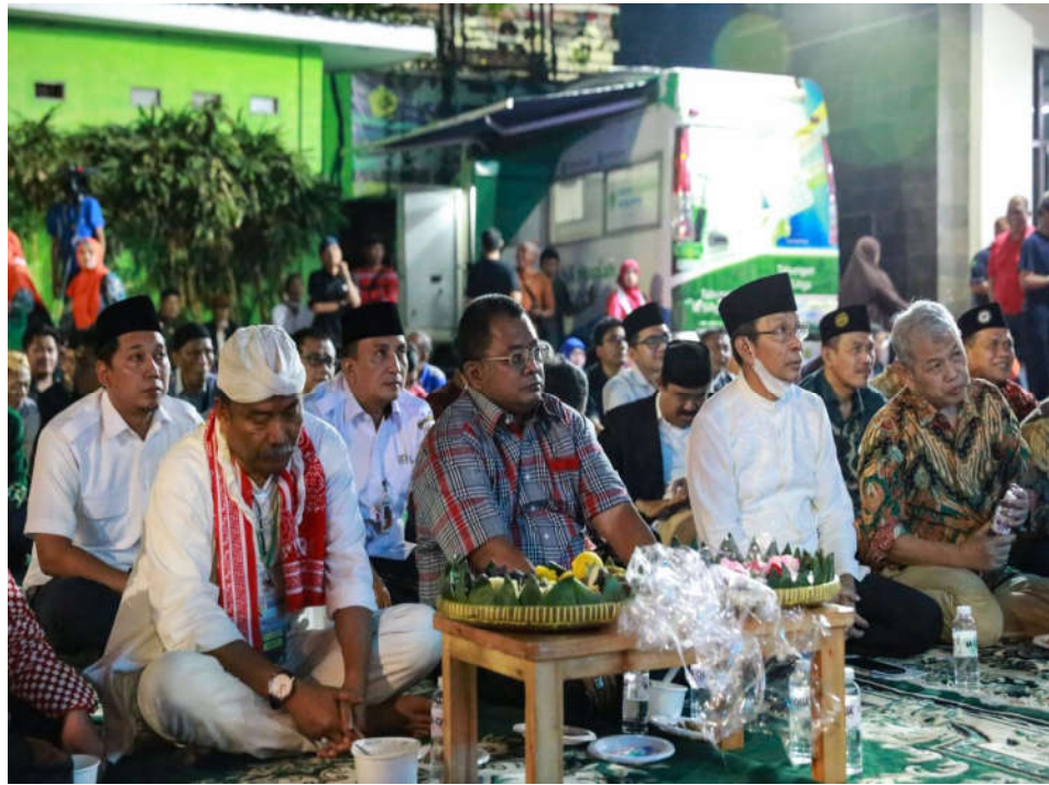
Sekko Hadiri Malam Refleksi Kemerdekaan di Gedung Dakwah Muhammadiyah DKI Jakarta, Foto: Malik

Kesra 16 Aug, 2023 Reporter: Malik | Editor: Iman