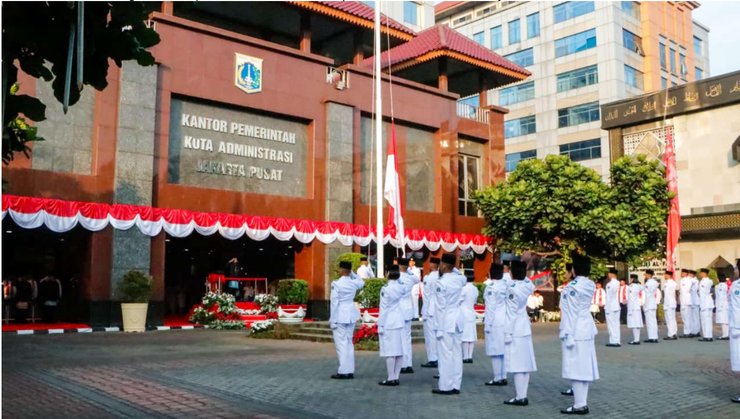
Upacara HUT Kemerdekaan Republik Indonesia.

Pemerintahan 17 Aug, 2023 Reporter: Muhamad Aulia | Editor: Andreas Pamakayo