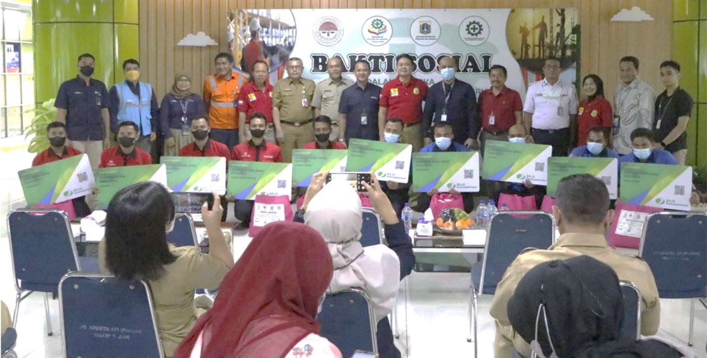
Bakti sosial bulan Keselamatan dan Kesehatan Kerja (K3) Provinsi DKI Jakarta Tahun 2023.