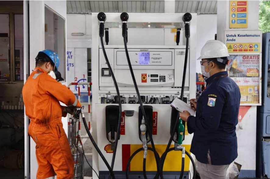
UP Metrologi Dinas PPKUKM Provinsi DKI Jakarta melakukan pengujian tera terhadap SPBU Shell.

Perekonomian & Pemb 21 Feb, 2023 Reporter: Farandy Purba | Editor: Andreas Pamakayo