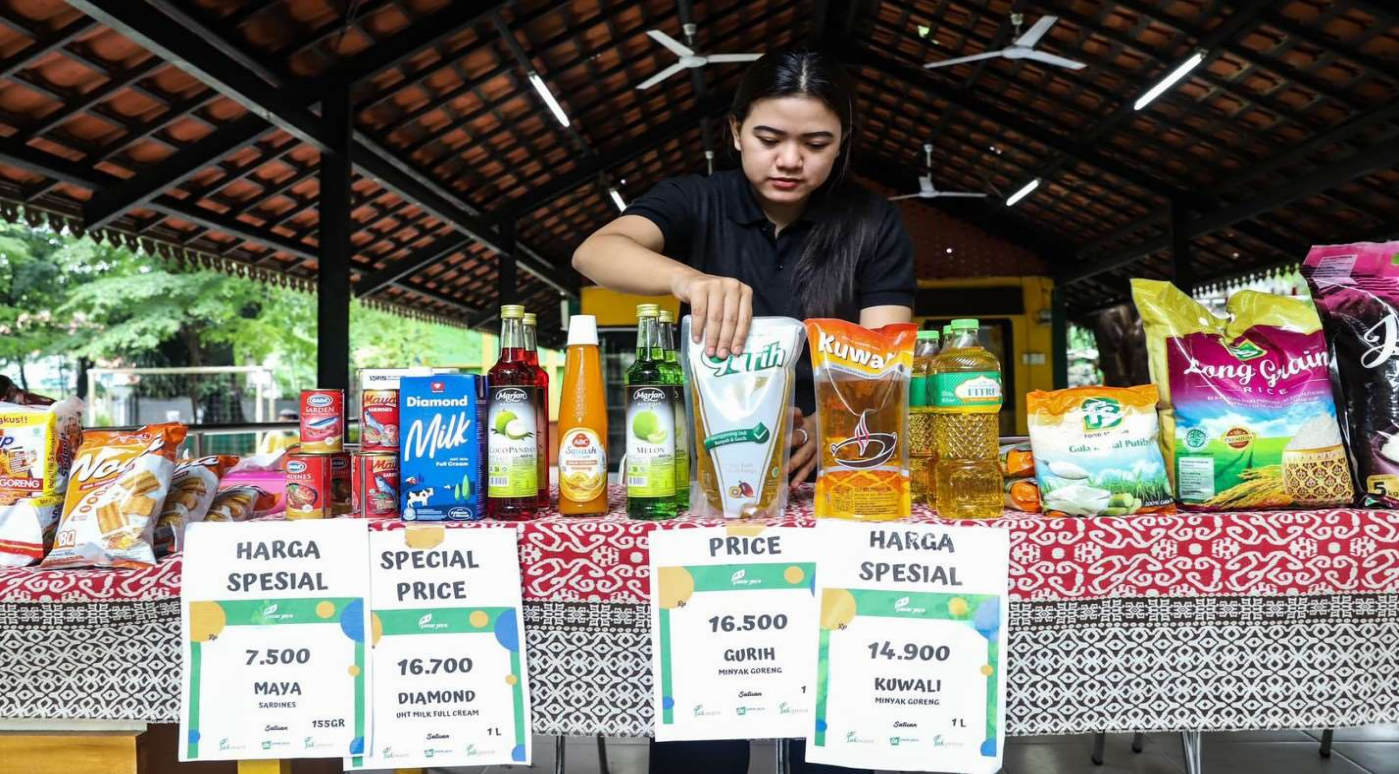
Perumda Pasar Jaya menggelar bazar pangan murah di RPTRA Hati Suci.