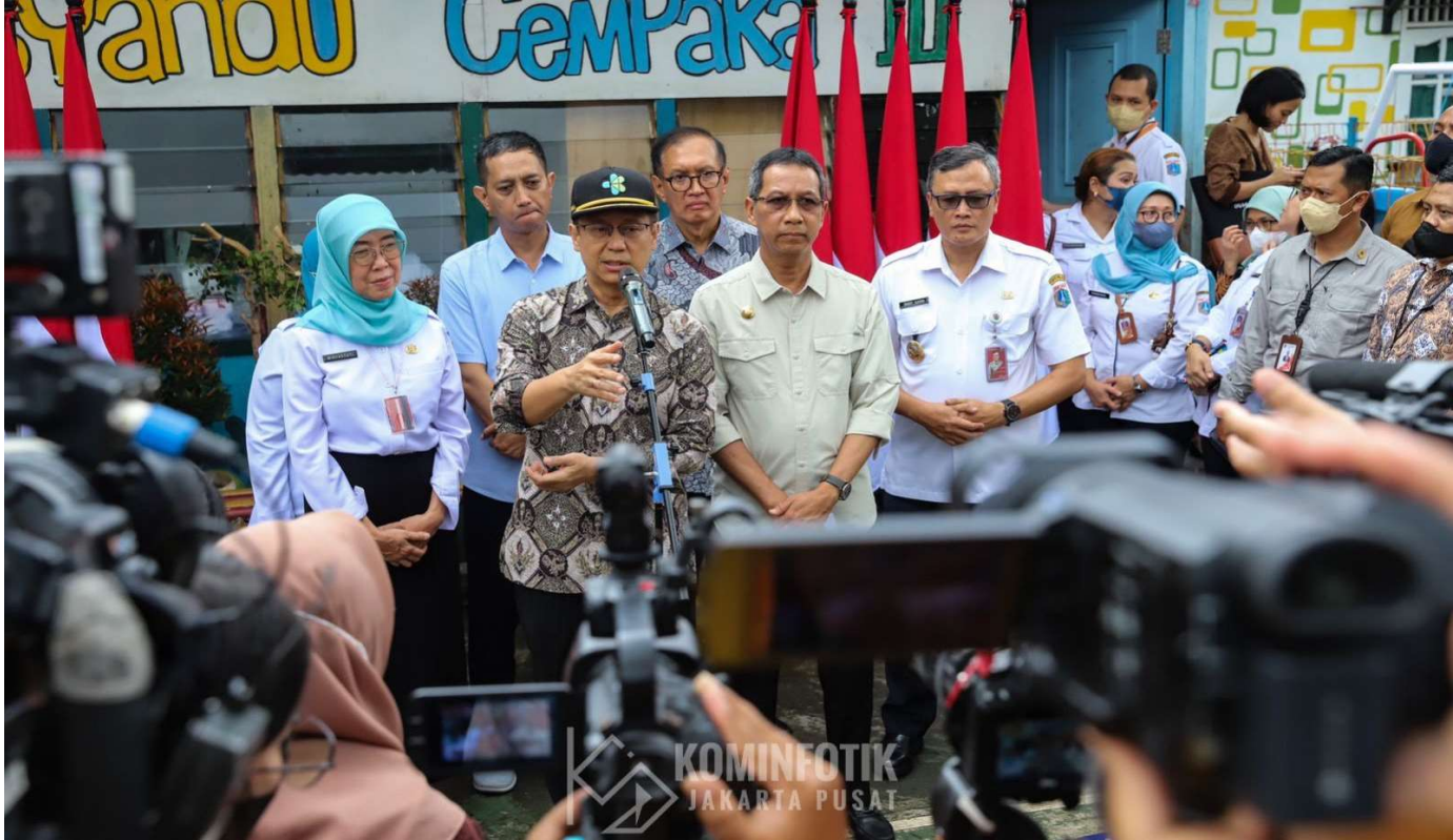
Menkes dan Pj Gubernur DKI Jakarta mengunjungi Posyandu Cempaka III.

Kesra 22 Feb, 2023 Reporter: Andreas Pamakayo | Editor: Andreas Pamakayo