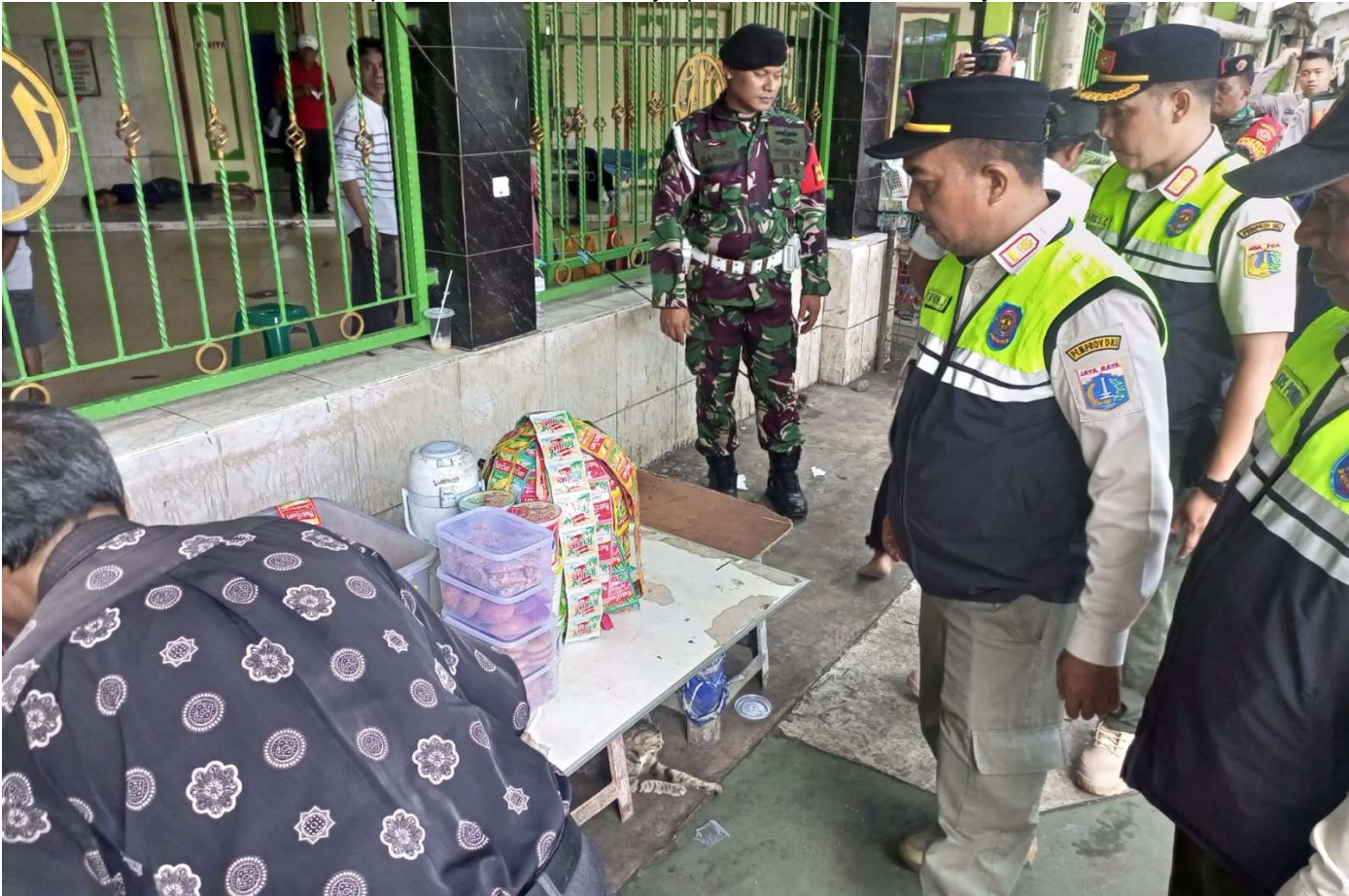
Satpol PP Kota Administrasi Jakarta Pusat melakukan penghalauan pedagang yang berjualan di atas trotoar sekitar Pasar Senen.

Pemerintahan 22 Feb, 2023 Reporter: Andreas Pamakayo | Editor: Andreas Pamakayo