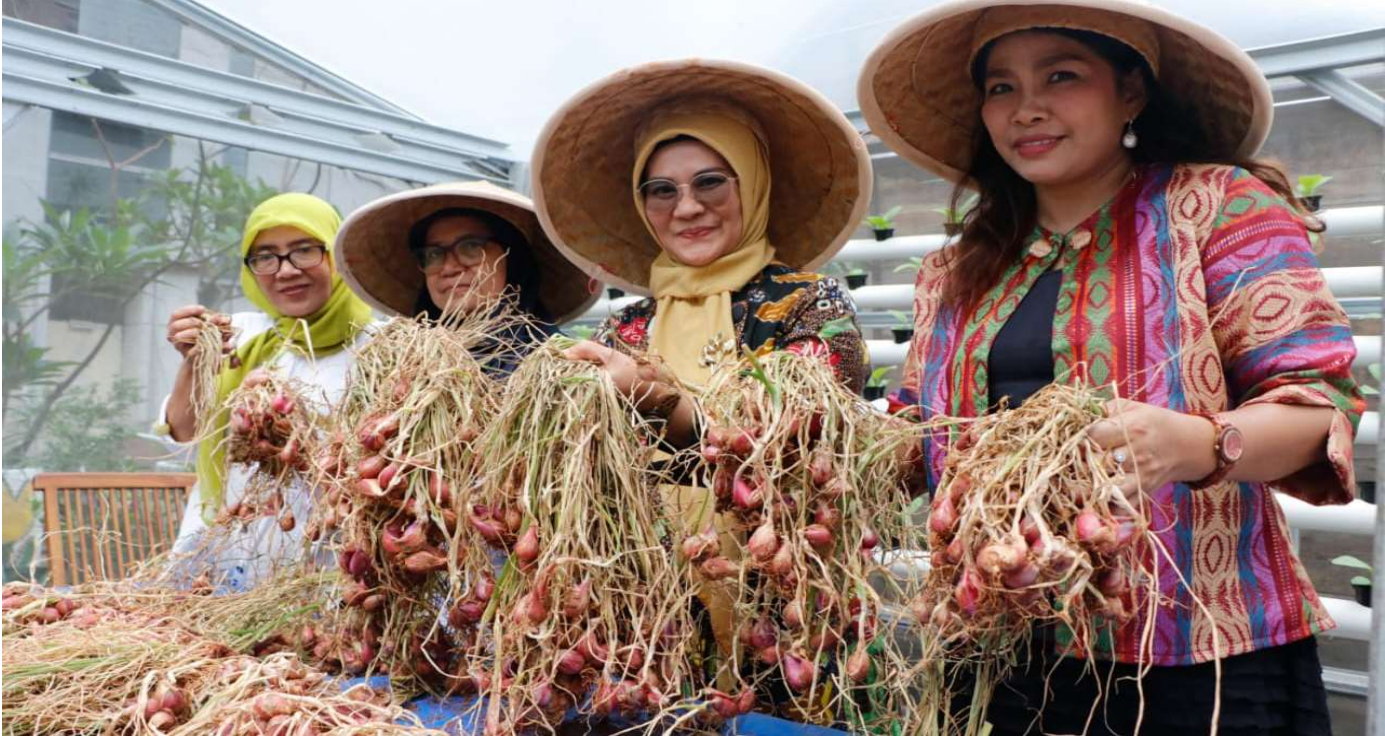
Panen bawang merah di rooftop Kantor Wali Kota Jakarta Pusat.

Perekonomian & Pemb 22 Feb, 2023 Reporter: Danar Pusung | Editor: Andreas Pamakayo