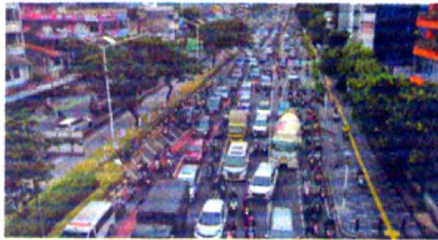
Kendaraan berjalan perlahan saat macet di Jalan Kramat Raya, Jakarta Pusat.