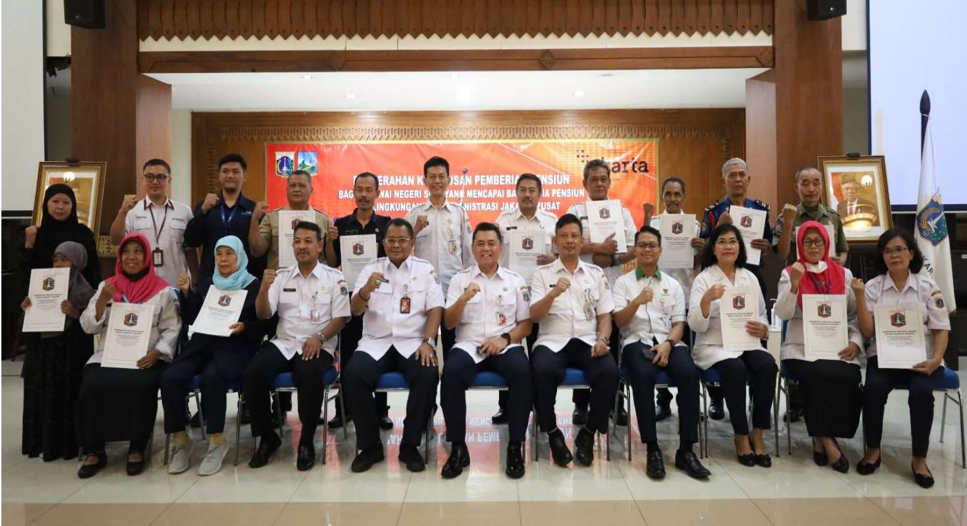
Para penerima SK Pensiun berswafoto bersama Sekko dan jajaran terkait lainnya.

Pemerintahan 22 Feb, 2023 Reporter: Andreas Pamakayo | Editor: Andreas Pamakayo