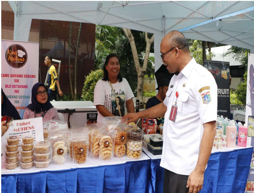
Bazar UMKM, fashion show, dan ekonomi kreatif.

Perekonomian & Pemb 22 Feb, 2023 Reporter: Danar Pusung | Editor: Andreas Pamakayo