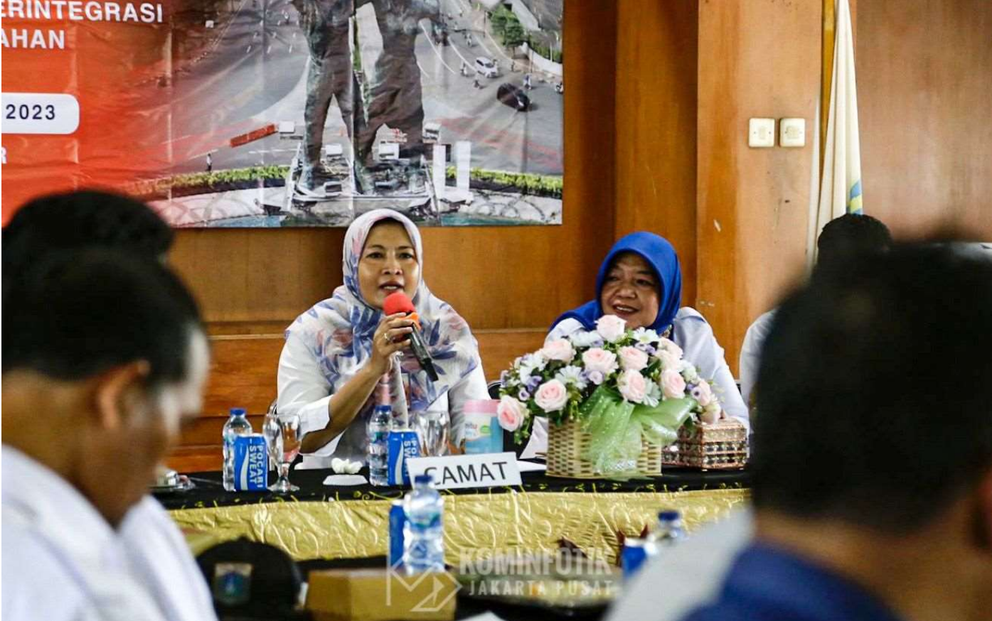
Sidang kelompok musrenbang Kelurahan Galur.

Pemerintahan 22 Feb, 2023 Reporter: Zaki Ahmad Thohir | Editor: Andreas Pamakayo