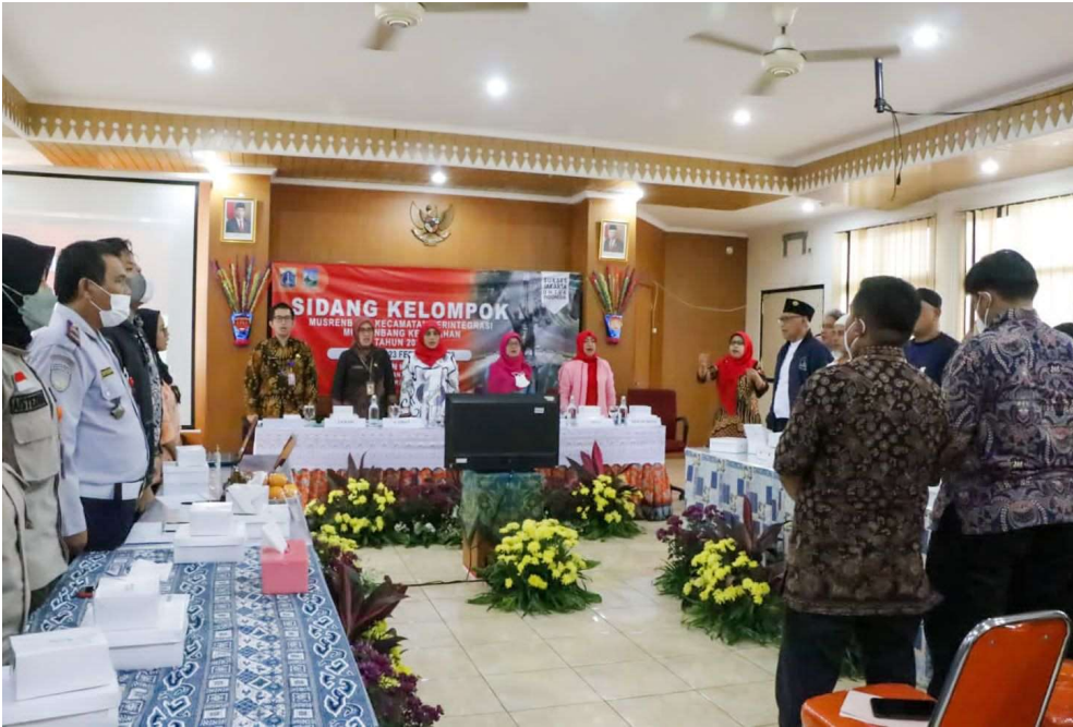
Sidang kelompok musrenbang Kelurahan Kampung Bali.

Pemerintahan 23 Feb, 2023 Reporter: Maulana | Editor: Andreas Pamakayo