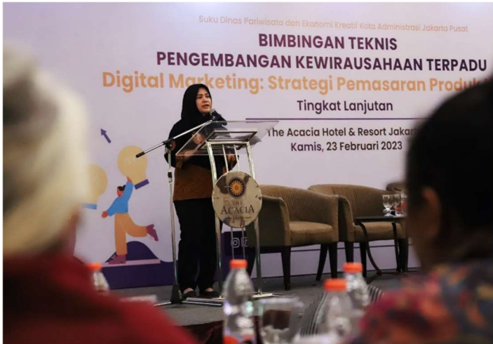
Bimtek pengembangan kewirausahaan terpadu.

Perekonomian & Pemb 23 Feb, 2023 Reporter: Farandy Purba | Editor: Andreas Pamakayo