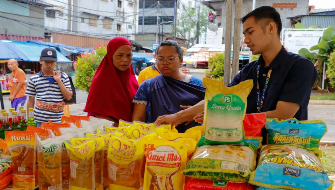
Pangan murah di halaman Rusun Karang Anyar.