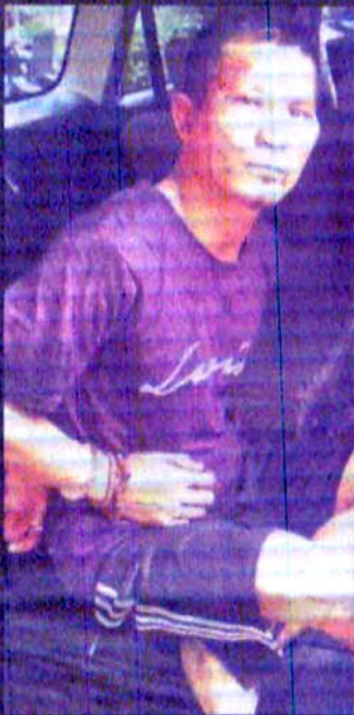
Pelaku penusukan Satpol PP.

♦ Tak Terima Diterbitkan dari Jalan MH Thamrin KRONOLOGI