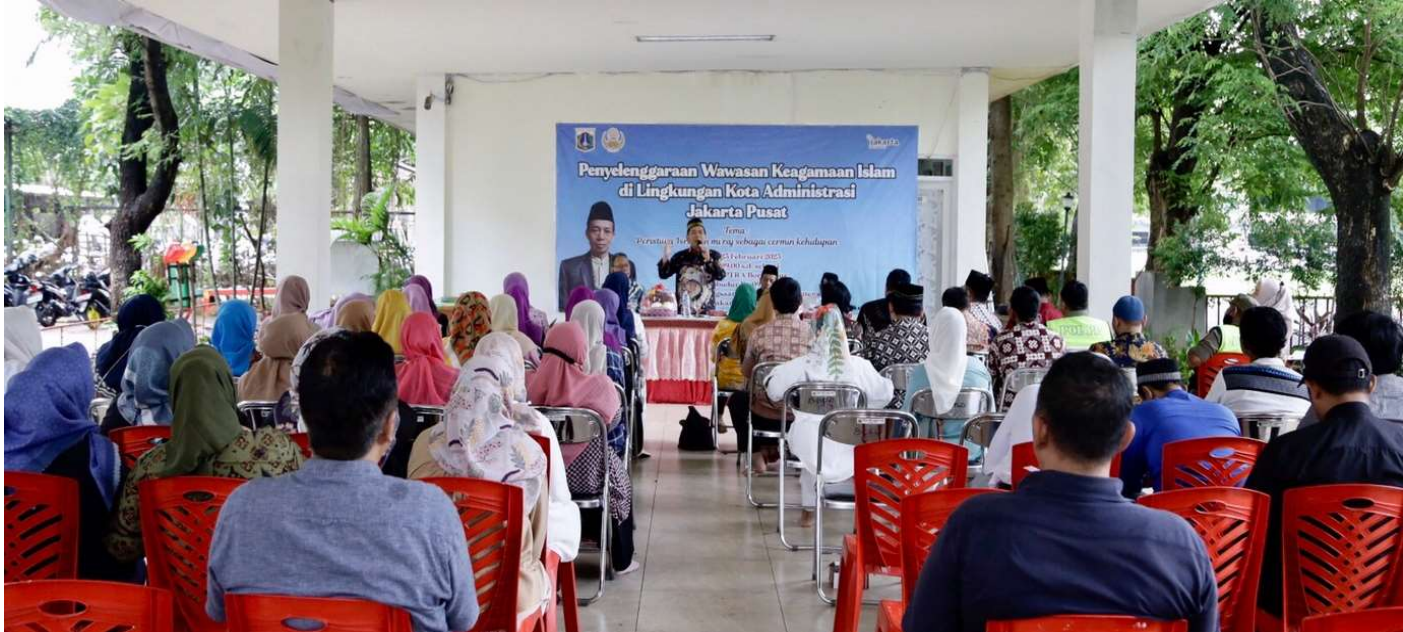
Wawasan keagamaan Islam di RPTRA Borobudur.

Kesra 23 Feb, 2023 Reporter: Berlian Sigit | Editor: Andreas Pamakayo