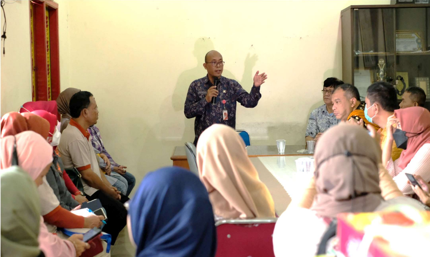
Asekbang memberikan arahan kepada pengurus RW 09 terkait kampung proklamasi.

Perekonomian & Pemb 23 Feb, 2023 Reporter: Vhatra | Editor: Andreas Pamakayo