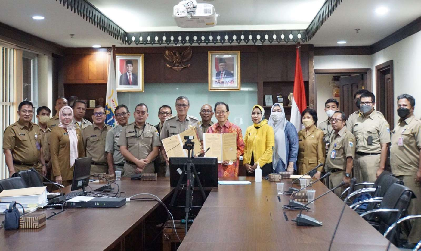
Penandatanganan BAST.

Perekonomian & Pemb 21 Mar, 2023 Reporter: Andreas Pamakayo | Editor: Andreas Pamakayo