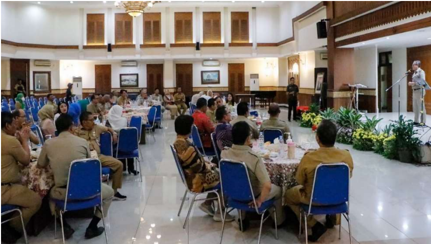
Munggahan dan lepas sambut pejabat di lingkungan Kota Administrasi Jakarta Pusat.

Kesra 21 Mar, 2023 Reporter: Maulana | Editor: Andreas Pamakayo