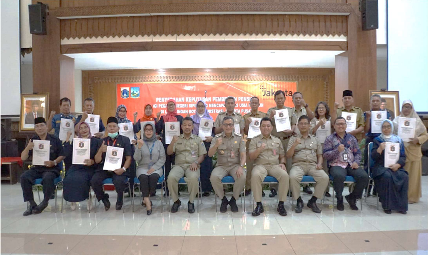
Penyerahan SK Pensiun kepada 18 ASN.

Pemerintahan 21 Mar, 2023 Reporter: Malik Maulana | Editor: Andreas Pamakayo