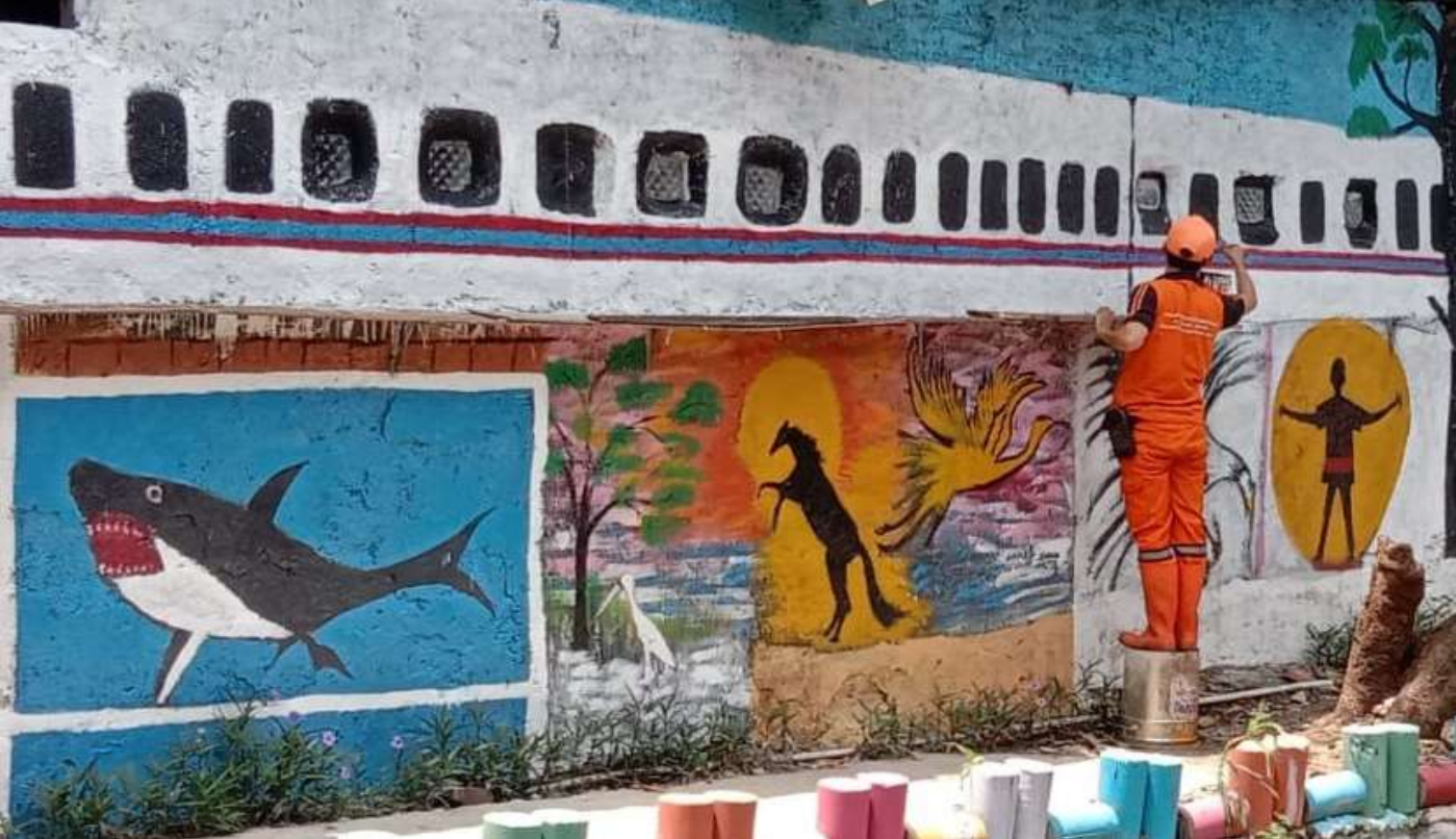
Penataan kawasan di wilayah Kelurahan Kampung Bali.