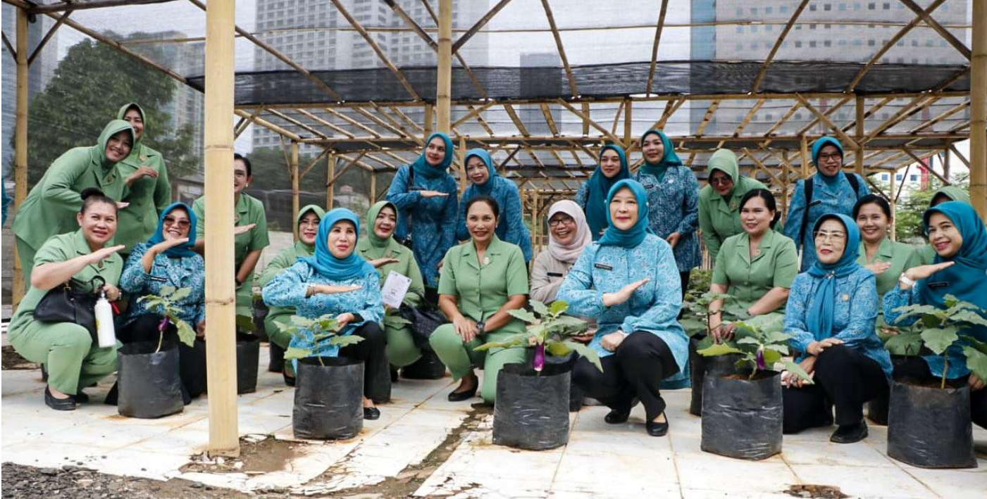
Penyerahan 10.000 tanaman terong dan cabai.

Perekonomian & Pemb 24 Jan, 2023 Reporter: Maulana | Editor: Andreas Pamakayo