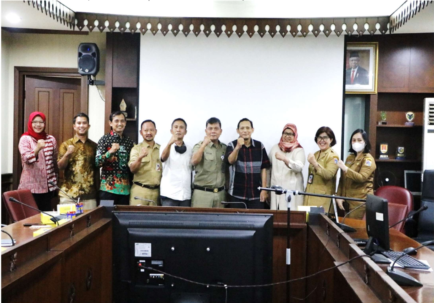
Asminkesra menerima MD KAHMI.