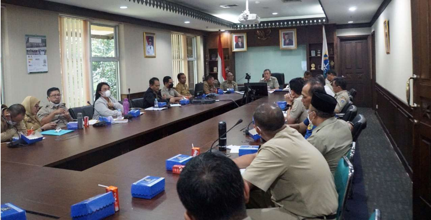
Rapat terbatas di Ruang Rapat Wali Kota, Kantor Wali Kota Jakarta Pusat, Jalan Tanah Abang I, Gambir, Selasa (24/1).