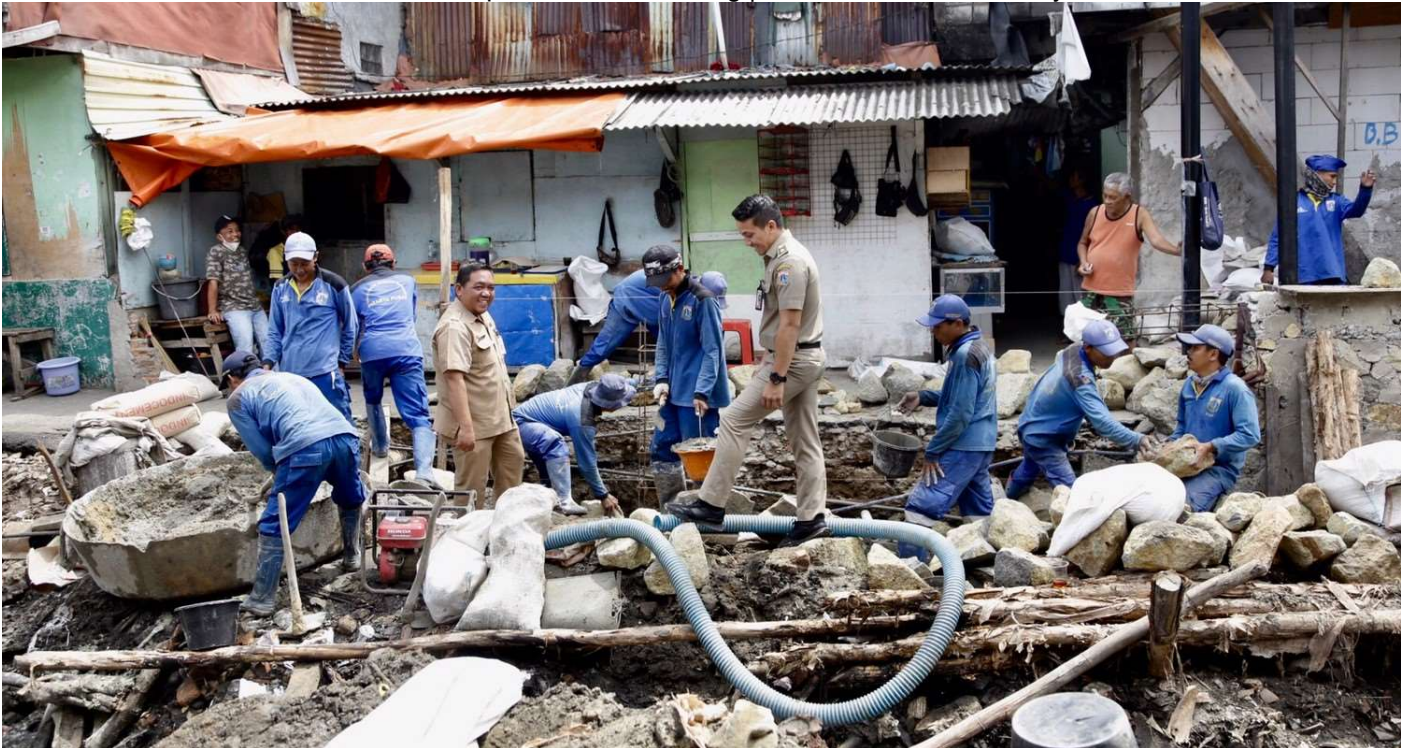
Petugas SDA membuat turap, di Kali Anak Ciliwung RW 08 dan RW 02, Kelurahan Mangga Dua Selatan.