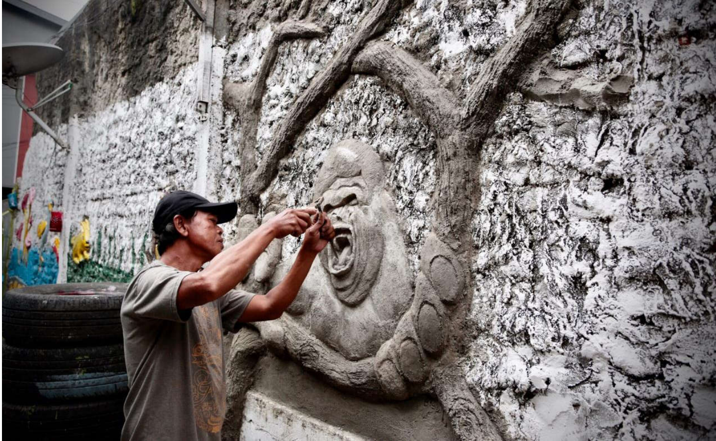
Penataan Kawasan Kelurahan Duri Pulo Capai 95 Persen.