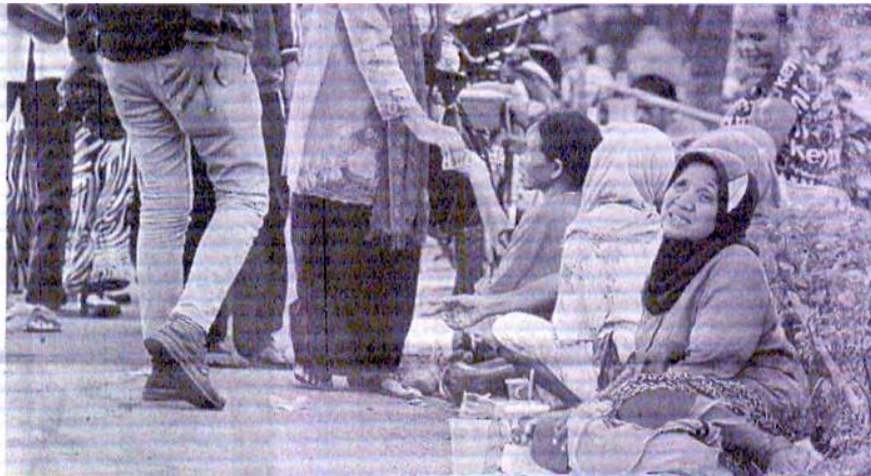
PENGEMIS MUSIMAN: Pengemis berjejer menanti uluran tangan peziarah di Taman Pemakaman Umum (PU) Karet Bivak, Jakarta, Senin (28/7). Setiap bulan Ramadan, pengemis musiman menyerbu Jakarta. Mereka menadahkan tangan di sejumlah lokasi strategis seperti di depan Masjid, lampu merah dan pasar.

"Kami menemukan panti-panti yang tidak dirawat dengan baik, dan pelayanannya tidak ramah," ujarnya. ■ DRS