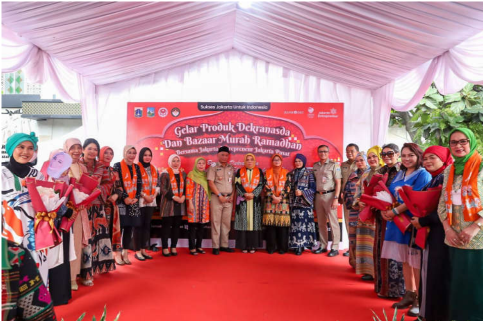
Pemkot Jakpus Menggelar Produk Dekranasda dan Bazar Murah Ramadan.

Perekonomian & Pemb 28 Mar, 2023 Reporter: Malik Maulana | Editor: Iman