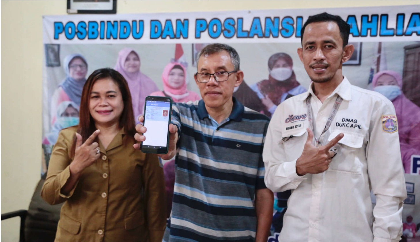
Dukcapil Kelurahan Johar Baru Gelar Pembuatan Identitas Kependudukan Digital.

Suku Dinas (Sudin) Kependudukan dan Catatan Sipil (Dukcapil) Sektor Kelurahan Johar Baru menggelar pembuatan identitas kependudukan digital (IKD) di Pos RW 04. Kegiatan ini bertujuan untuk mempermudah masyarakat mendapatkan akses terkait administrasi kependudukan.