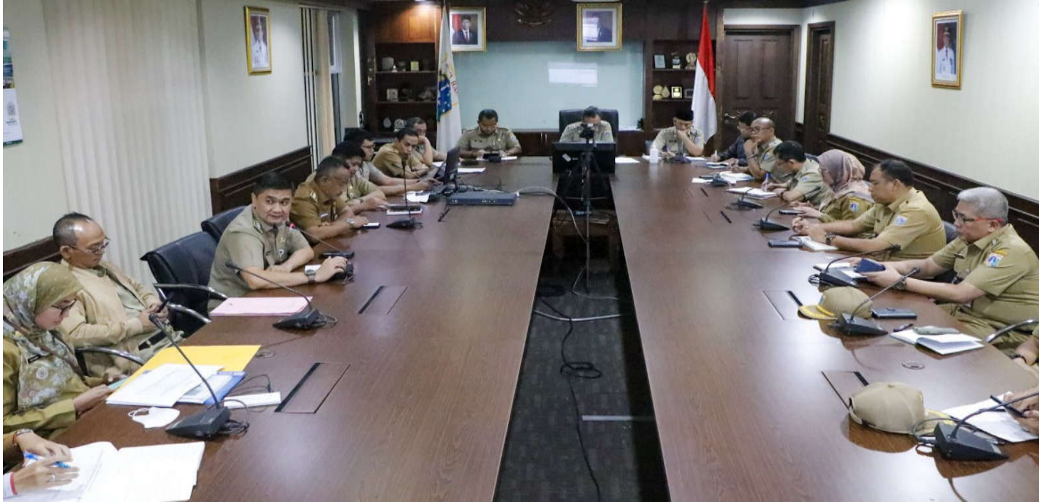
Persiapan HUT RI dan Antisipasi Inflasi Daerah Menjadi Bahasan Rapim.

Perekonomian & Pemb 28 Mar, 2023 Reporter: Maulana Yusuf | Editor: Iman