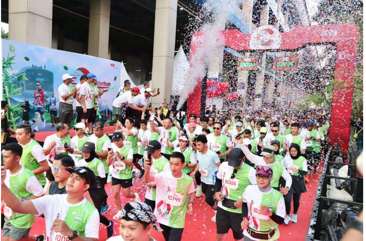
Commuter Run 2024, di Stasiun BNI City.

Perekonomian & Pemb 8 Sep, 2024 Reporter: Zaki Ahmad Thohir | Editor: Andreas Pamakayo