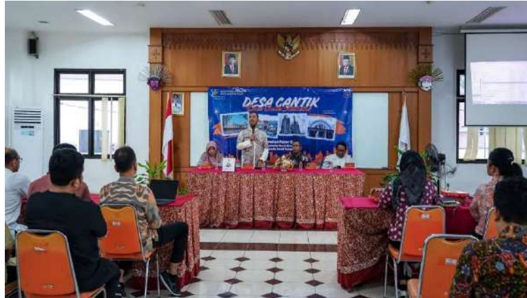
Pembinaan Desa Cinta Statistik, di aula kantor Kelurahan Pasar Baru.

Pemerintahan 6 Sep, 2024 Reporter: Maulana | Editor: Andreas Pamakayo