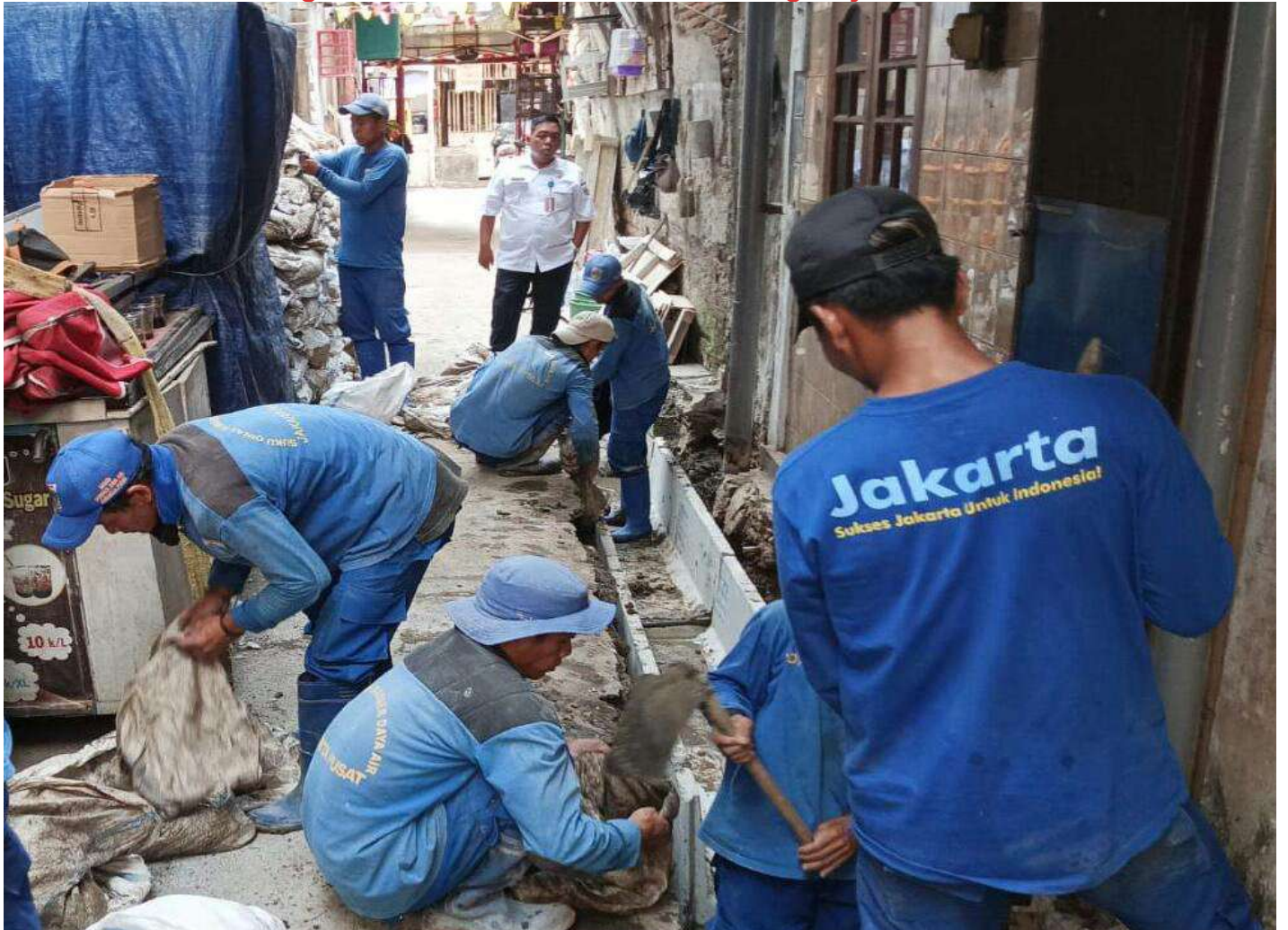
Pasukan biru Satuan Tugas (Satgas) Sumber Daya Air (SDA) Kecamatan Sawah Besar dengan peralatan manual membersihkan saluran.

JAKARTA – Bertahun-tahun saluran tidak berfungsi sepanjang 155 meter di permukiman padat penduduk, Jalan B1 RT 007 RW 04 Karang Anyar, Sawah Besar, Jakarta Pusat akhirnya dibedah pasukan biru Satuan Tugas (Satgas) Sumber Daya Air (SDA) Kecamatan Sawah Besar dengan peralatan manual.