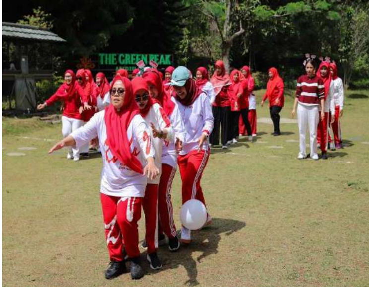
Pelaksanaan ujung prestasi.

Pemerintah Kota (Pemkot) Administrasi Jakarta Pusat bersama Dharma Wanita Persatuan (DWP) dan Tim Penggerak Pemberdayaan Kesejahteraan Keluarga (TP PKK) Kota Administrasi Jakarta Pusat menyelenggarakan kegiatan silaturahmi serta apresiasi dan unjuk prestasi dalam memperkuat harmoni kesatuan dan persatuan anggota.