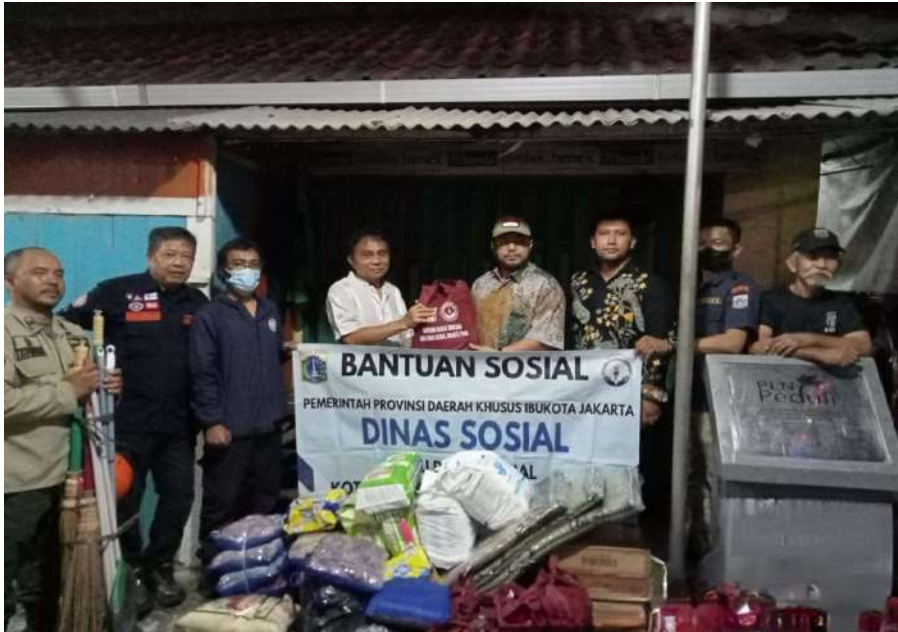
Penyerahan bantuan bagi warga terdampak kebakaran Pejambon.

Kesra 6 Sep, 2024 Reporter: Berlian Sigit | Editor: Andreas Pamakayo