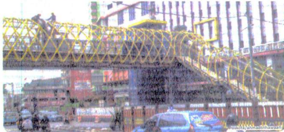
Aktivitas pekerja saat menyelesaikan pembangunan Jembatan Penyeberangan Orang (JPO) PGC Cililitan, Dewi Sartika, Jakarta Timur.

Seperti di JPO PGC dan JPO Dukuh Atas, saat ini progres pembangunan telah mencapai 70 persen.