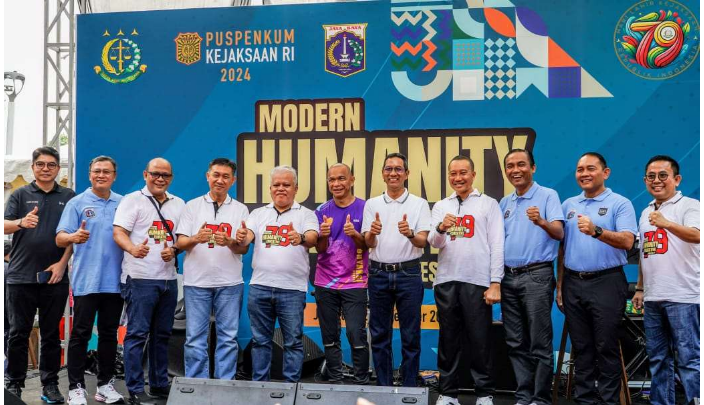
Pameran Kinerja Publikasi Keterbukaan Informasi Publik Kejaksaan RI, di Terowongan Kendal.

Pemerintahan 22 Sep, 2024 Reporter: Rio Cornelianto | Editor: Andreas Pamakayo