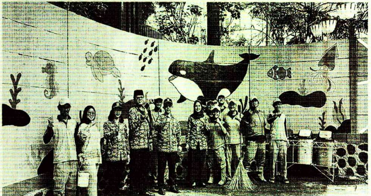
Penataan wilayah Kampung Bali dilakukan jajanan kelurahan.

"Saya berharap penataan yang dikerjakan ini bisa bermanfaat untuk masyarakat, mengurangi resiko kenakalan remaja, dan bisa melestarikan lingkungan dengan mengedukasi masyarakat untuk peduli lingkungannya," pungkasnya. (*den)