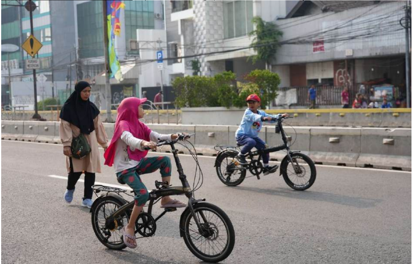
HBKB di Jalan Suryopranoto, Kecamatan Gambir, Minggu (22/9) pagi.

Perekonomian & Pemb 22 Sep, 2024 Reporter: Berlian Sigit | Editor: Andreas Pamakayo