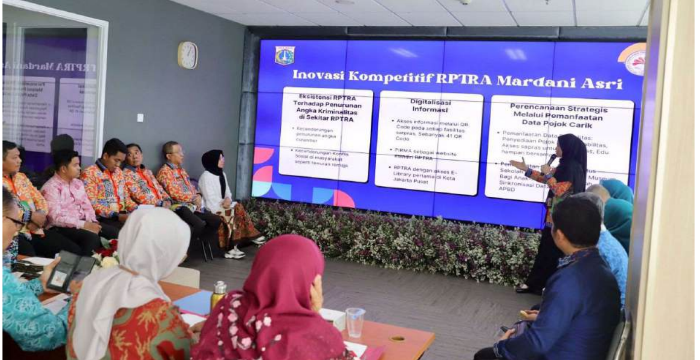
Paparan Kinerja RPTRA Mardani Asri.

Kesra 29 Aug, 2024 Reporter: Zaki Ahmad Thohir | Editor: Andreas Pamakayo