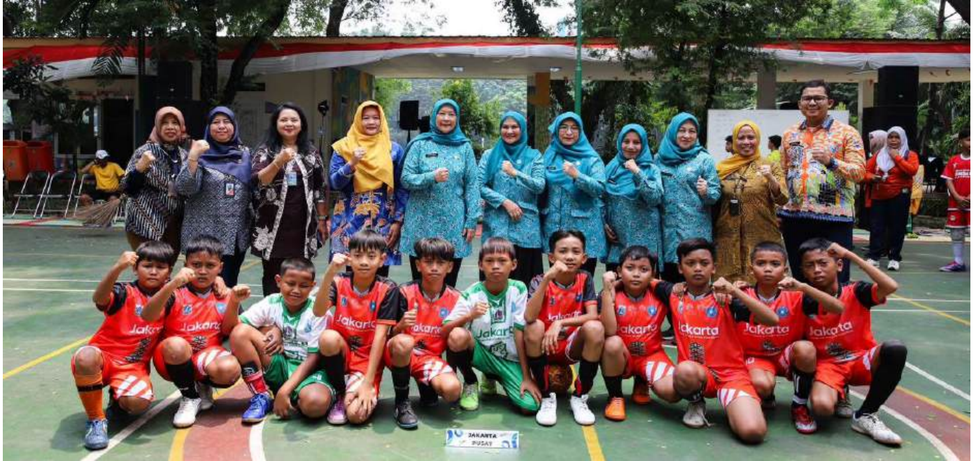
Gebyar RPTRA di RPTRA Borobudur.

Kesra 29 Aug, 2024 Reporter: Malik Maulana | Editor: Andreas Pamakayo