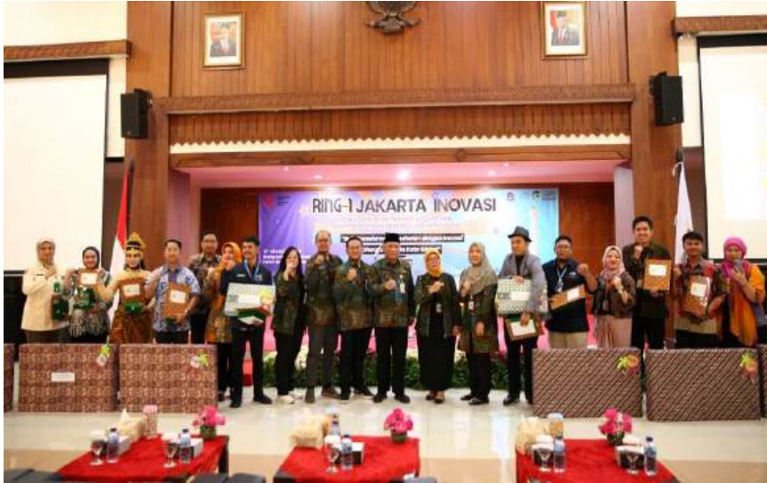
Penyerahan apresiasi pemenang lomba Inovasi Kesehatan Tingkat Kota.

Kesra 29 Aug, 2024 Reporter: Andre | Editor: Andreas Pamakayo