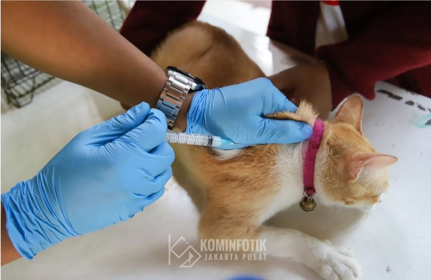
Ilustrasi.